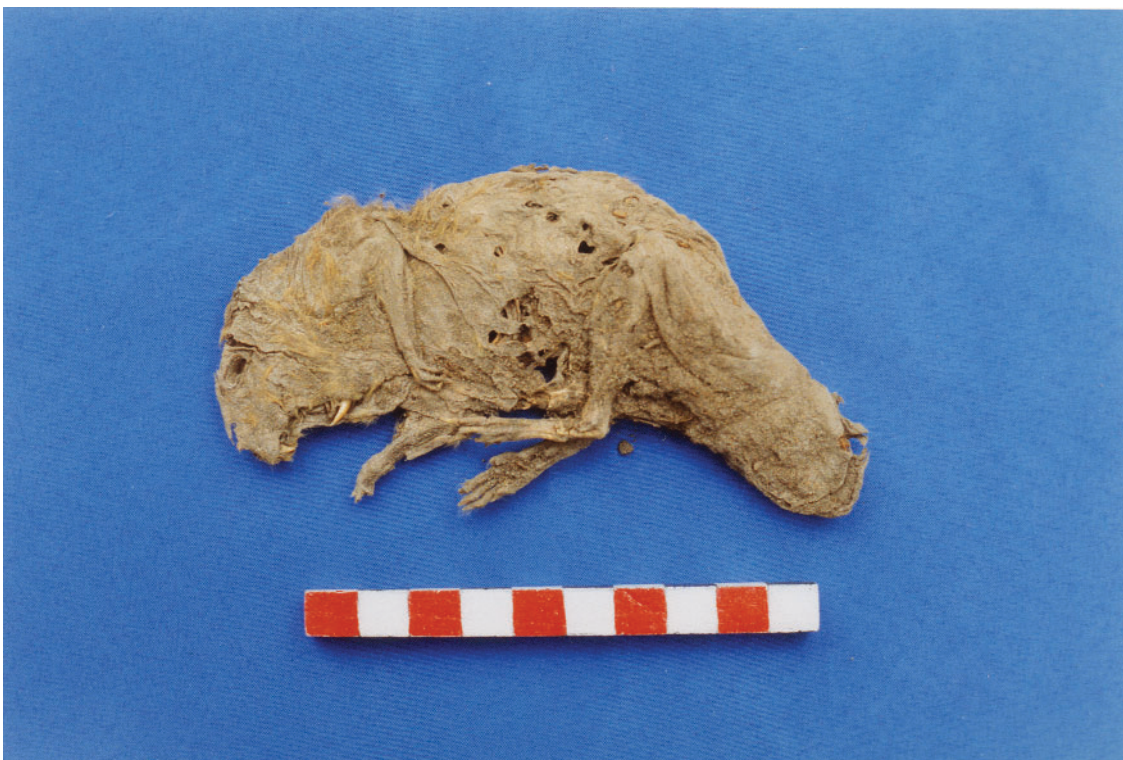
Foto 35: Mumifiziertes Meerschwein ( Cavia porcellus - S 2 - Fl. 8 - Pl. 1-2)