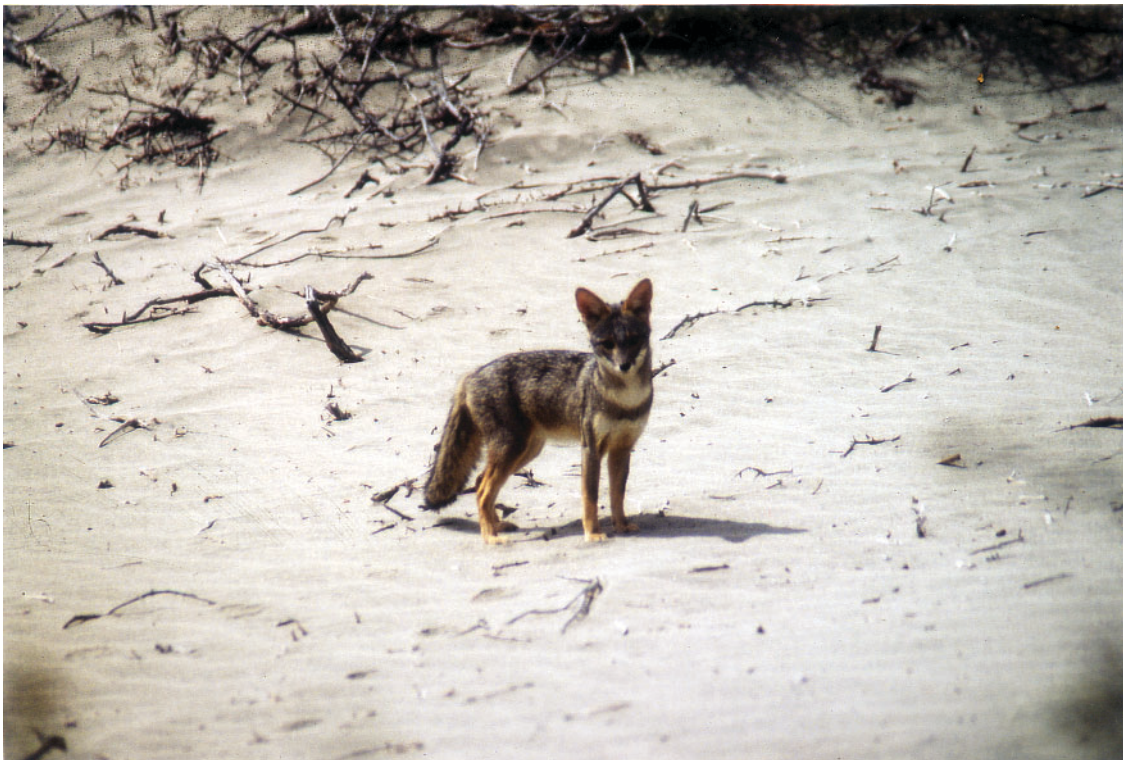
Foto 39: Wüstenfuchs ( Lycalopex sechurae ) in Puerto Pobre, Casma-Tal