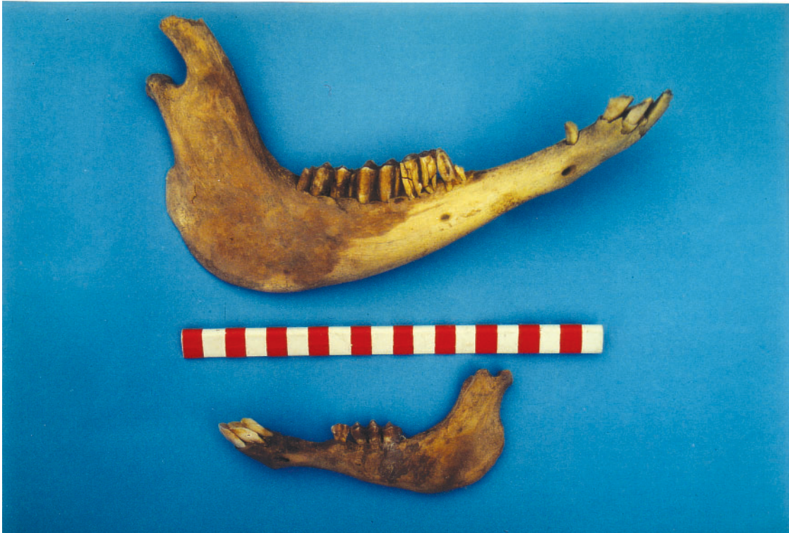
Foto 32: Rechter Unterkiefer eines 8 Jahre alten Lamas (oben - S 1 - Fl. 8 - Pl. 6) und linker Unterkiefer eines ca. 6 Monate alten Lamas (unten - S 2 - Fl. 5 - Pl. 4-5)