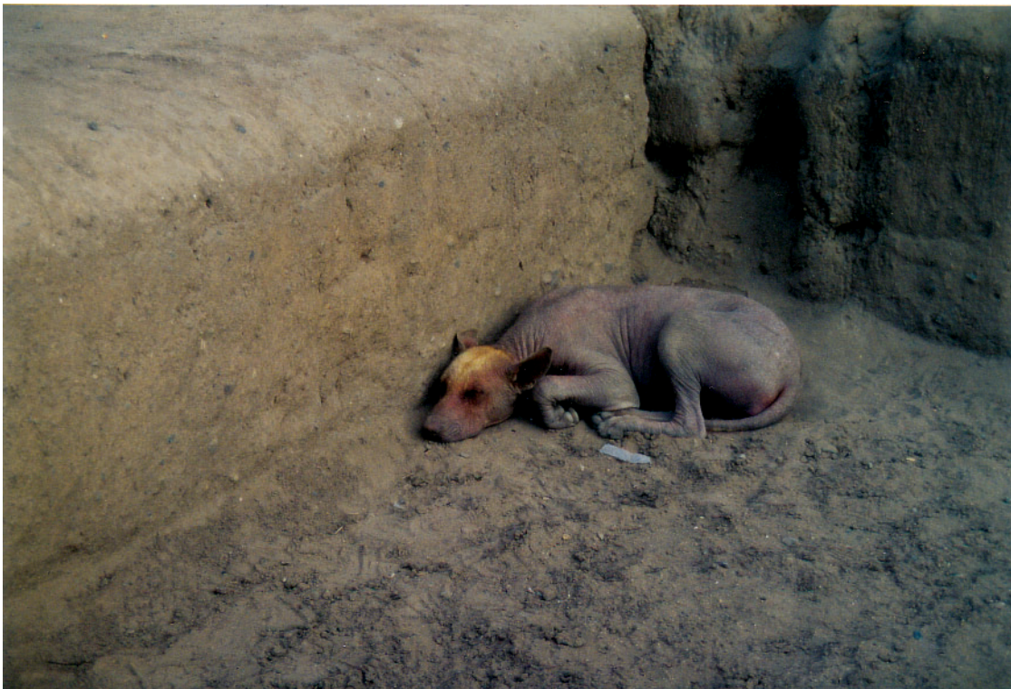
Foto 37: Haarloser Hund ( Canis familiaris sechurae ) in Chan Chan