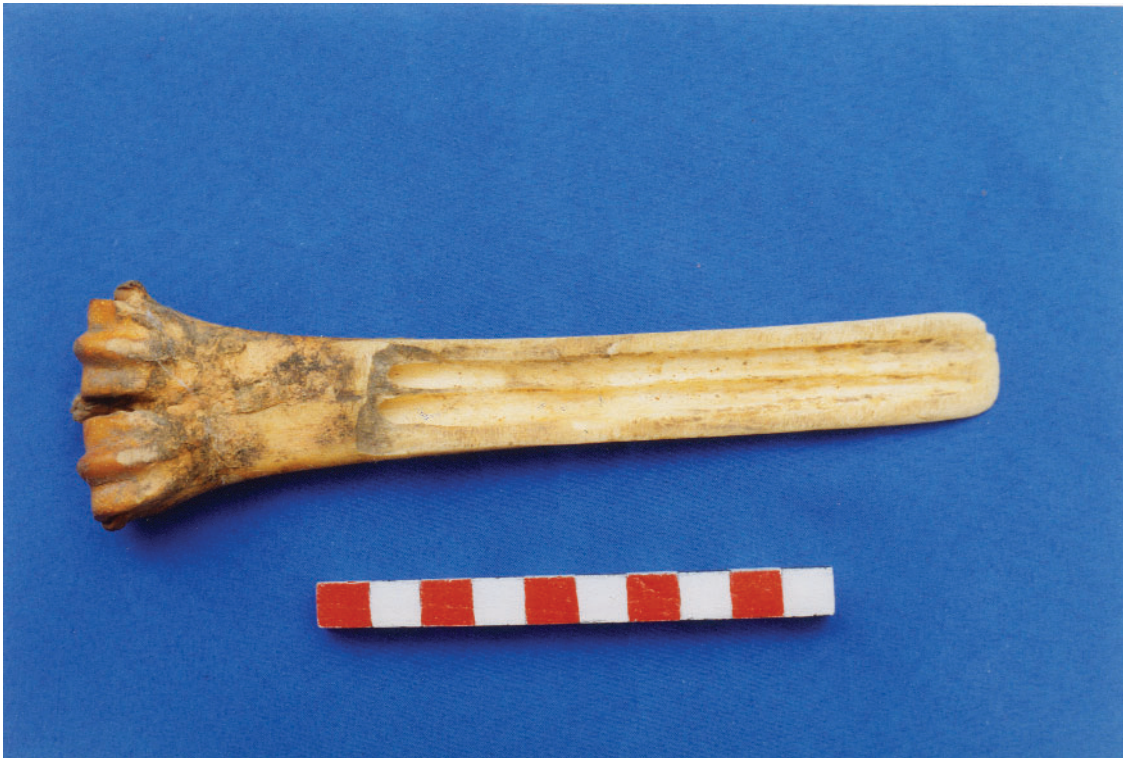
Foto 34: Wichuña aus dem Metapodium eines Kameliden (S 1 - Fl. 8 - Pl. 5-6)