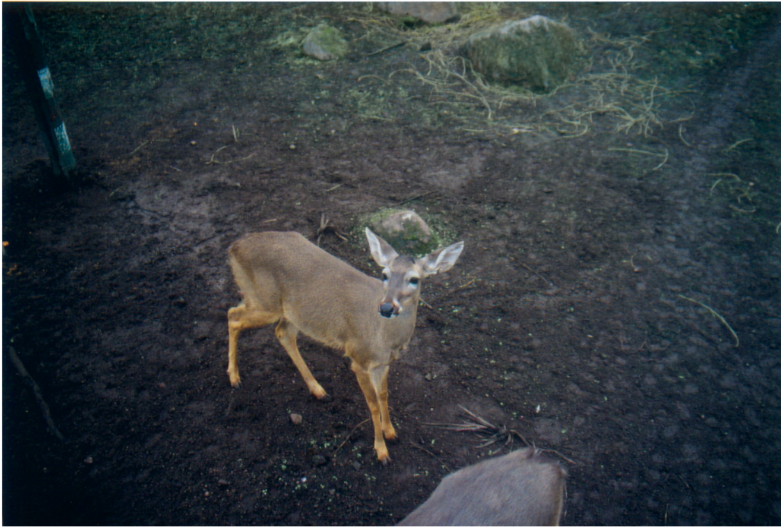
Foto 38: Weißwedelhirsch ( Odocoileus virginianus ) in den lomas von Lachay