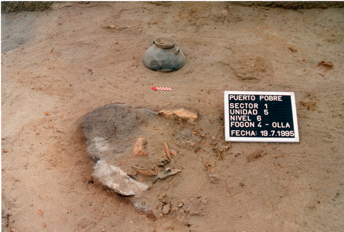
Foto 8: Feuerstelle und Chimù-Kugeltopf (S 1 - Fl. 5 - Pl. 6 - nach O)