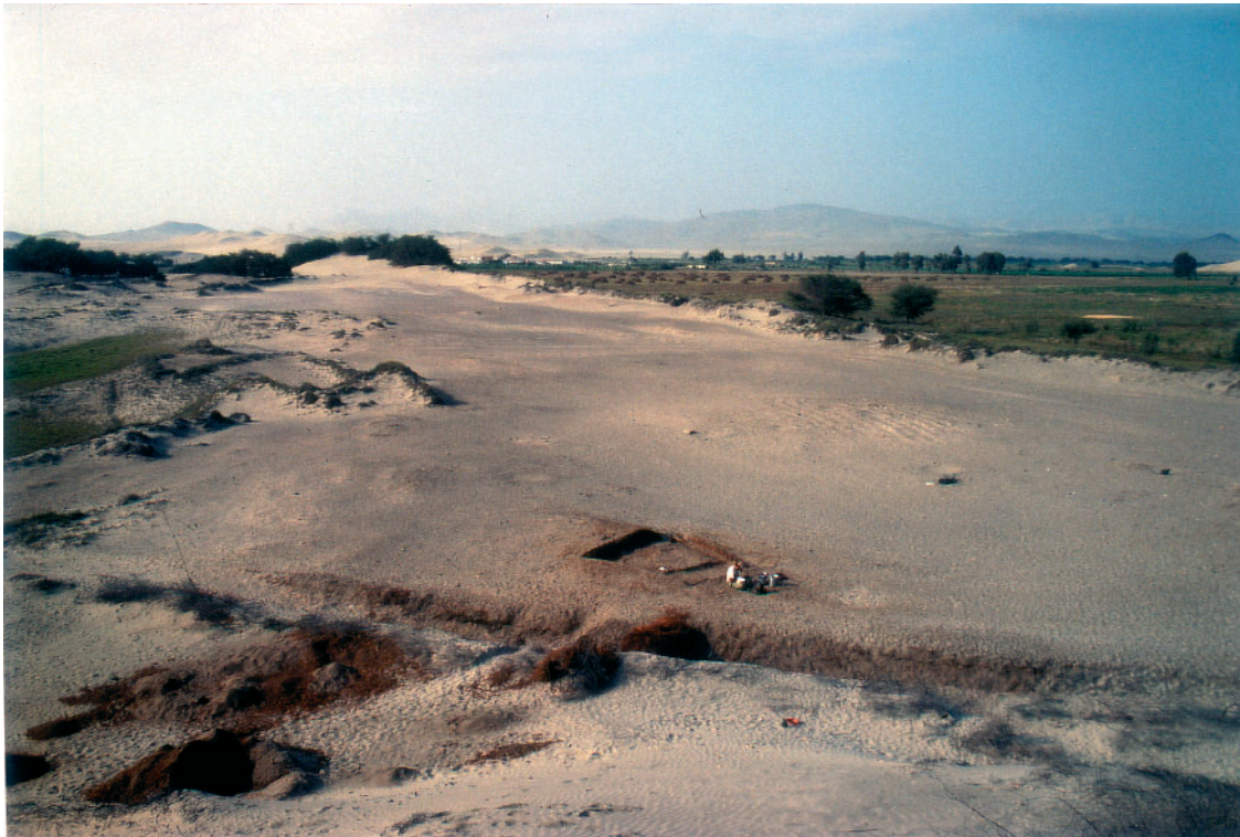
Foto 4: Blick auf die Casma-Rohrhützensiedlung (S 1 - nach NO), Puerto Pobre