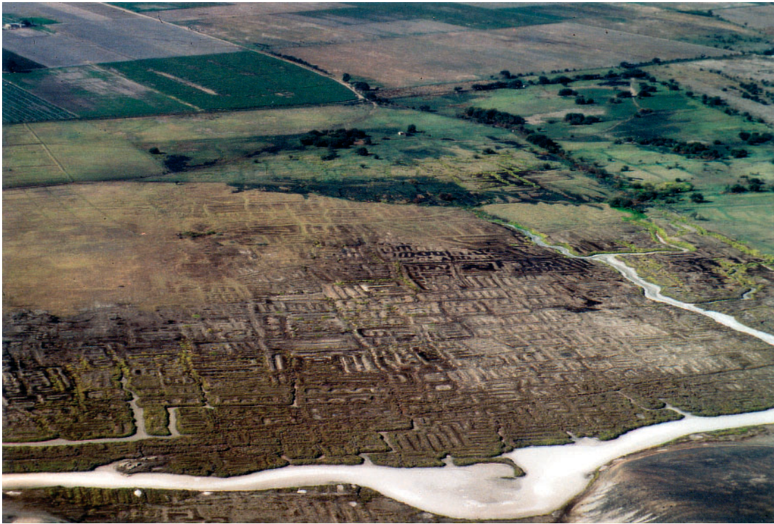
Foto 2: Vorspanische Feldsysteme im unteren Casma-Tal (La Monenga)