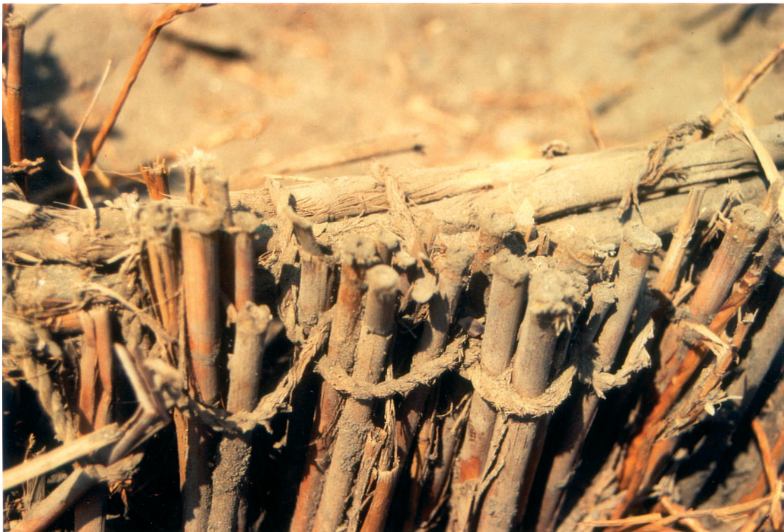
Foto 7: Mit Stricken aus titora -Schilf festgebundene Rohrstengel (S 1 - Fl. 2)