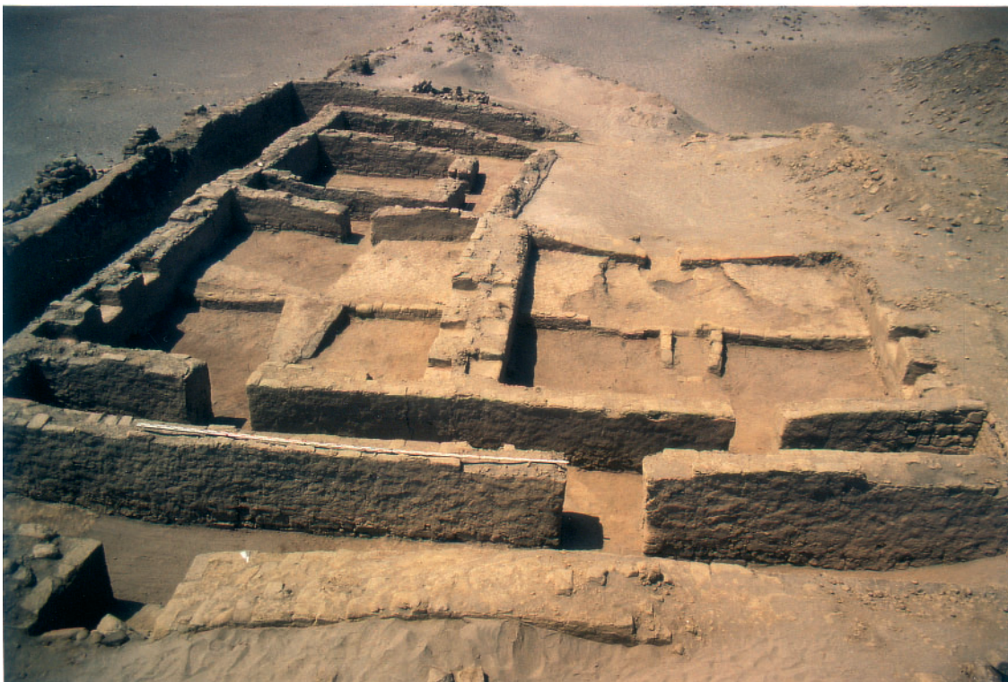
Foto 13: Grabungsfläche 1 mit Nischenräumen und Korridoren (S 2 - nach S)