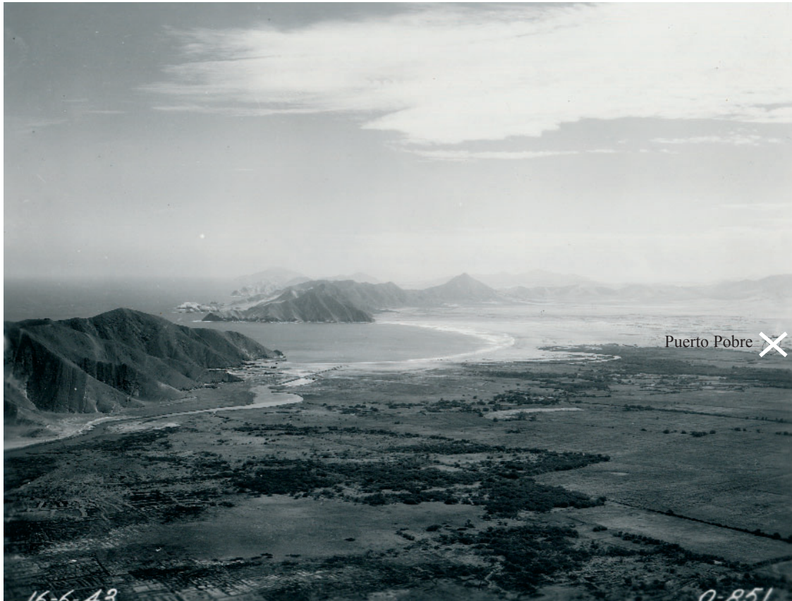
Foto 1: Das untere Casma-Tal (Luftbildaufnahme - SAN-Lima - O-851 mit Lage von Puerto Pobre)