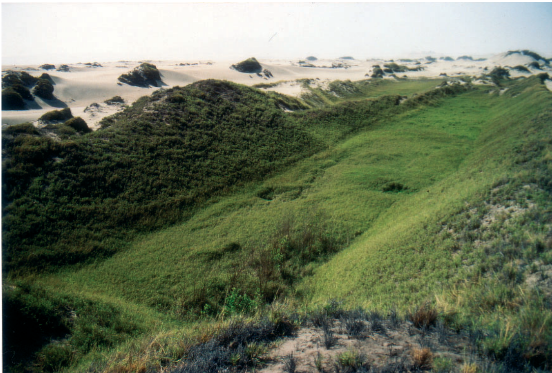
Foto 3: Wasserreservoir ( wachaque ) westlich des Chimù-Verwaltungszentrums (S 2)