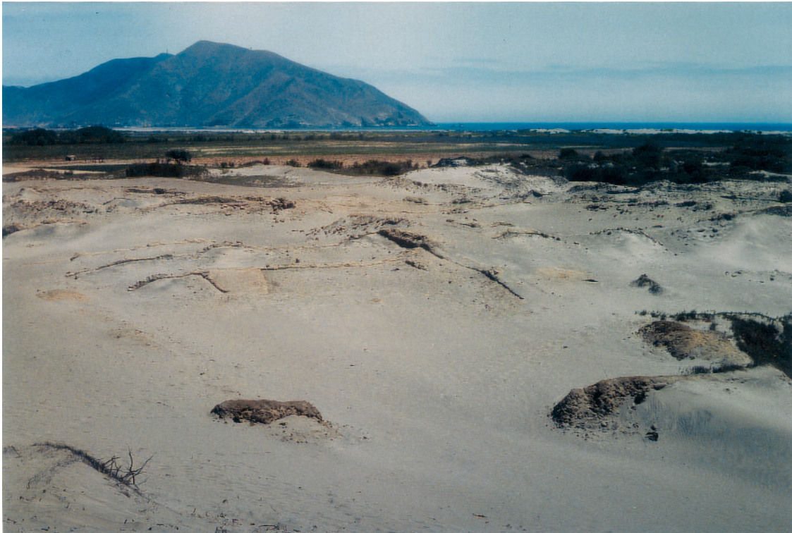
Foto 12: Blick auf das Chimù-Verwaltungszentrum (S 2 - nach SW), Puerto Pobre