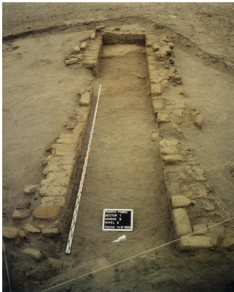
Foto 11: U-förmiger Bestattungsbau (S 1 - Fl. 9 - Pl. 3 - nach SO)