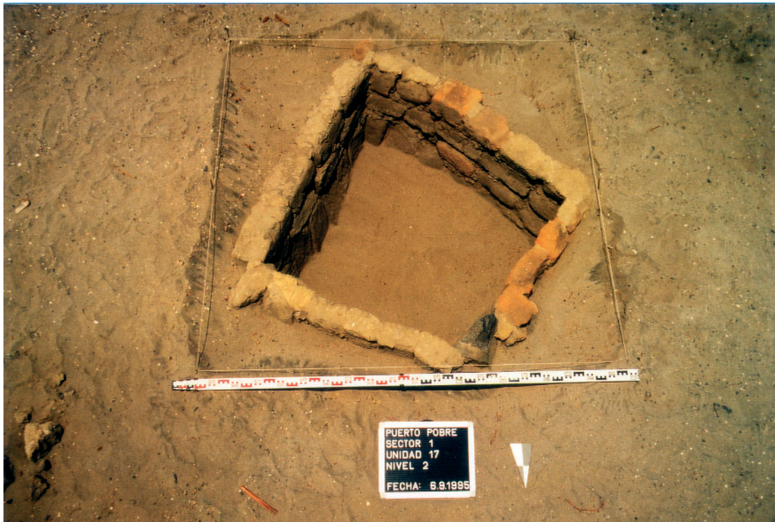
Foto 10: Meerschweingehege ( cuyero ) (S 1 - Fl. 17 - Pl. 2 - nach S)