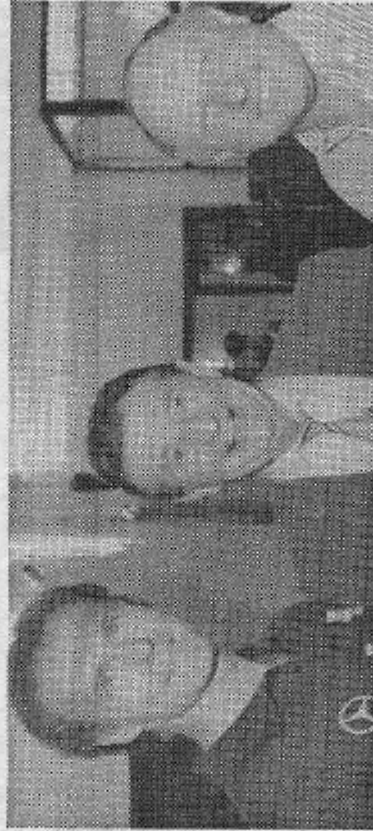
DAS TRIO der DFB-Ehrenspielführer: Franz Beckenbauer, Fritz Walter, Uwe Seeler.

ben mag. „Auf eine Verletzung schon zur Legende gebracht, der Littbarski aber hat sich nicht einmal durchsetzen können. Franz Beckenbauer habe ihm den Tip gegeben, sich dran zu gewöhnen, erzählt er lapidar. Als wäre die Mißachtung als Gewohnheitssache leichter zu ertragen. „Blöd, unangenehm, daß man nicht noch höher gekommen habe, sagt Uwe Seeler, „sonst wären wir bei den Fans