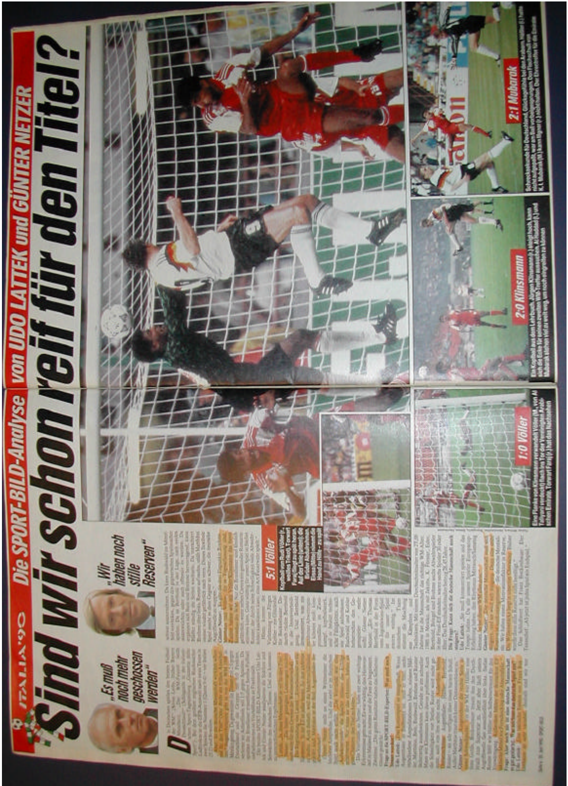
"Sport-Bild" vom 20.6.1990, S. 6/7