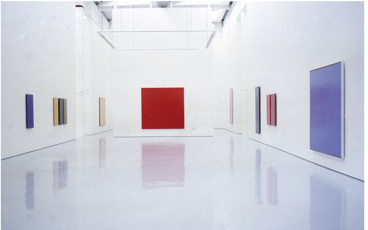
oben: Abb. 26: Atelier von Frederic Matys Thursz in Ossining, NY