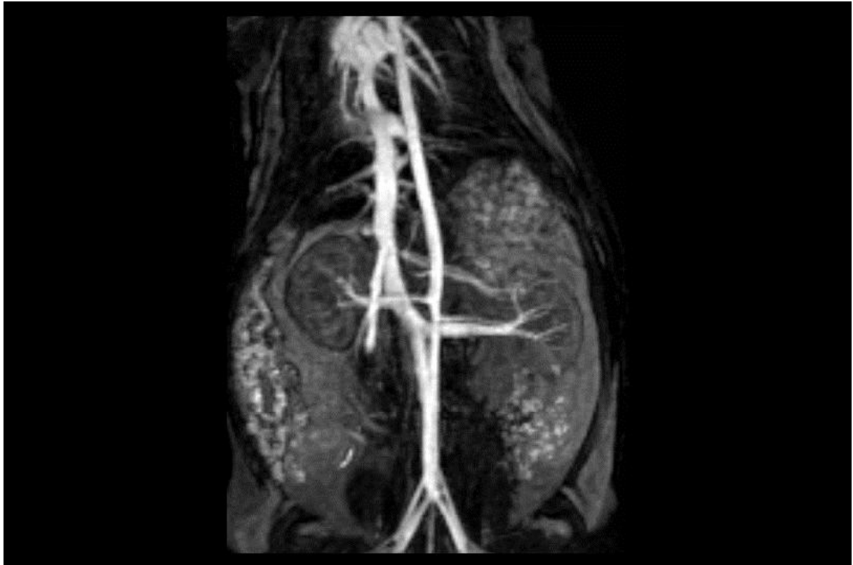
Abb. 5: Darstellung der Gefäße als MIP in der Equilibriumphase 5 Minuten nach Injektion von 30 \mu\text{mol Fe/kg KM} des Kontrastmittels VSOP-C63