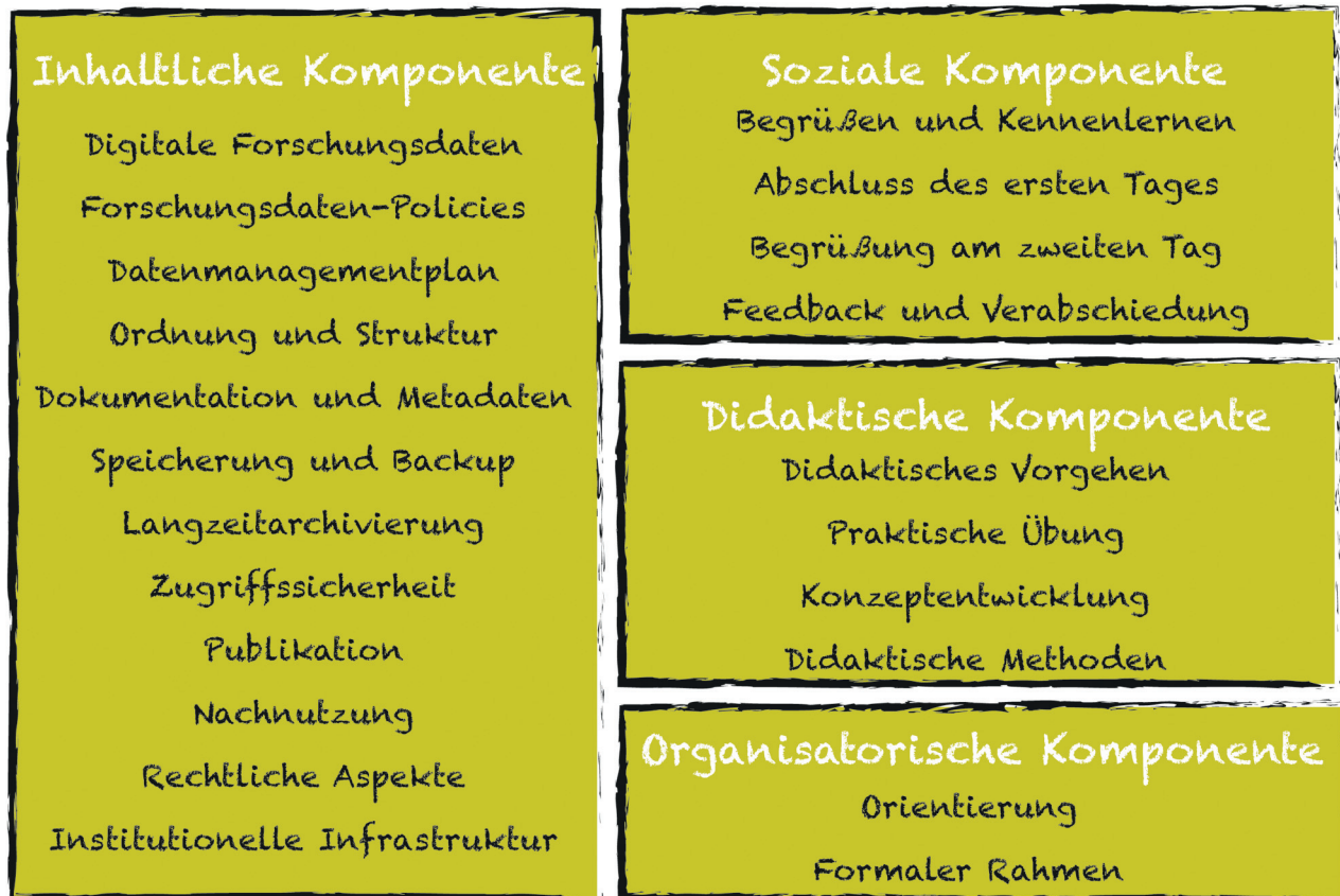
Abbildung 1: Komponenten des Train-the-Trainer Programms zum Forschungsdatenmanagement.

Die didaktische Komponente zielt auf die Art und Weise der Wissensvermittlung ab. Im einfachsten Fall können die angewandten Methoden direkt übernommen werden. Darüber hinaus beinhaltet das Konzept eine Reihe von Einheiten, die sich der Erläuterung der angewandten Methoden, deren Zielen und Wirkung widmen. Es werden Schritte der Konzeptentwicklung vorgestellt und die Theorie der (Erwachsenen)Didaktik erläutert. Die Teilnehmenden haben die Möglichkeit, Methoden auszuprobieren sowie eigene Methoden anhand des neu erworbenen Wissens zu entwickeln. Bei dieser Vorgehensweise lernen auch Teilnehmende mit erweiterten FDM-Kenntnissen neue Wege zur Vermittlung von FDM-Inhalten kennen. Gleichzeitig wird die Übertragbarkeit der vermittelten und selbst erlebten Methoden in die eigene Schulungspraxis gefördert.