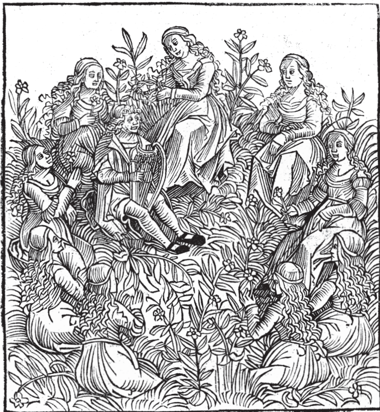
Abb. 1: Jacob Locher: Vitiosa sterilis mule/ ad Musam: roscida lepiditate predictam/ comparatio. Nürnberg 1506, f. A3v: Der Dichter im Kreis der Musen.

Cesaream laurum.victtricem/perpete fama: Vatribus imponis calliopea tuis. In prato viridi flores decerpis odoros . Cinnama/thura/rofas .hic tua secta legit.