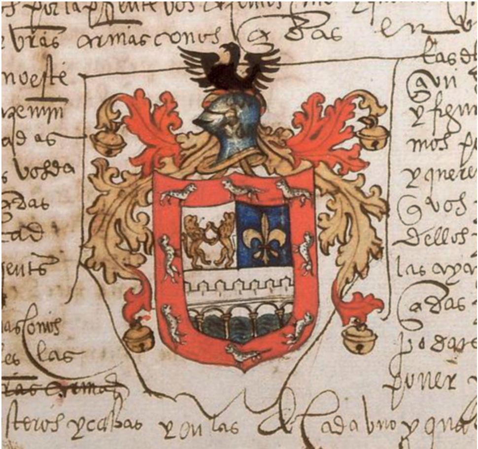
Fig. 1. Escudo de armas García del Pilar (1530). España. Ministerio de Cultura y Deporte. Archivo General de Indias, Sevilla, Mapas, planos, documentos iconográficos y documentos especiales, 11.

una concesión real podría en un momento en el futuro volver a desempeñar un papel importante en la creación de nuevas memorias entre los que fueron interrogados.