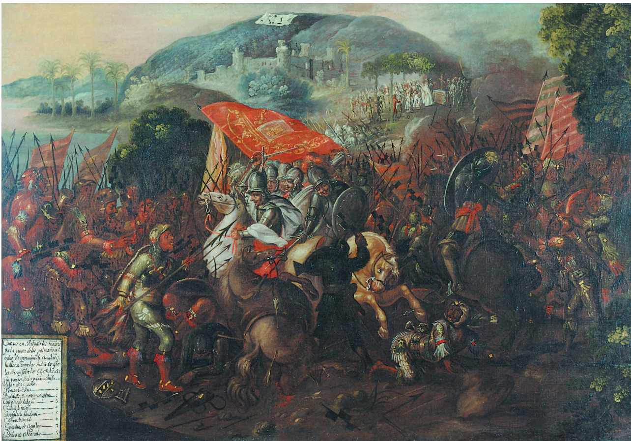
Fig. 2. Entrada de Cortés en Tabasco (segunda mitad siglo XVII). Jay I. Kislak Collection, Library of Congress, Washington.

Una preocupación similar parece haber inspirado a las personas que encargaron las pinturas de la serie de Kislak, las cuales visualizan escenas clave de la Historia verdadera . El primer lienzo de la serie muestra la llegada de los españoles a “Punta de los Palmares” en Tabasco, donde entraron en batalla con los totonacas (Rinke 2019, 135-139; fig. 2).