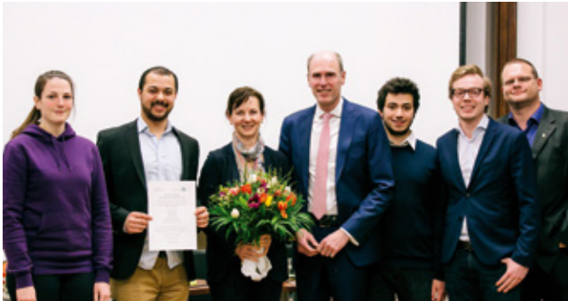
Das prämierte Team aus der Chemie hat ein Lehrprojekt zu Diversität in Molekularverbänden entwickelt.