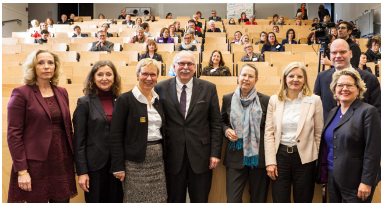
Vertreter*innen von Hochschul- und Wissenschaftsorganisationen und aus der Politik auf der Konferenz Gender 2020: