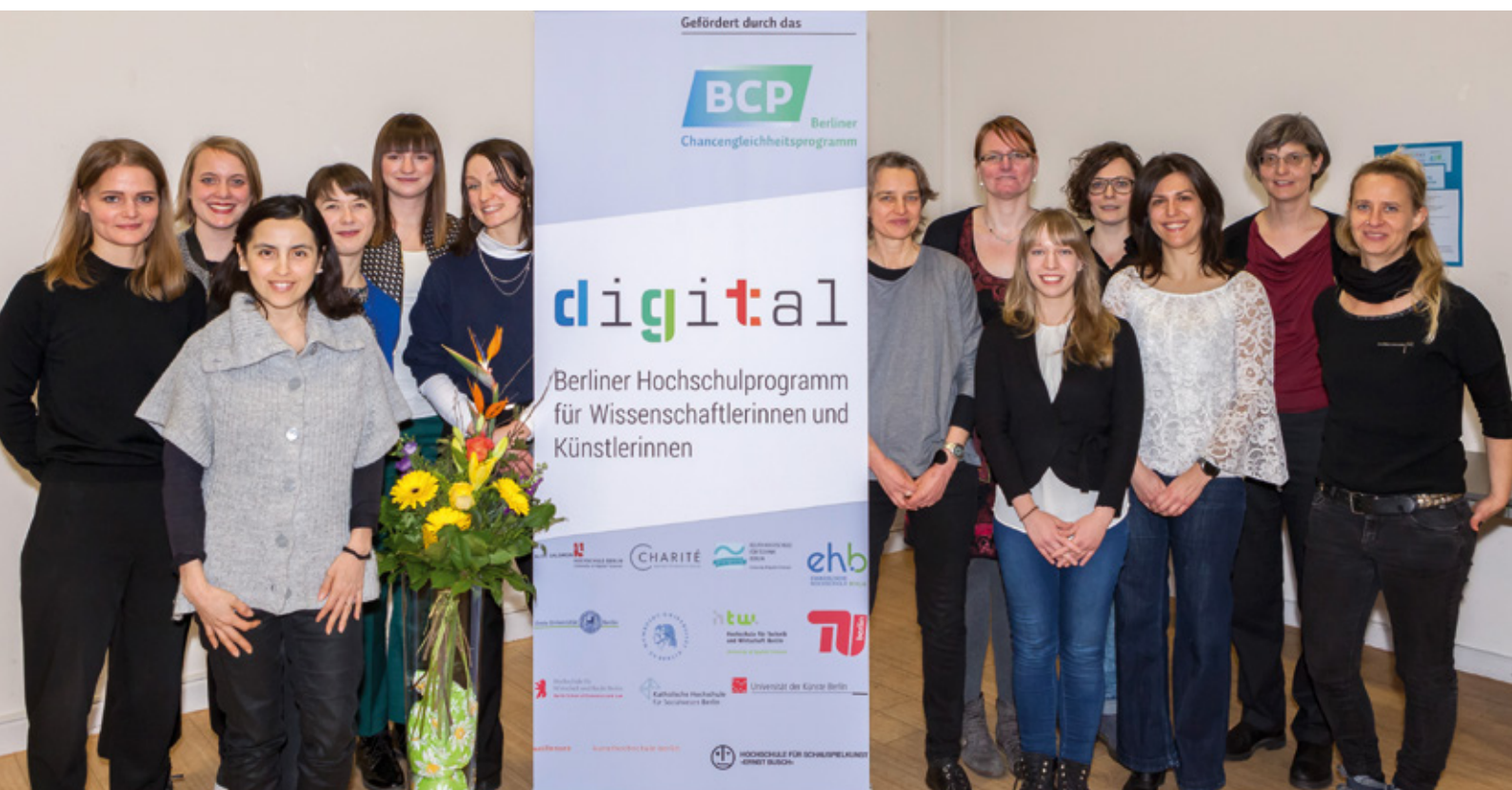
Das Berliner Hochschulprogramm „DiGiTal – Digitalisierung: Gestaltung und Transformation“ startete am 20. Februar 2018

wie der Berichtslegung betraut. Zu ihrem Tätigkeitsfeld gehören zudem die Öffentlichkeitsarbeit sowie die Betreuung des Alumnae-Netzwerkes. Die eingegangenen Anträge werden von einer Auswahlkommission bewertet, die die abschließenden Förderentscheidungen trifft. Die Kommission ist ein wesentliches Element der Qualitätssicherung des Berliner Chancengleichheitsprogramms. In der Zusammensetzung ihrer Mitglieder spiegelt sich die Berliner Dialogstrategie wider.