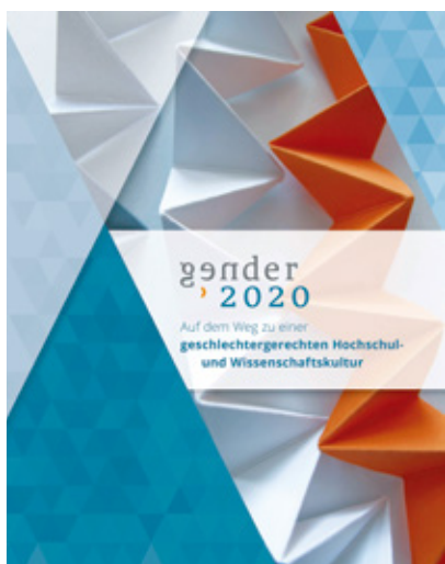
Die 2018 erschienene Broschüre dokumentiert die Konferenz ausführlich.