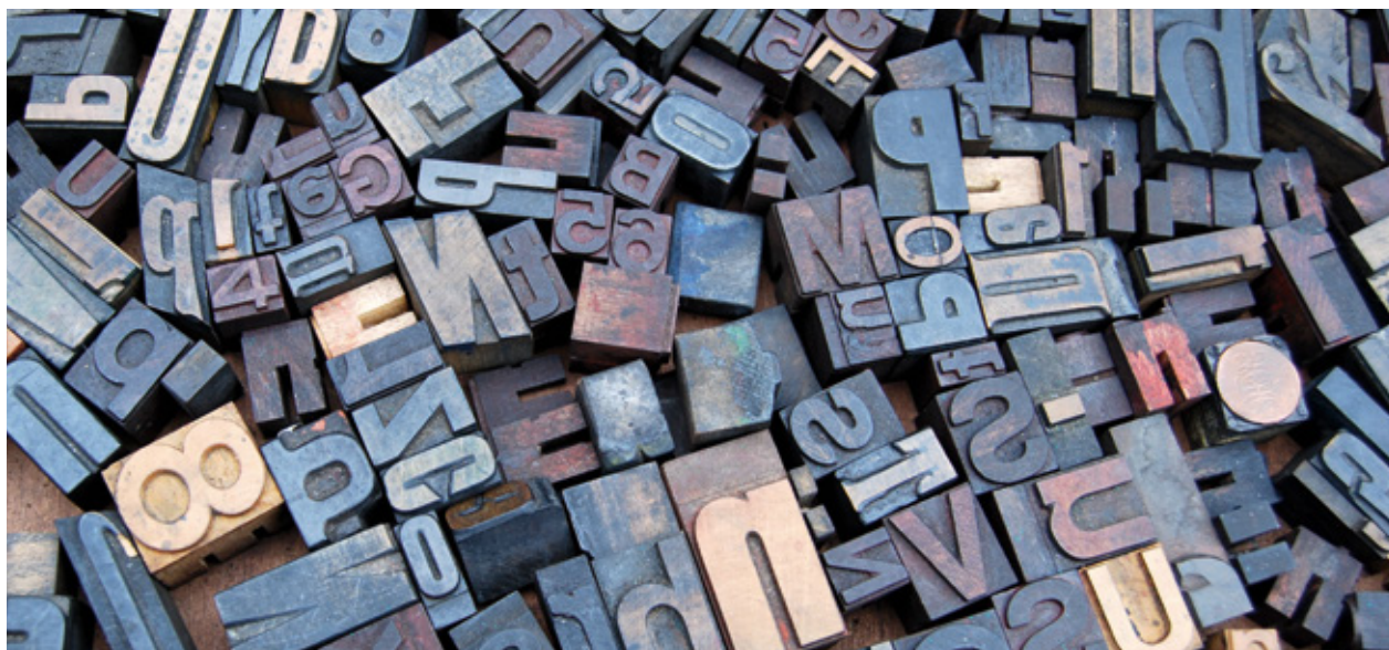
Alte Drucklettern (Druckbuchstaben) aus Holz in verschiedenen Farben und Größen.