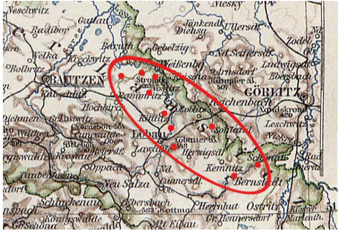
Abb. 1 | Schmidts Archäologisches Revier an der Grenze zur Preußischen Oberlausitz. Ausgehend von Löbau, untersuchte Schmidt zahlreiche der umliegenden vor- und frühgeschichtlichen Wallanlagen. 25 km östlich von Löbau liegt Görlitz, 1909 eines der Zentren des schlesischen Verwaltungsbezirkes Liegnitz und der archäologischen Forschung in der Region.

Schmidt praktizierte dieses Gebiet als sein Archäologisches Revier durch seine Forschungsarbeit und deren Anerkennung durch Archäologen und die interessierte Öffentlichkeit. Indem andere Archäologen wie Schuchhardt ihn um Zutritt auf dem Löbauer Berg und um eine gemeinsame Untersuchung baten, wurde diese Anerkennung ausgedrückt und Schmidts Revier bestätigt. Mit dem Widerspruch gegenüber Schmidts Deutungshoheit der regionalen Burgwälle wurden dagegen Zweifel an seiner Fachkompetenz in dieser Raumkonstruktion ausgedrückt, die Schmidt als Bedrohung seiner an das Archäologische Revier geknüpften Identität als Archäologe empfinden musste.