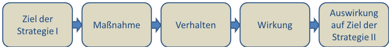
Abbildung 1: Schematische Darstellung einer Wirkungskette