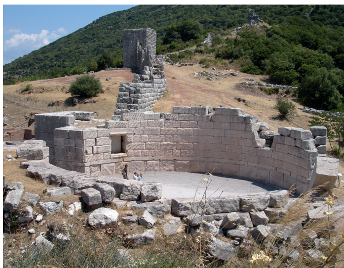
Abb. 2 | Stadtmauer von Messene, Arkadisches Tor mit Mauerverlauf nach Osten (von Westen gesehen).

Stellt man die Frage nach jenen Wissensbeständen, die wirksam werden, wenn Grenzen festgelegt, konstruiert und erinnert werden, für Stadtmauern, so tritt als erstes eine pragmatische Ebene des handwerklichen und fortifikatorischen Wissens hervor. Wissen über die Konstruktion von Angriffsmaschinen und dagegen wirksamer Befestigungstechnik sowie über den fortifikatorisch optimalen topographischen Verlauf manifestiert sich bei der Stadtmauer von Messene (Abb. 1 und 2), die Silke Müth untersucht, in der konkreten Konstruktionsweise der Mauern und Türme (zum Wechselspiel zwischen Poliorketik