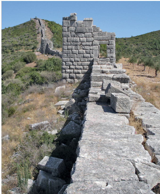
Abb. 1 | Stadtmauer von Messene, Nordwestabschnitt der Mauer (von Süden gesehen).