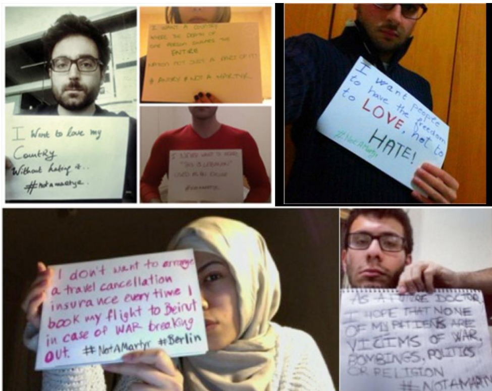
Abb. 2: Selfie-Protest #NotAMartyr , 2014