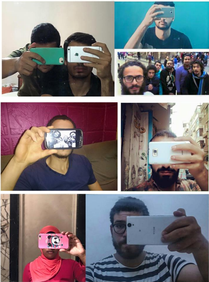
Abb. 5: Selfie-Protest „Freiheit für Atfal al-Shawarea“

#الحرية_لأطفال_الشوارع (Freiheit für Atfal al-Shawarea) wurde auf die Festnahme mit einem Selfie-Protest reagiert. Die Forderung wurde zusätzlich durch den Slogan „Macht die Handy-Kamera Dir Angst?“ (كاميرا التليفون بتهزك) flankiert. Für die Protest-Selfies inszenierten die Teilnehmerinnen und Teilnehmer sich jeweils mit ihrem Handy, mit dem sie sich vor einem Spiegel fotografierten, teilweise jedoch auch auf der Straße, in Anlehnung an die Aktionen von Atfal al-Shawarea. (Abb. 5) Dabei war das Handy meist so vor das Gesicht gehalten, dass das Gerät auf dem entstandenen Foto die Augen verdeckte; eine Variante der Anonymisierung, die die Kamera an die Stelle der Augen rückte. Hier wird die Kamera selbst zum Objekt und Attribut der Porträtierten, sie ist in diesem Kontext ein Symbol für politische und aktivistische Bildpraktiken, für Widerstand schlechthin. Denn die Handykamera stellt nicht nur den Bezug zu den im Netz verbreiteten Aufnahmen der Aktionen der „Straßenkinder“ her, sondern lässt sich generell auf die Beobachtung der Staatsgewalt und des öffentlichen Lebens durch die Bürgerinnen und Bürger beziehen, wie es während der Revolution in Ägypten 2011 eine selbstermächtigende dissidente Praxis geworden war – und sie recurriert nicht zuletzt auf die Praxis der Selfie-Proteste selbst.