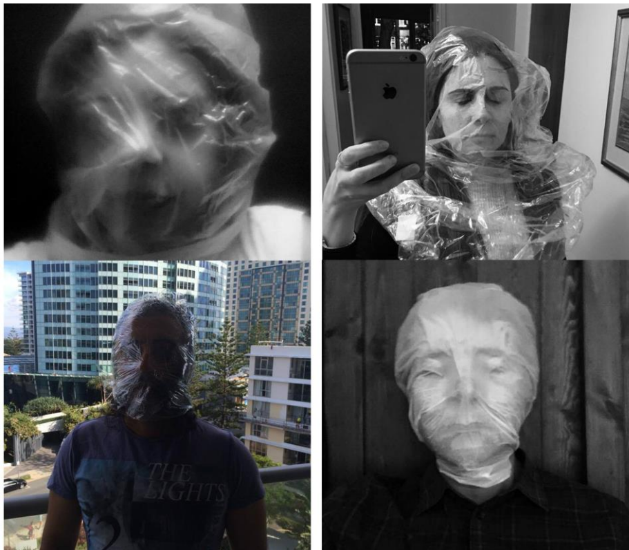
Abb. 3: Selfie-Protest #IWantToBreathe, 2016

Manchmal kommen neben den Schrifftafeln emotional aufgeladene Symbole ins Spiel, die protestbezogen sind, aber zugleich transregional funktionieren, wie etwa der zugeklebte Mund in der Kampagne #FreeAJStaff , der die Beschneidung der Rede- und Pressefreiheit veranschaulichte. (Abb. 1) Das Protestsymbol kann die Schrifftafel sogar ersetzen und die entsprechenden Hashtags werden nur noch in den Kommentaren zu den Bildern gepostet, wie ein Selfie-Protest, der unter den Hashtags #Iwanttobreathe und #SuffocatingPrisoners lief, verdeutlicht. (Abb. 3) Eine über den Kopf gezogene Plastiktüte wurde hier während einer Hitzewelle in Ägypten Mitte Mai 2016 zum Sinnbild für die menschenunwürdigen Bedingungen in den Gefängnissen des Landes. Diese Inszenierung knüpft an eine Ikonografie der Folter an, die durch die berühmten Bilder des Folterskandals in Abu Ghuraib global verstanden wird. Zugleich sind diese körperbezogenen Protestsymbole wie der Klebestreifen auf dem Mund oder die über den Kopf gestülpte Tüte Mittel zur stärkeren Affizierung der Betrachtenden, denn sie stimulieren ein Unbehagen, das sich beim Betrachten körperlich zu übertragen scheint.