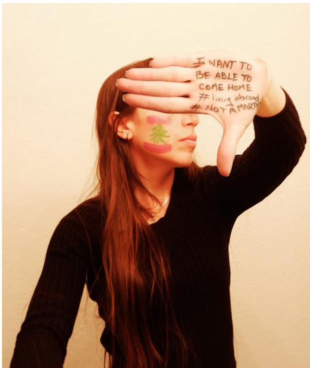
Abb. 6: #NotAMartyr, Protest-Selfie mit direkt auf die Haut geschriebenem Slogan

Mir scheint hier eine weitere Form von Zeugeschaft relevant zu sein, die in der Idee des „Citizen Camera-Witnessing“ bereits angelegt, aber nicht ausbuchstabiert oder theoretisiert ist. Diese geht mit den Konzepten der Augenzeugeschaft und der Blutzugehörigkeit eine enge Verbindung ein, ist aber doch eine eigenständige Form. Ich nenne sie Affektzeugerschaft .