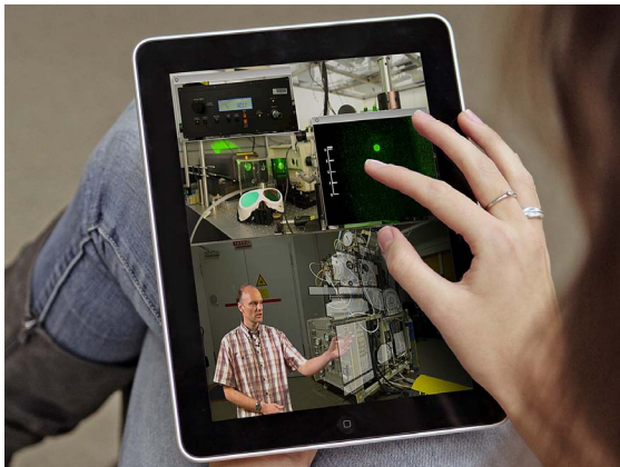
Abb. 2: Technology Enhanced Textbook (TET)

Monitor – wie im klassischen E-Learning verbreitet – wird damit überwunden.