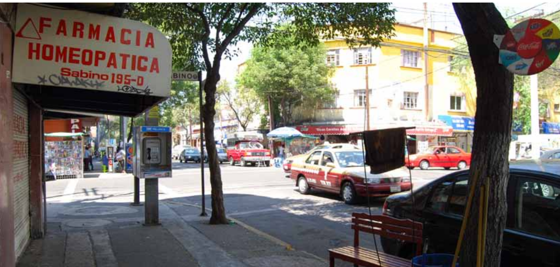
Das Barrio Santa Maria la Ribera