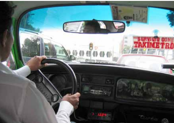
Käfer-Taxi von innen

de Miravalle bekam den Preis dafür, eine stillgelegte Müllkippe wieder zu städtischem Leben erweckt zu haben. Ihr gelang es, die Brache in einen öffentlichen, gemeinschaftlich genutzten und bewirtschafteten Raum zu verwandeln, in einer so einfallsreichen wie zukunftsweisenden Kombination von Arbeitsplatzschaffung, Plastikmüll-Recycling, biologischem Gemüseanbau und kulturellen Angeboten. 50