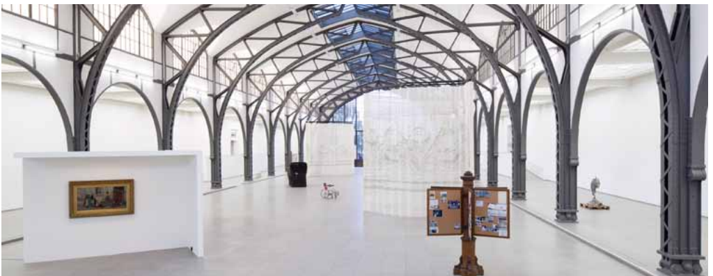
Ausstellungsansicht „ Parergon “ im Hamburger Bahnhof, September 2014

Eine zweite Ausgabe, diesmal in Zeitungsformat und zweisprachig (deutsch/englisch), erschien als Begleitpublikation für eine große Einzelausstellung im Hamburger Bahnhof, die am 19. September 2014 eröffnet wurde und bis zum März 2015 zu sehen sein wird. „ Parergon “, so etwas wie Beiwerk oder Nebenwerk, nähert sich dem „Drama“ (MCD) der Berliner Museumstopografie und Erinnerungslandschaft im 20. Jahrhundert. Thema der Schau aus 22 in der Halle verstreuten Sammlungsobjekten und Exponaten aus verschiedenen Berliner Beständen, Kellern und Archiven sind die verschlungenen