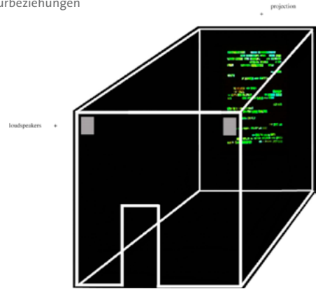
Aspekt der Installation „hidden words“ (Graphik: Erick Meyenberg)

Social Plastics in Mexiko ist die Geschichte eines außergewöhnlich nachhaltigen wie produktiven Kulturaustauschs, dessen Erfahrung es – eben deshalb – festzuhalten gilt: Interessant wäre beispielsweise, die Dynamik dieses Erfolgs zu rekonstruieren, wie also eine Idee und Praxis von einem Ort zum anderen wandert, wie sie übersetzt und adaptiert wird, wie sich globale und lokale Techniken und Ästhetiken dabei verschränken. Denkbar wäre im Rahmen des Deutschland-Jahrs beispielsweise eine Gesamtausstellung von in diesen internationalen Austauschprozessen entstandenen Kunst- und Designgegenständen, möglichst flankiert von einer mehrsprachigen Publikation.