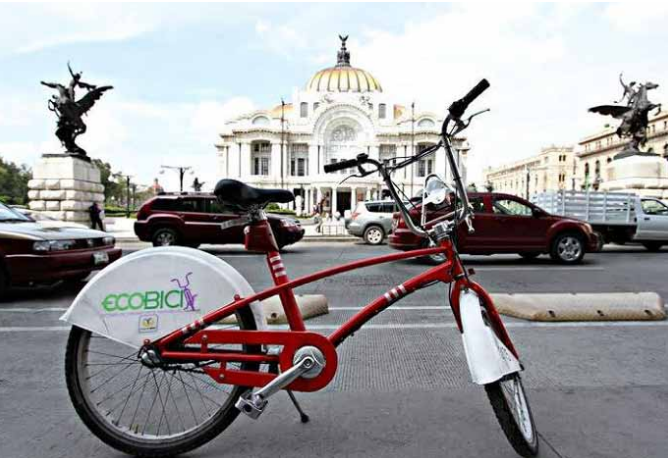
Ecobici in Mexiko-Stadt

Im Folgenden werden Themen und Formate skizziert, die aufgrund der Rekapitulation und der Befragung der Akteure für künftige Kooperationen geeignet erscheinen. Als zentrale thematische Achse, die vielfältige Anschlüsse bietet, wurde die städtische Frage identifiziert, die im Folgenden ausführlicher, auch im Hinblick auf potenzielle Kooperationspartner, skizziert wird. Im Anschluss werden weitere thematische Achsen und zudem eine Reihe möglicher Formate angeführt, die sich als produktiv und zukunftssträftig erwiesen haben. Den Abschluss des Kapitels bildet eine kurze Skizze von Andockstellen für die regionale Diversifizierung in Mexiko, um die etablierte Achse Berlin–Mexiko-Stadt durch markante regionale Satelliten zu ergänzen.