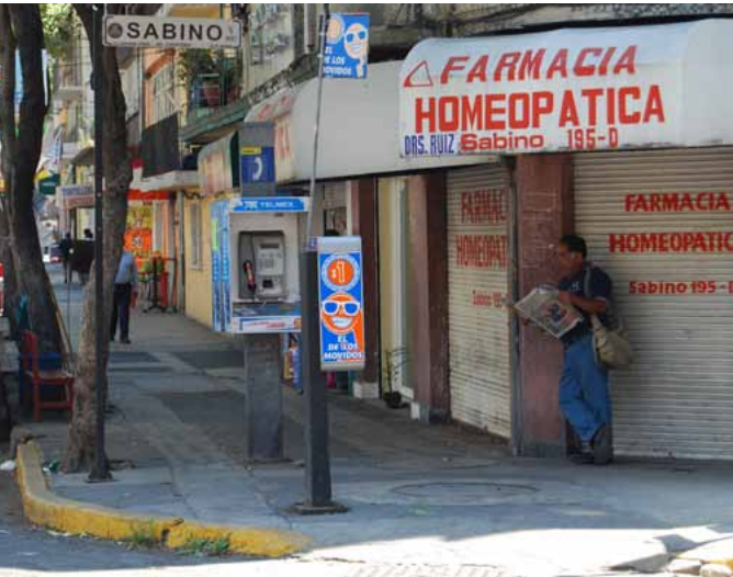
Homöopathie in Santa Maria la Ribera

Eine thematische Drehscheibe für das neue inSITE-im-Barrio-Experiment ist das Thema der urbanen Ernährung. Dabei sollen die Akteure vor Ort, also etwa die Käufer und Verkäufer der lokalen Markthalle – es gibt in Santa Maria la Ribera keine großen Supermarktketten – oder auch das ansässige Kleingewerbe einbezogen werden. Wünschenswert wäre für Sánchez zu diesen Themen ein Austausch mit Kulturschaffenden, Experten und Aktivisten aus Berlin, die sich ausgehend von Fragen der Ernährung und des Essens auch für kommunitäre Prozesse und Bürgerbewusstsein ( conciencia cívica ) interessieren.