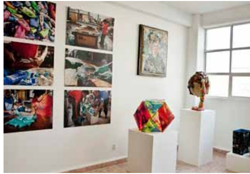
Ausstellung „Re-Mex. El Poder de las Artes“ in der Galerie atea in Mexiko-Stadt