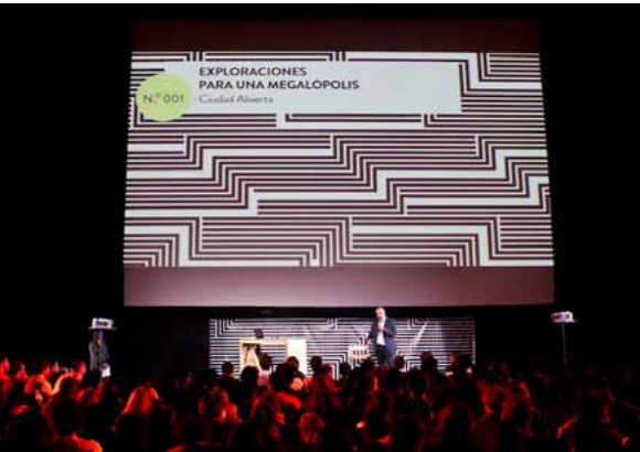
Öffentliche Präsentation des Laboratorio in Mexiko-Stadt

vernetzt erscheinen. Erklärte Ziele des Laboratorio sind die Herstellung einer größeren Bürgernähe und die Einbindung der Stadtbewohner in „kreative Lösungen“ urbaner Probleme, insbesondere im Bereich Mobilität, sowie die Positionierung von Mexiko-Stadt als Emergent City in der Welt („die Städte der Welt ähneln ja immer mehr dieser Stadt und immer weniger Florenz“, LAB). Im ersten Jahr seines Bestehens hat das neuartige Stadtlabor mit verschiedenen Formaten (wie Künstlerresidenzen, Fußgängerforschung, Wahrnehmungswshops) experimentiert, unter anderem das Datenfestival HackDF und das viertägige internationale Stadtfestival „mextopoli“ 72 organisiert und mit internationalen Gästen Themen wie urban food bearbeitet. 73