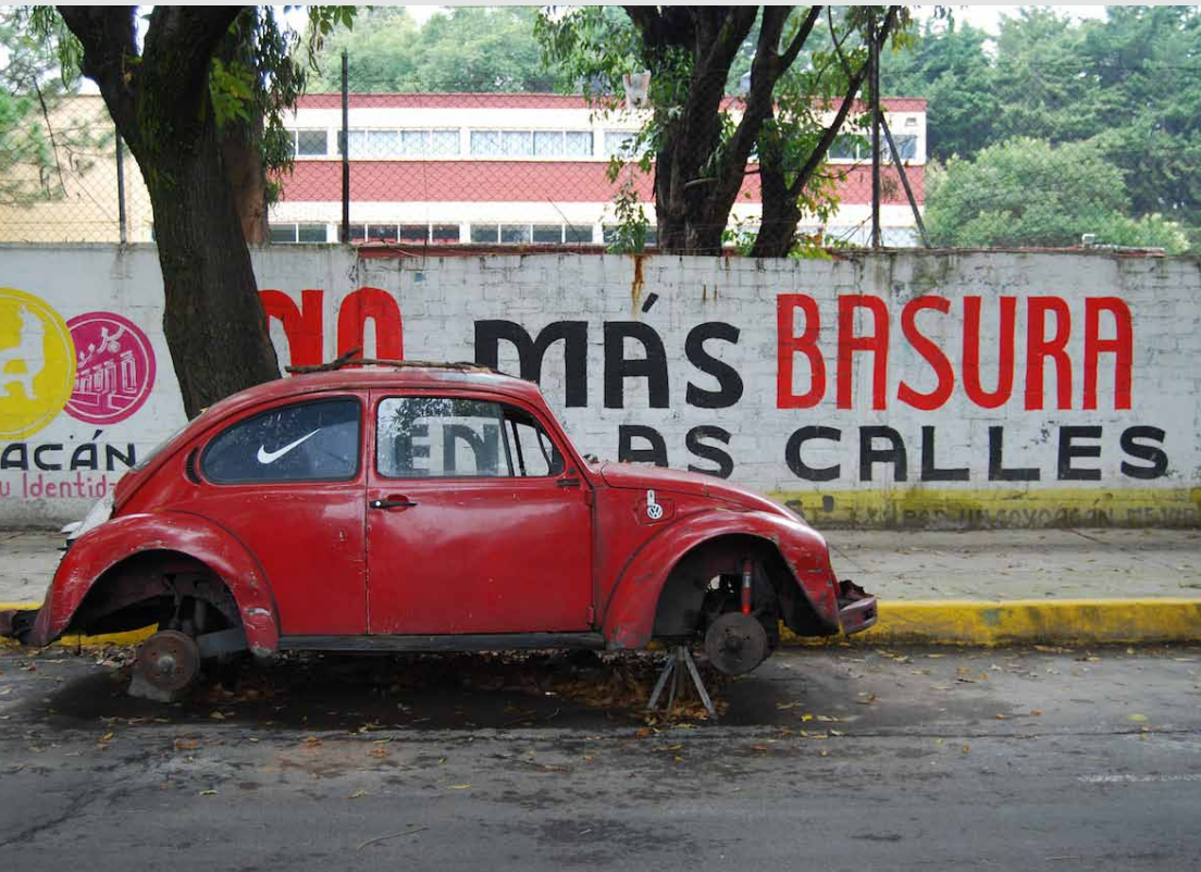
(Nicht) mehr Müll auf der Straße