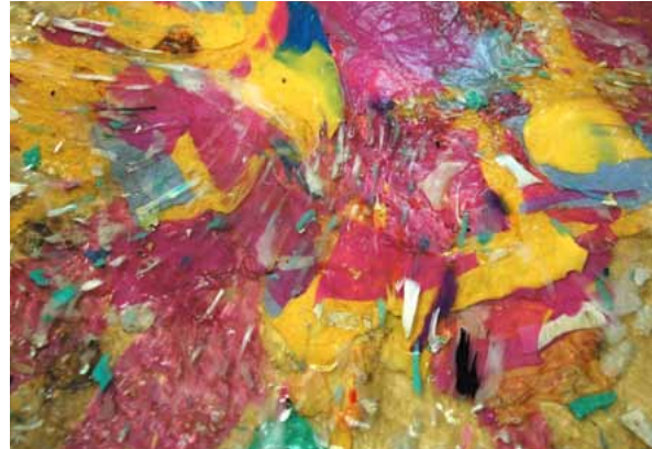
Plastikmüll als Farbmelange

Für eine solche auf wechselseitige Inspirationen setzende Konzeption empfiehlt es sich, das an den Schnittstellen bereits akkumulierte kulturelle Kapital einzubeziehen, also die Erfahrung jener künstlerischen Pendler und Pendlerinnen zwischen Mexiko und Deutschland, die längst nicht mehr das Ei(ge)ne auf das Andere projizieren, sondern sich mit künstlerischen Mitteln die Themen „des Anderen“ oder auch „globale Themen“ zueigen machen und sie in ästhetische Formen und Bildersprachen übersetzen. Drei Beispiele für solche Grenzgänge, die jeweils in unterschiedlichen Themenfeldern situiert sind, seien hier exemplarisch herangezogen: der Berliner Recycling-Künstler Gerhard Bär, der Plastikmüll zu Kunst verarbeitet; der in Mexiko-Stadt lebende Künstler Erick Meyenberg, der seine Faszination für deutsche Geschichte ästhetisch verarbeitet und die in Berlin aktive Künstlerin Mariana Castillo, die sich mit deutscher und globaler Wissensproduktion beschäftigt.