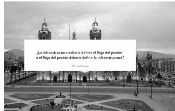
Zócalo de la Ciudad de México in den 1950er Jahren

tekte gearbeitet hat, zuletzt im Juli 2014 bei der Ausstellung „ Building in the Metropolis Mx “. Von besonderem Interesse ist hier die der Galerie angeschlossene Akademie ANCB The Metropolitan Laboratory als Labor transdisziplinärer Forschung und weltweiter Vernetzung zu urbanen Themen wie Informalität und Unsicherheit, Digitalisierung und urbane Kunst, Nachhaltigkeit, Tourismus und Ressourcenknappheit. In Lateinamerika haben die „Architekten, die zuhören“ (Frankfurter Allgemeine Zeitung, 3. Dezember 2013) bereits mit Städten wie Santiago, Bogotá und Medellín, Caracas und eben Mexiko-Stadt kooperiert.