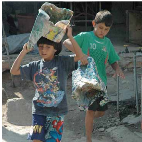
Müllkunst in Mexiko