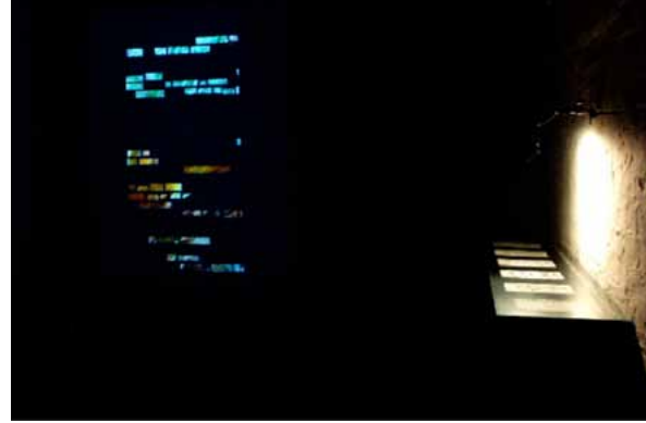
Installation "hidden words"

Im dritten Stück „dusk“ kommt die Protagonistin direkt zu Wort: Ein bestimmtes Textfragment Luxemburgs, das Meyenbergs Aufmerksamkeit erregte, wurde zum Ausgangspunkt für die Schaffung einer „poetischen Zwischensphäre“ zwischen der privaten und der politischen Zeit. „Es ist ein Pingpong zwischen zwei Zeitlinien, ihrer Lebenszeit und der geschichtlichen Zeit, wie zwei parallele Linien“, so Meyenberg (EM). „Sie hat ja Pingpong mit der Geschichte gespielt: Sie hat das Bällchen hingeworfen und die Geschichte hat es ihr mit großer Kraft zurückgeworfen.“ Die Dämmerung, dusk , schien ihm die „ideale poetische Figur“, um von dieser