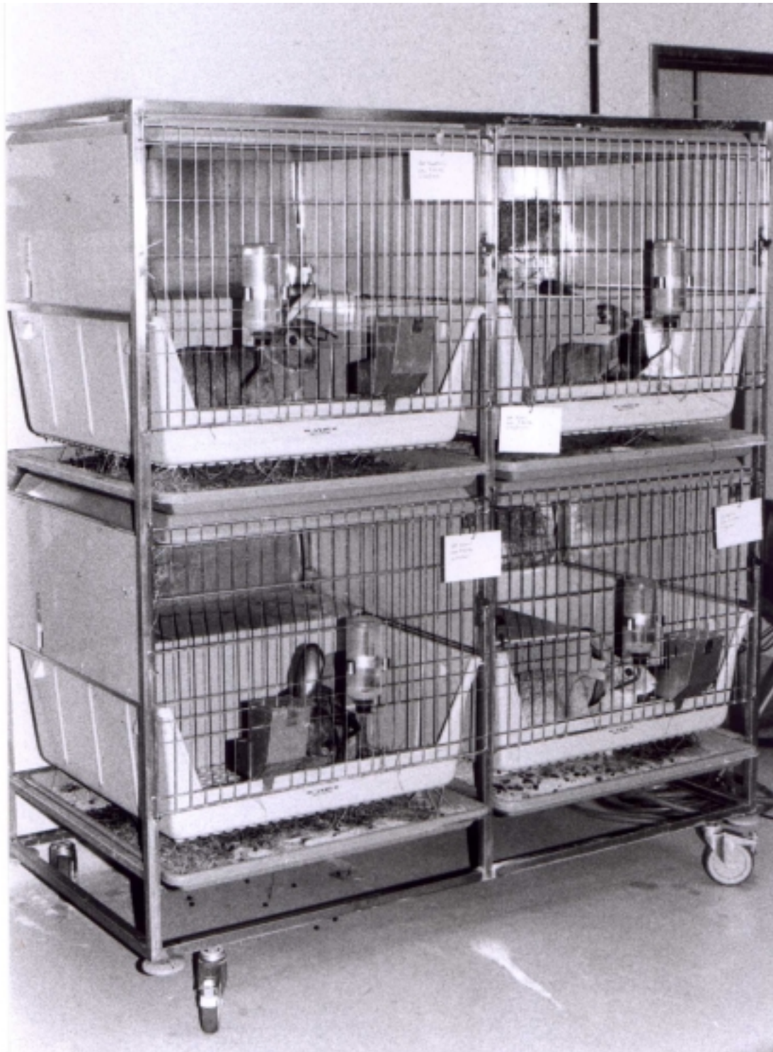
Abb. 2: Fahrgestell des Milieukäfigs mit vier Käfigen für vier einzelne Kaninchen oder für vier Paare. Alle Käfige sind mit einem Liegebrett versehen.