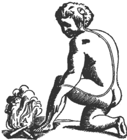
Abb.1: Descartes beschreibt den Weg des Schmerzes: „Gelangt beispielsweise Feuer (A) in die Nähe des Fußes (B), so haben die winzigen Feuerteilchen, die sich bekanntlich mit großer Geschwindigkeit bewegen, die Kraft, diejenige Stelle am Fuß in Bewegung zu setzen, mit der sie in Berührung sind. Auf diese Weise wird an dem zarten Faden (c), der an jener Hautstelle ansetzt, Zug ausgeübt. Im selben Moment öffnet sich die Pore (d, e), die am Ende des Fadens sitzt – so als zöge jemand an einem Seilende, um dadurch eine am anderen Ende hängende Glocke läuten zu lassen.“

René Descartes beschrieb 1644 ein einfaches Schmerzmodell, welches in seinen Grundzügen noch bis zur Mitte des 20. Jahrhunderts gültig war (siehe Abb. 1).