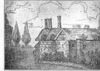
THE OLD MANOR HOUSE OF THE SOMERVILES AT EDSTONE