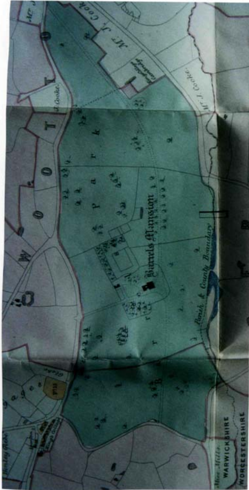
Abb. 125 "Barrels Mansion", 1855