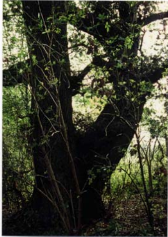
Abb. 131 Die Doppeleiche