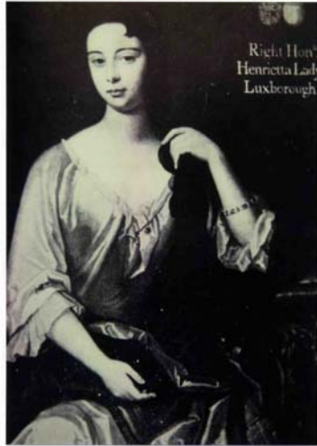
Right Hon. Henrietta Lady Luxborough