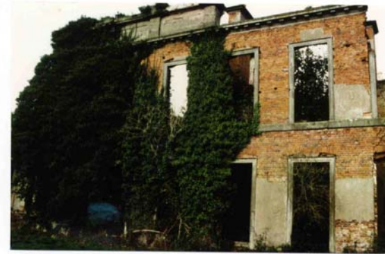
Abb. 129 und 130 Barrels, das Wohnhaus heute