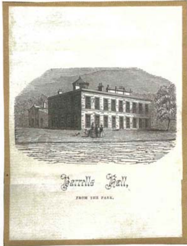
Abb. 127 Barrels Hall Abb. 128 Barrels, das Wohnhaus um 1910