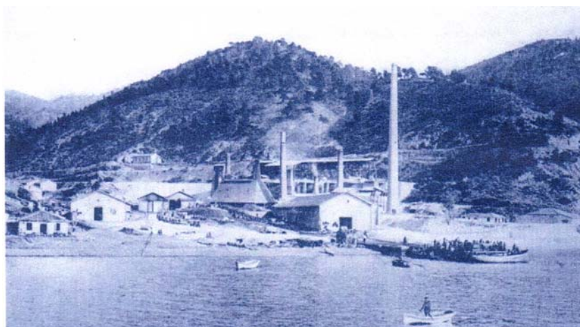
(Foto: Hütte zur Verarbeitung von Magnesit am Ort Katounia Evias, 1910)