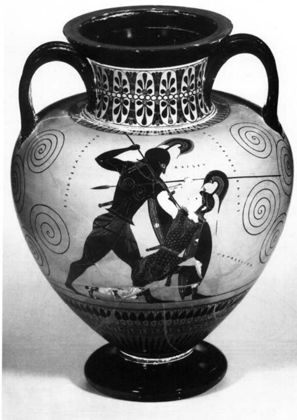
Attic black-figure neck-amphora, by Exekias, ca. 530 BC. Duel of Achilles and Penthesilea. Inscriptions: Achilleu, Penthesilea. On the reverse, Dionysos and Oinopion. Signed by Exekias as potter. (Penthesilea no. 1)

Abbildung 4 in: Blok, a. a. O., Anhang „Plates“, Abb. 3.