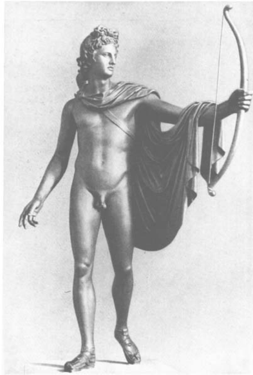
Abbildung 1: Apollon von Belvedere; in: Vogel, a. a. O., S. 394