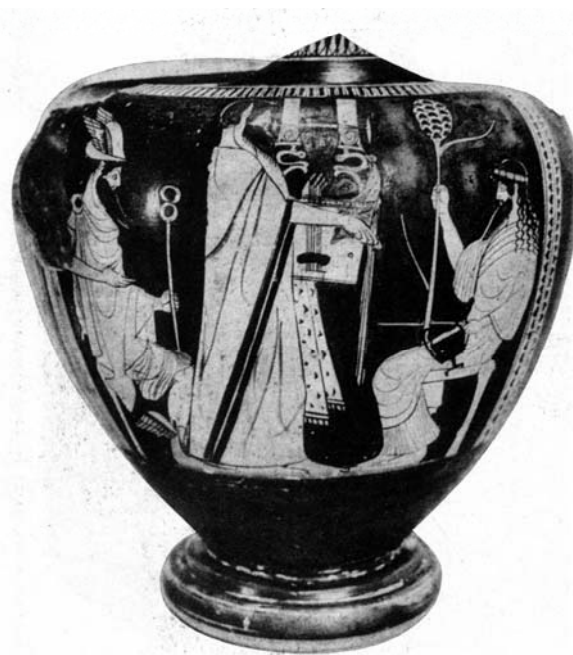
Abbildung 6: Pferdeohriger Apoll zwischen Hermes und Dionysos; in: Vogel, a. a. O., S. 422.