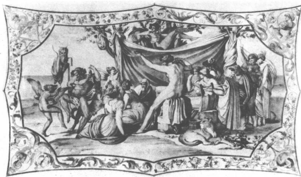
Abbildung 5: Genellis „Bacchus unter den Musen“; in: Vogel, a. a. O., S. 433.

Abbildung 4 in: Blok, a. a. O., Anhang „Plates“, Abb. 3.