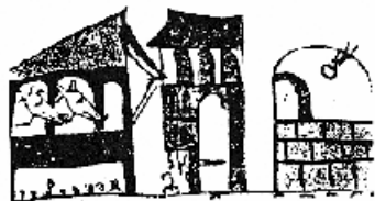
Abb. 10: Illustration sanitärer Regeln aus dem Sachsenspiegel des 13. Jh., Heidelberger Handschrift.

Im 13. Jh. wird im Sachsenspiegel gefordert, dass Viehstall, Backofen und Abort drei Fuß vom Zaun des Nachbarn entfernt sein sollen. Lyons und Petrucelli (1980) werteten dies als Beweis dafür, dass sich die Menschen im Mittelalter der Ansteckungsgefahr, die von Tieren ausging, bewusst waren.