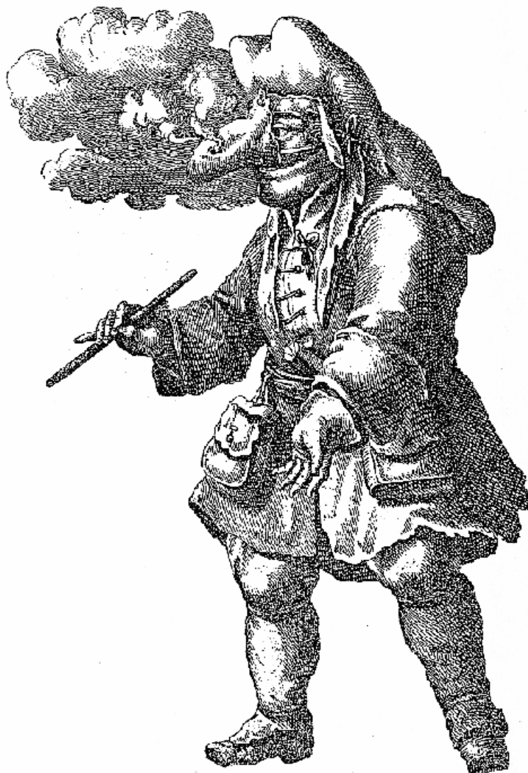
Abb. 9: Pestarzt in Schutzkleidung - Kupferstich um 1720.

Das „unterschwellige“ Wissen, dass die Krankheit durch Kontakt verbreitet wird, führte zu verschiedenen Vorbeugemaßnahmen.