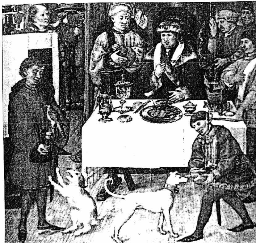
Abb.8: Hunde vor der Fürstentafel werden mit Brot gefüttert (Ausschnitt Kalenderbild Januar, Breviarium Grimani, 15. Jahrhundert).

Möglicherweise ist das von Meyer und Pakur (2002) angeführte Zitat zur Brotfütterung (Evangeliem, wo Markus berichtet (7, 27): "...es ist nicht fein, dass man der Kinder Brot nehme und es werfe vor die Hunde") nicht ausschließlich Ausdruck der Verachtung des Hundes sondern auch die Wiedergabe einer gängigen Fütterungspraxis der Antike.