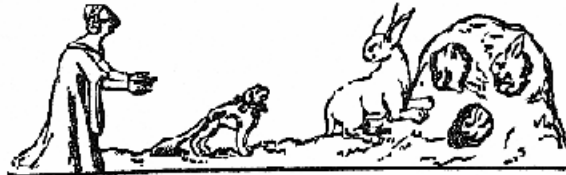
Abb. 6: Hofdame und Schoßhund bei der Kaninchenjagd.

Durch die Jahrhunderte des Mittelalters hielten sich Könige und Fürsten Jagd-, Leib- und Kammerhunde. Der Hund war edler Jagdgefährte, verhätschelter Schoßhund, Statussymbol und fand sogar Eingang in die Familienwappen des Adels.