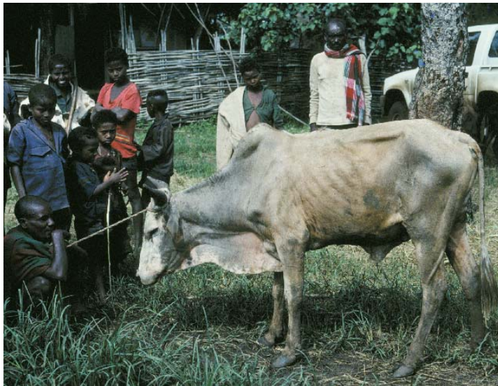
Abbildung 2. Ein an Nagana akut erkranktes Zebu-Rind in Äthiopien

Die Erreger der Schlafkrankheit können auch Haus- und Wildtiere infizieren, ohne dass es bei diesen zu deutlichen Krankheitssymptomen kommt. Tiere stellen somit ein mögliches Reservoir für die Erreger der Trypanosomen des Menschen dar. Aufgrund dieser Tatsache sollten neben Maßnahmen zur Bekämpfung der Schlafkrankheit auch die epidemiologische Bedeutung des domestizierten Tierreservoirs erfasst werden (Mehlitz, 1985).