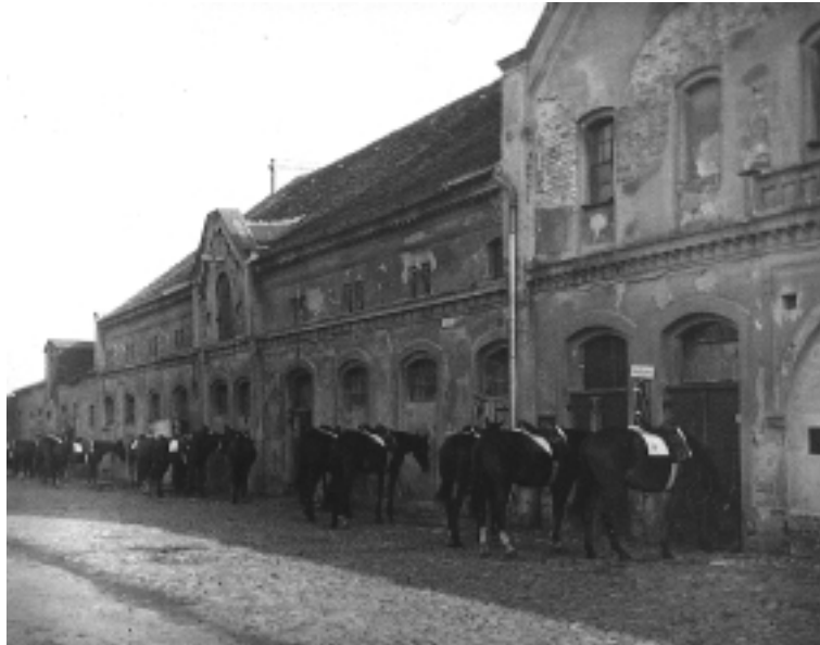
Abb. 2 Alter Gestütsstall mit Reitpferden

1933 hält der Reitersturm der SS in Düppel Einzug und es kommt zu einer ständig währenden Fehde zwischen den beiden „Bewohnern“ Düppels . Dann, in der Nacht vom 8. zum 9. Dezember 1933, brennt aufgrund eines Kurzschlusses in der elektrischen Anlage der Reitbahn die hölzerne Reithalle ab. Dies gibt den Anlaß für die Planung und den Bau Europas erster Reithalle mit freitragendem Holzdach, das eine Fläche von 25 mal 70 Meter überspannt. 42 Die Zeichnungen werden vom Zehlendorfer Baurat Kemper angefertigt. 43 Zwei verglaste und beheizbare Tribünen werden später als „Hauptner-Saal“ genutzt. Diese hölzerne Reitbahn brennt im November 1982, nach Reparaturarbeiten an der Heizungsanlage, vollständig ab. 44