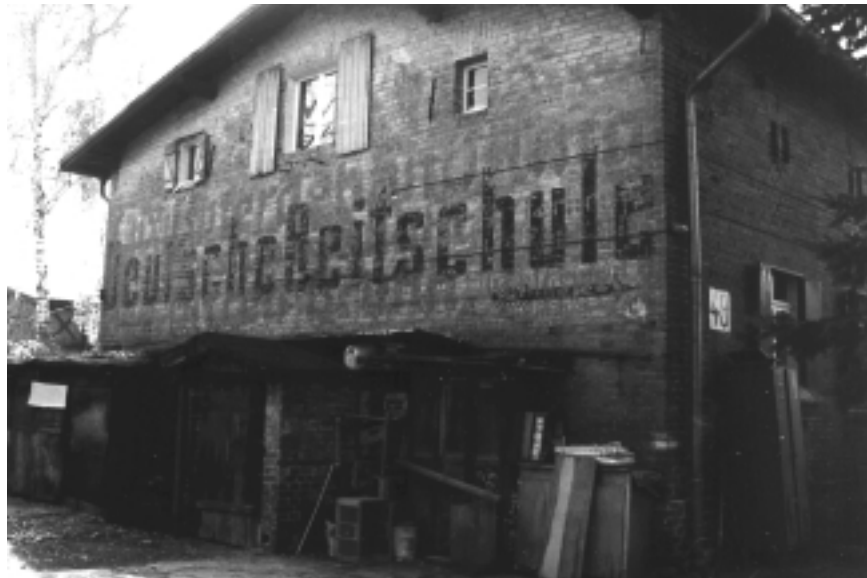
Abb.1 Insthaus, noch heute mit der Aufschrift „Deutsche Reitschule“ auf der Ostseite

Am 25.10.1930 wird „Die Deutsche Reitschule“ eröffnet.