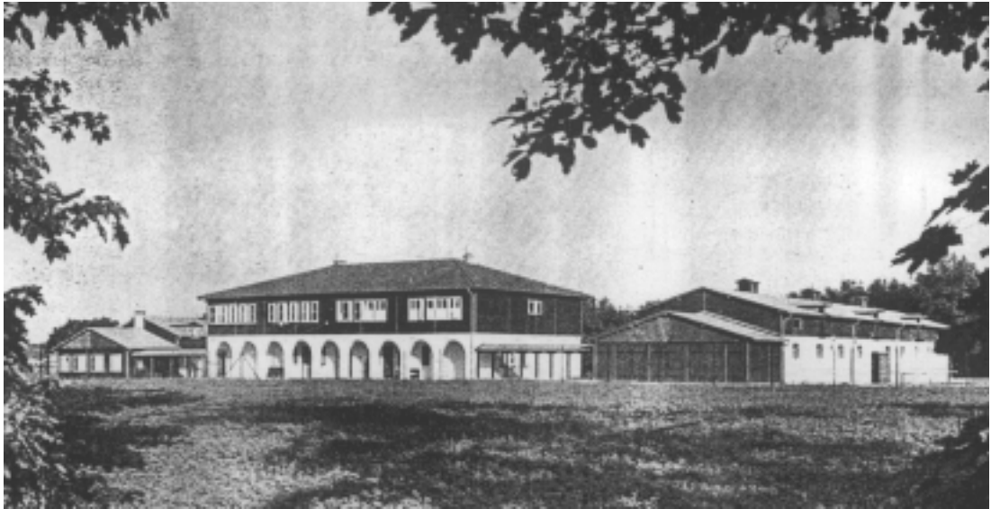
Abb. 3 Reichsreiterführerschule aus nordwestlicher Richtung, um 1940

Am 24. April 1945 wird Düppel von den sowjetischen Truppen eingenommen, im Juli desselben Jahres übergeben sie es den Amerikanern. Der Gebäudekomplex Königsweg 65 wird als Kaserne für die letzte von der US-Army unterhaltene berittene Einheit der Militärpolizei genutzt, dem sogenannten „Horse-Platoon“. In dem ehemaligen SS-Stall sowie in dem reparierten Gestütsstall werden ca. 40 Pferde untergebracht. Die „Deutsche Reitschule“ wird am 22. Januar 1946 endgültig geschlossen. Die Amerikaner gründen weiterhin die ARAB („American Riding Association of Berlin“) 45 . Eine große Anzahl von Leihpferden stehen hier den Angehörigen der Besatzungsmacht zur Verfügung. US-Stadtkommandant ist zu diesem Zeitpunkt Oberst Frank L. Howley, der bis zum Frühjahr 1945 Kommandeur einer US-Einheit bei Salzburg war. Dort kreuzt sich sein Weg mit dem von Oberstabsveterinär Dr. Erwin Becker, der als Chef eines Heimatpferdelazarettes in Salzburg tätig ist.