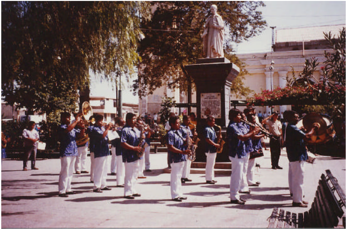
Foto 6. Die "Banda Santa Cecilia" spielt auf der Plaza de Armas . Dahinter sieht man das Denkmal Juan de Moris und die Kathedrale (Catacaos, Karfreitag 1993).

sie nicht gerade beim Spielen sind. Allein die Bekleidung bewirkt beim Publikum einen positiven "offiziellen" Eindruck von der banda , wodurch die Musiker an Respekt gewinnen.