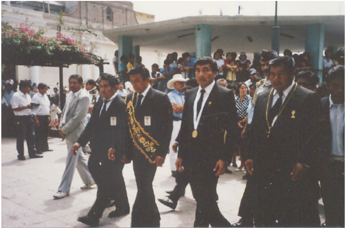
Foto 4. Der Bürgermeister Catacaos (2. rechts), der depositario (1. rechts) oder Wächter des Schlüssels des Sargs Jesu, der doliente (2. links) oder Repräsentant der Volkstrauer für den Tod Jesu und der devoto (1. links), der die Frommen des Volkes verkörpert, marschieren nach dem offiziellen Akt auf der Plaza de Armas gemeinsam in Richtung Rathaus (Catacaos, Karfreitag 1993).

gemeinsamen Zweck schon bei den altamerikanischen Kulturen - vor allem bei den Inkas - üblich. Vor diesem Hintergrund ist der Erfolg der religiösen Organisationen in Bajo Piura verstehen 31 .