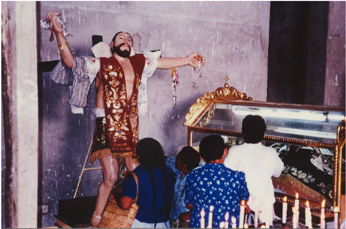
Foto 3. San Dimas , der gute Räuber, der neben Jesus gekreuzigt wurde, wird in Catacaos sehr verehrt. Um seine in der Kathedrale stehende Figur hängen kleine Medaillen ( milagros ), die die Wünsche seiner Gläubigen symbolisieren (Catacaos, April 1993).

einer Zunft sein. So ist die Jungfrau der Gnaden ( Virgen de las Mercedes ) zugleich die Schutzpatronin von Paita, die große Marschallin und Schutzpatronin der Waffen von Peru ( Gran Mariscal y Patrona de las Armas del Perú ) und Schutzpatronin der Fischer. Die religiöse Organisation in Bajo Piura regelt das religiöse Denken und Handeln 30 .