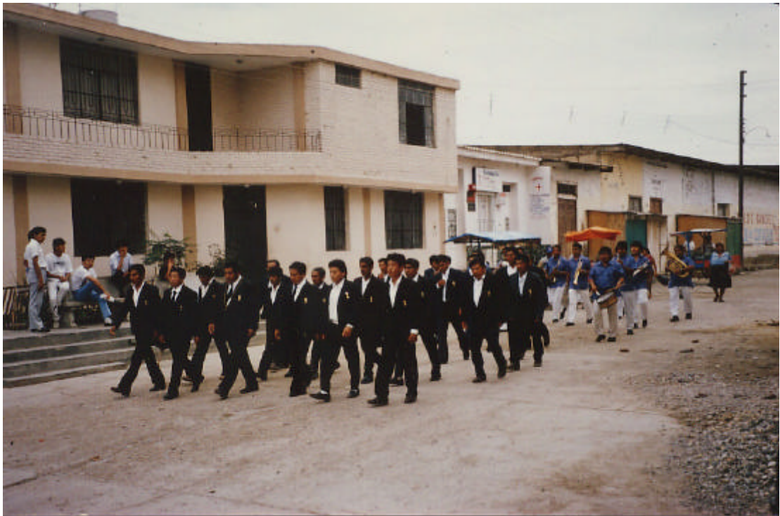
Foto 5. Die Mitglieder der Cofradía del Santo Cristo haben den depositario von zu Hause abgeholt, um mit ihm in die Kathedrale zu gehen. Dabei wurden sie von der banda begleitet, die eine marcha regular spielte (Catacaos, Karfreitag 1993).

Organisation der eingeschworenen Bruderschaften ( cofradías juradas ) heute noch sehr wichtig. Je nachdem zu welcher parcialidad man gehört, besitzt man bei den Versammlungen und öffentlichen Veranstaltungen einen bestimmten Platz in der cofradía . Jede cofradía hatte ursprünglich zwölf bis vierzehn mayordomos (Hofmeister), die jeweils zu einer anderen parcialidad gehörten. So stellt die cofradía noch heute die Einheit des Volkes dar. Heutzutage hat sich jedoch nur noch die erste Cofradía del Santísimo Sacramento diesen Brauch der Alten (" costumbre de los antiguos ") bewahrt. Der Bevollmächtigte oder procurador des Santísimo wird als zweitwichtigster Amtsträger der Kirche nach dem Priester angesehen und bewahrt den Schlüssel der Kathedrale auf. Alle Posten sind auf ein Jahr begrenzt. Nach einem großen Fest müssen die Mitglieder einen Nachfolger suchen, der aus ihrer parcialidad kommen muß 33 .