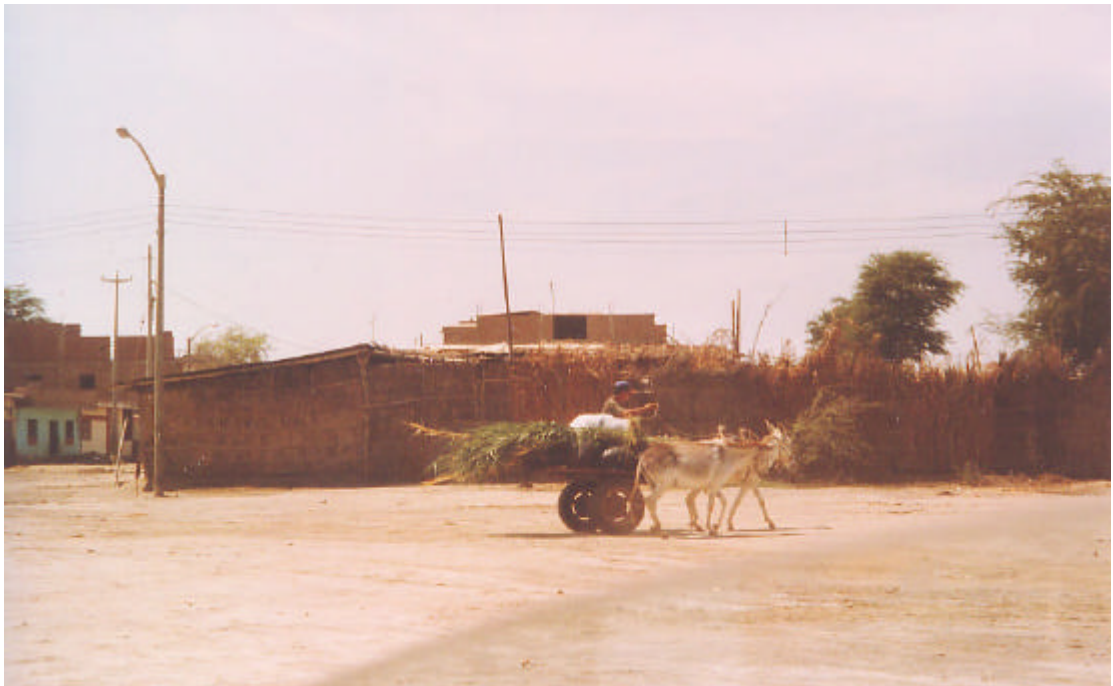
Foto 1. In Nuevo Catacaos - einer barriada von Catacaos - fährt ein Händler einen von zwei Eseln gezogenen Wagen. So werden die Röhren für den Bau von Häusern und Wänden transportiert (Nuevo Catacaos, Januar 1999).

Vielfältige Landschaften sind in Bajo Piura zu sehen: die Städte, das Küstengebiet mit Fischerei und Industrie, die Täler um den Piura-Fluß herum mit Baumwolle, Mais, Reis, Obst und Bohnen, und der despoblado (Unbewohnte) Teil, das große Trockengebiet Piuras mit 6000 km 2 Fläche. In den tiefergelegenen Zonen wachsen hier und dort Johannisbrotbäume ( algarrobos ), von denen sich das Vieh ernährt. (Diez/Aldana 1994: 26, 28). In der ländlichen Zone gibt es Landwirtschaft, es wird Maisbier ( chicha ) zubereitet, Strohütten werden hergestellt und Tiere gezüchtet. In den urbanen Gebieten wird mit Kunstgewerbe, Stroh, Goldschmiedearbeiten, Leder und Heiligenskulpturen gehandelt.