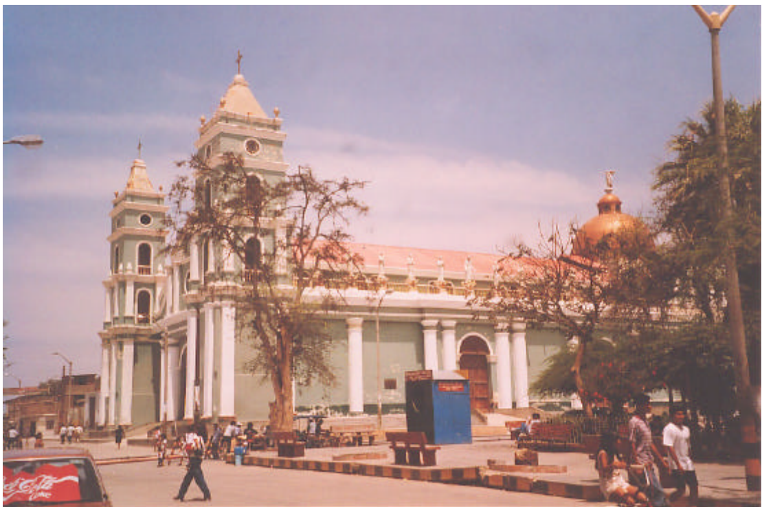
Foto 2. Die Kathedrale San Juan Bautista de Catacaos - Hl. Johannes der Täufer von Catacaos nach der letzten Restaurierung. Davor sieht man eine Ecke der Plaza de Armas (Catacaos, Januar 1999).

Das politische und kulturelle Leben Catacaos spielt sich um den Zentralplatz ( Plaza de Armas ) ab. Dort befinden sich die Kathedrale, das Bezirksamt, die Bank, die Apotheke und das Telefonzentrum (siehe Karte 3, S.3). Die Plaza de Armas ist Treffpunkt und beliebter Ort für die Freizeit - früher gab es dort sogar einen großen öffentlichen Fernseher. Von dort ist es nicht weit zum Markt und zur Calle Comercio (oder Jirón Comercio ), der Hauptstraße Catacaos, wo Kunstgewerbe verkauft wird. Auf der Plaza de Armas spielt die banda bei den offiziellen Veranstaltungen.