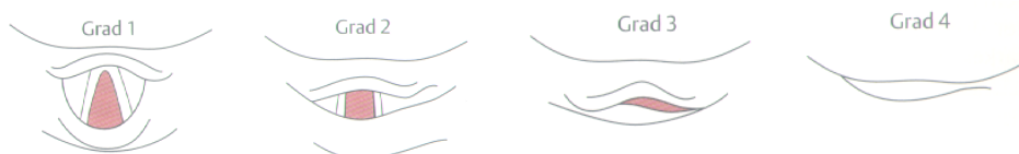
Klassifikation nach Cormack und Lehane