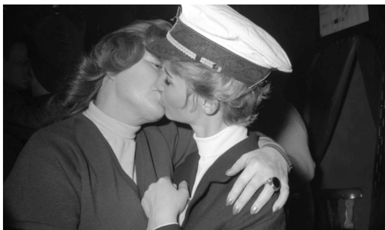
Sozarch_F_5034-1964-16-017