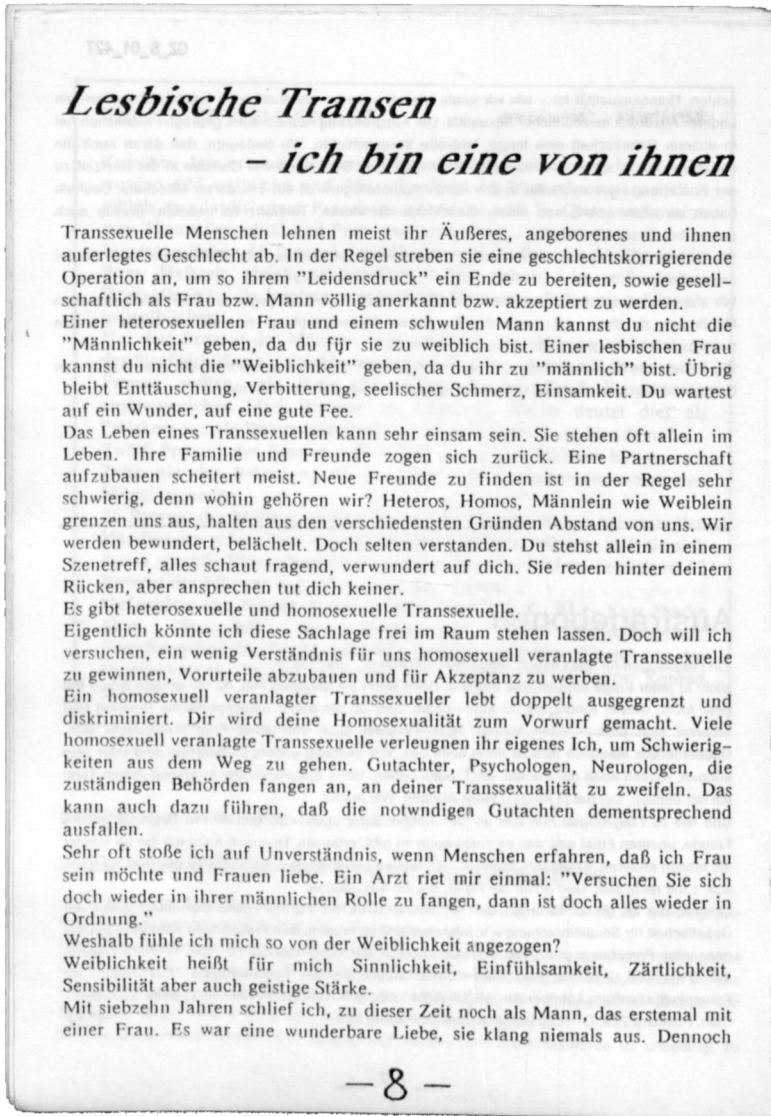
Abb. 1: Robert-Havemann-Gesellschaft/GZ-S 01, Nadja Schallenberg, »Lesbische Transen – ich bin eine von ihnen«, frau anders 5, 1991, 8–10