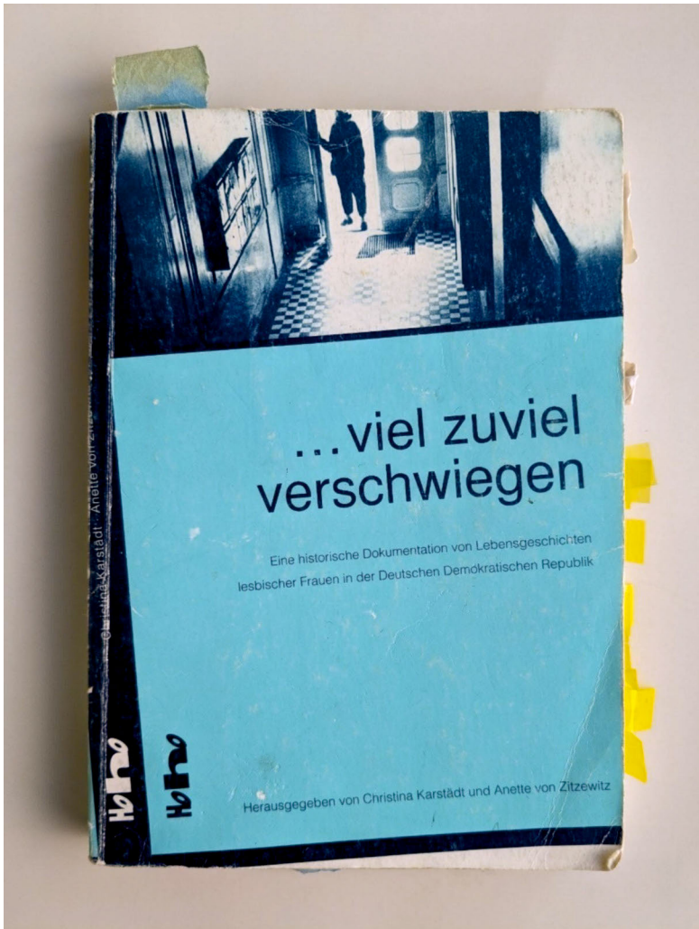
Abb. 1: Cover des Buchs zum Film »... viel zuviel verschwiegen«. Viel gelesenes Exemplar der Autorin