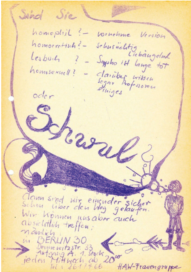
Abb.1: homophil? homoerotisch? lesbisch? homosexuell? schwul? Vermutlich hektografiertes Flugblatt der HAW-Frauengruppe von 1972, Spinnboden: Ak/LAZ/28

Mit den neuen Begriffen gewann auch ein neues Verhältnis zum Selbst an Bedeutung, die Vorstellung von einer authentischen sexuellen Identität, die man in Selbsterfahrungsgruppen erkunden und der man entsprechen wollte.