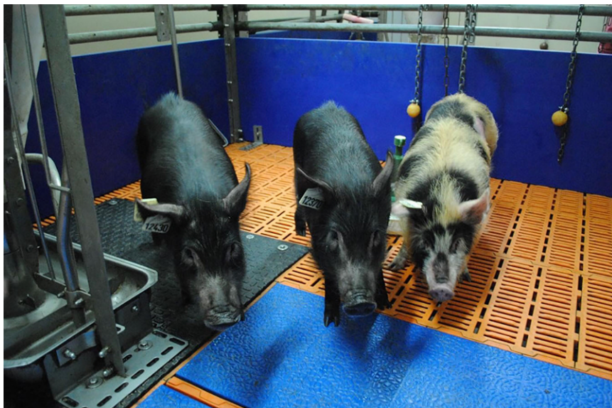
Abb. 1 ▲ Auckland Island-Schweine im Tierversuchsgut der LMU, München-Oberschleißheim.

Nierentransplantation beobachtet [38, 39] und hat ebenso die Langzeitergebnisse limitiert.