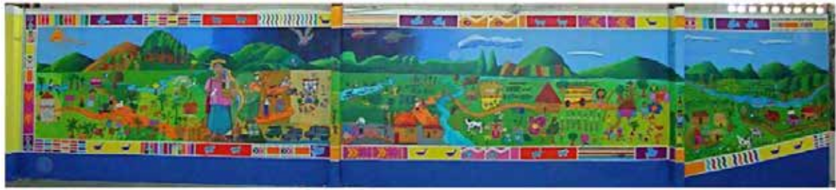
Mural en el Salón Municipal de Panzós. Tomado de EARTAP (2010: en línea)

y malo. Los opuestos que sostienen el universo”, aunque el nombre no lo indique con claridad, este es un trabajo que fue realizado para preservar la memoria de la masacre de 1978 y fue elaborado por iniciativa de un par de integrantes del Equipo de Estudios Comunitarios y Acción Psicosocial (ECAP) bajo la coordinación de tres profesoras provenientes de la Escuela de Arte y Taller Abierto de Perquin (EARTAP) radicada en el departamento de Morazán, en el vecino país de El Salvador.