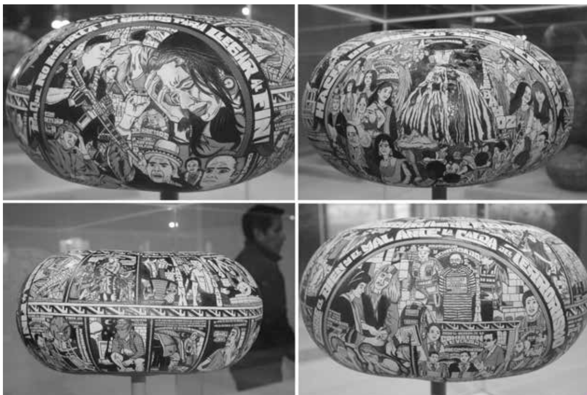
Figura 4. Detalles de mates burilados.

Fotografías tomadas por Maria Eugenia Uffe, Yalpana Wasi, Huancayo, 10 de diciembre de 2014.