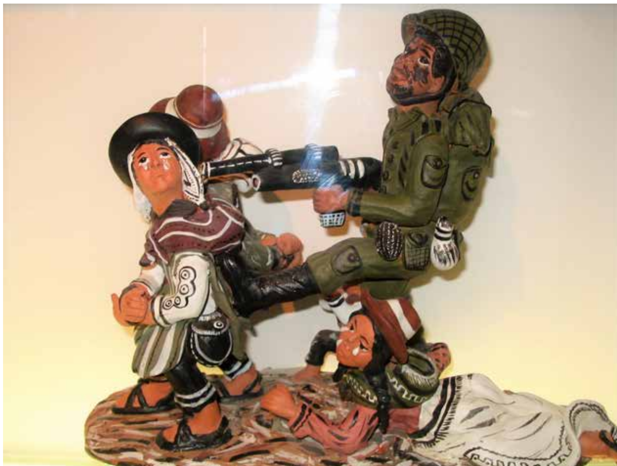
Figura 3. Pieza de cerámica en Museo de la Memoria de ANFASEP. Fotografía tomada por María Eugenia Ulfe, Ayacucho, 2009.

conservan y muestran recuerdos incómodos —aunque en algunos casos hayan tenido que reconstruirlas visualmente, como la celda de tortura— pero que sirven para contar una historia de muchas/os y representar lo que les sucedió.