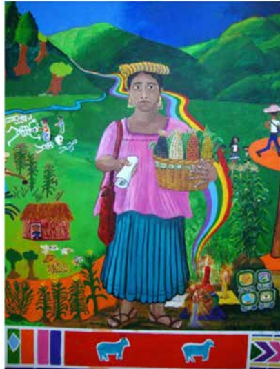
Mamá Maquín al centro del mural. Imagen tomada de EARTAP (2010: en línea).

tanto no es de libre acceso, salvo en eventos públicos. Esta ubicación lo conserva en un terreno ambiguo, pues al mismo tiempo se encuentra oculto y resguardado, lo cual garantiza quizá su permanencia, pero al costo de perder la relación con la comunidad para la que fue realizado. Lo que es seguro es que mientras permanezca su presencia física existe la posibilidad de un reencuentro y con él quizá un “retorno” de fuerzas mnemónicas.