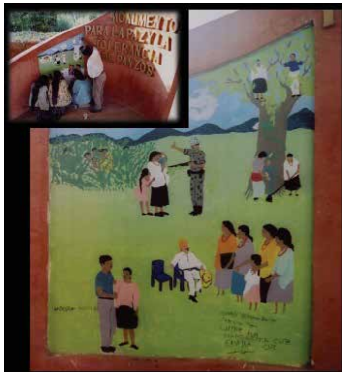
Mural del Monumento para la paz y la tolerancia.

cada una placa de metal que busca emular un pergamino extendido en la que se hallan inscritas las siguientes palabras: “los familiares de las víctimas y sobrevivientes del genocidio dedican este monumento para la paz y la tolerancia de Panzós. Para la reflexión de las generaciones futuras y la construcción de una cultura de paz. Panzós 29 de mayo de 2004”, además se colocó una techumbre de lámina a dos aguas para proteger el monumento.