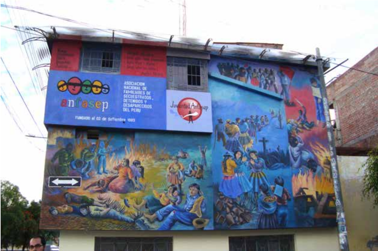
Figuras 1 y 2. Frontis del Museo de la Memoria de ANFASEP. Ayacucho, 2012.