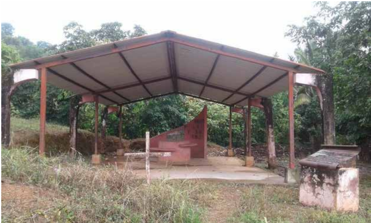
Imagen del Monumento.