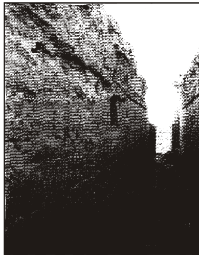
Taf. 124 Varachsha: Kaserne an der Zitadelle (a) Ansicht der Zitadelle. Fotoaufnahme von V. TEREENIN. Nach Marshak, Negmatov 1996: 241. (b) Langraum der Kaserne. Fotoaufnahme von V. TEREENIN. Nach Marshak, Negmatov 1996: 241.