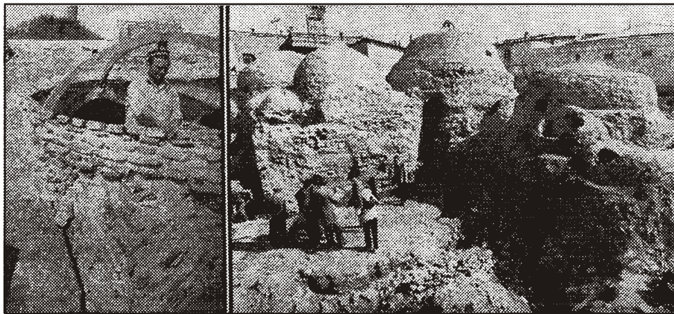
Abb. 17 Bruchverformung in Tonnen und Kuppeln: