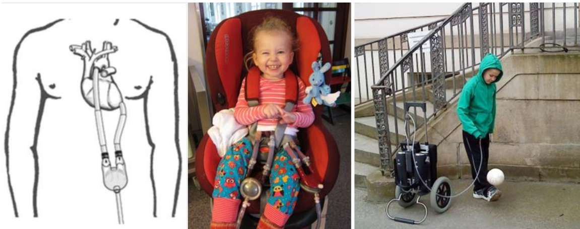
Abbildung 1: Implantation des pulsatilen, parakorporalen Berlin Heart EXCOR Herzunterstützungssystems. Im Schema links ist die linksventrikuläre Unterstützung mit Kanülierung des linksventrikulären Apex und der Aorta dargestellt. Die Pumpkammer liegt parakorporal und wird pneumatisch angetrieben. Foto (Mitte): Kind an der biventrikulären Unterstützung während der Wartezeit auf ein Spenderorgan. Foto (rechts): Schulkind mit linksventrikulärem VAD und der mobilen Antriebseinheit EXCOR mobil. Die mobile Antriebseinheit ermöglicht eine ambulante Behandlung. (Schema entnommen aus 34 mit Genehmigung von Elsevier, Mosby Inc.. Fotos: Mit freundlicher Genehmigung der Sorgeberechtigten.)

1990 wurden die ersten Berlin Heart Excor VAD für Erwachsene bei Jugendlichen und Kindern 32 und 1992 weltweit das erste speziell für Kinder entwickelte Excor Pediatric am Deutschen Herzzentrum Berlin bei einem Neugeborenen implantiert. Technische und prozedurale Weiterentwicklungen, wie Heparinbeschichtung der inneren Oberfläche des VAD, Entwicklung von speziellen Kanülen (press button cannula, Apexkanülen), Bevorzugung ventrikulärer statt atrialer Kanülierung, Vermeidung biventrikulärer Unterstützung sowie die Fortentwicklung des Anti-koagulationsprotokolls, wurden bis 2000 implementiert und sind mit der signifikanten Senkung der Letalität von 50% auf 32% in Verbindung gebracht worden. 33