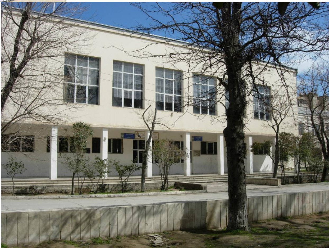
Школа № 49.