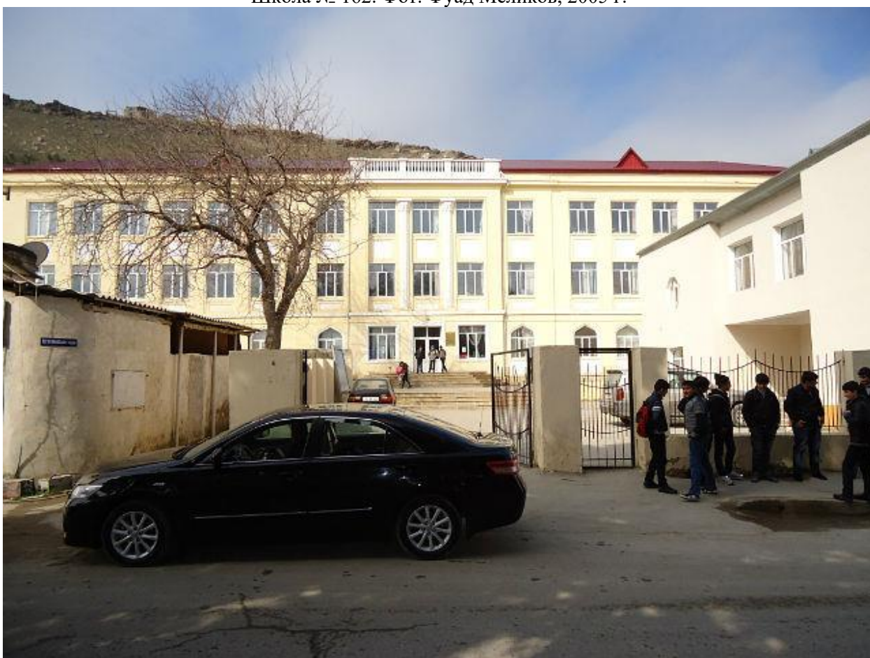
Школа № 162. 2012 г.