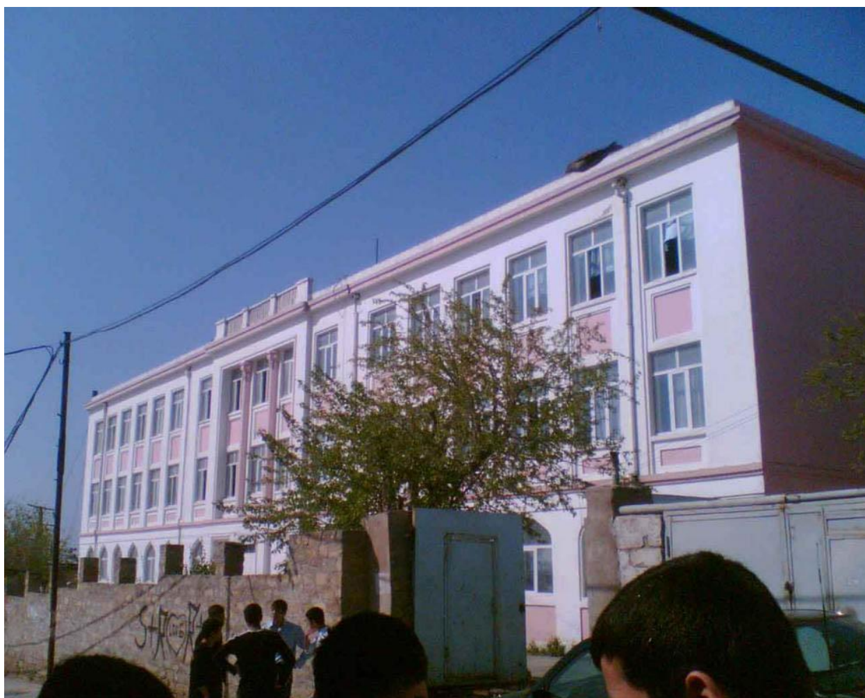
Школа № 163. 2006 г.