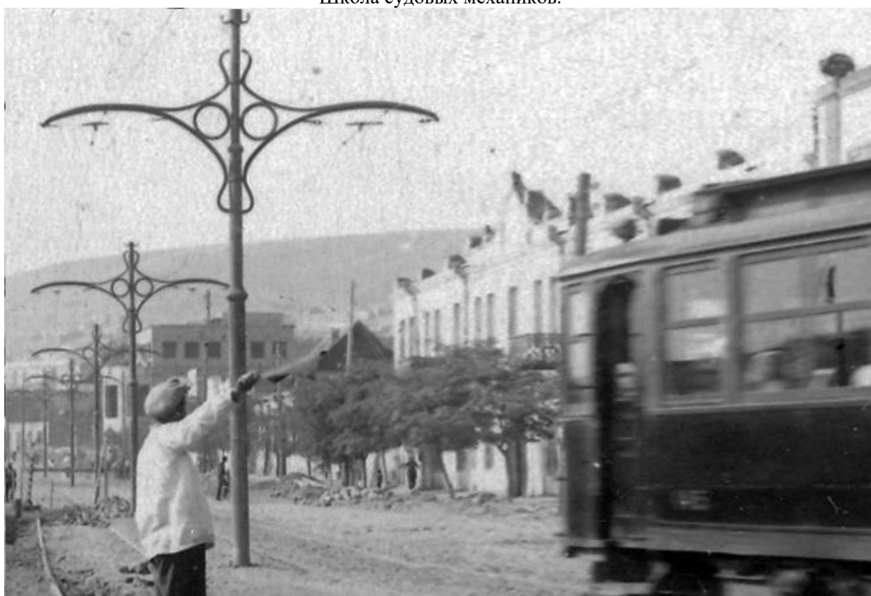
Учебный комбинат Каспара. Вдали видно строящееся здание ремесленного училища. Конец 1930-х гг.

1925 г. – Школа Каспара № 2 – I ступени, набережная Губанова, 21.