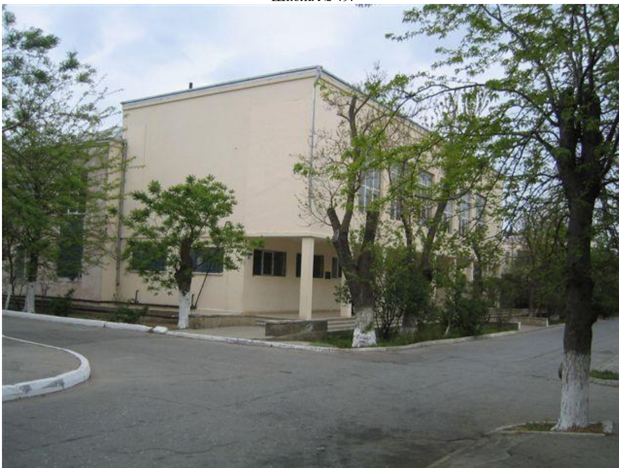
Школа № 50.