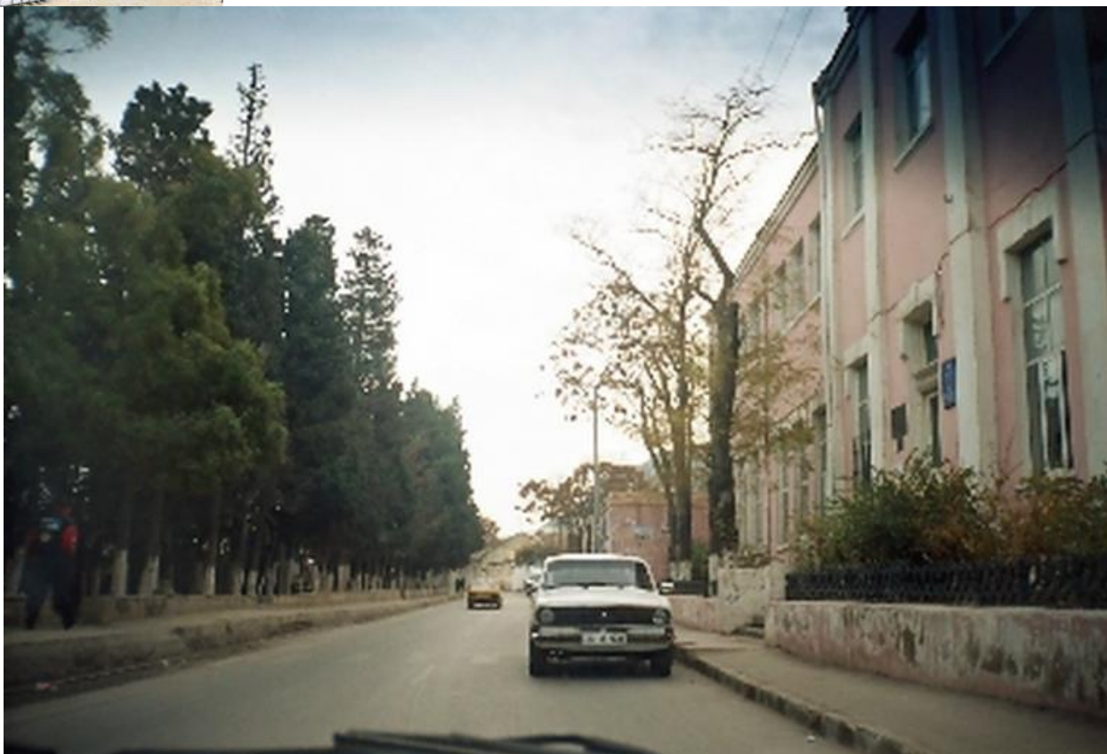
Школа № 51, бывшая школа Съезда нефтепромышленников. Вид с улицы. 2005 г.

Съезд бакинских нефтепромышленников 2 , созываемый с разрешения и по решению правительства Российской империи, являлся представительной организацией владельцев бакинских нефтяных промыслов, нефтеперерабатывающих заводов и других нефтепромышленных предприятий. Главной задачей этой организации бакинских нефтепромышленников была защита общих интересов нефтяной промышленности и выполнение некоторых общественных функций, которые нефтепромышленники должны были нести по «Положению о съездах нефтепромышленников»: медицинская помощь, постройка и содержание промысловых дорог и др. Для создания фонда на решение этих задач на одном из очередных съездов в 1892 г. было принято постановление об обложении нефтепромышленников попудным сбором, устанавливающее таким образом постоянный источник дохода на общие нужды, в том числе и на образование – с каждого добытого, переработанного или перекачанного по нефтепроводу пуда нефти владельцы промыслов, заводов и нефтепроводов платили в общий фонд особый налог 3 . Исполнительным органом, выполнявшим поручения Съезда, решавшим различные административно-хозяйственные вопросы и отчитывавшемся за их исполнение перед съездом, являлся Совет Съезда нефтепромышленников.