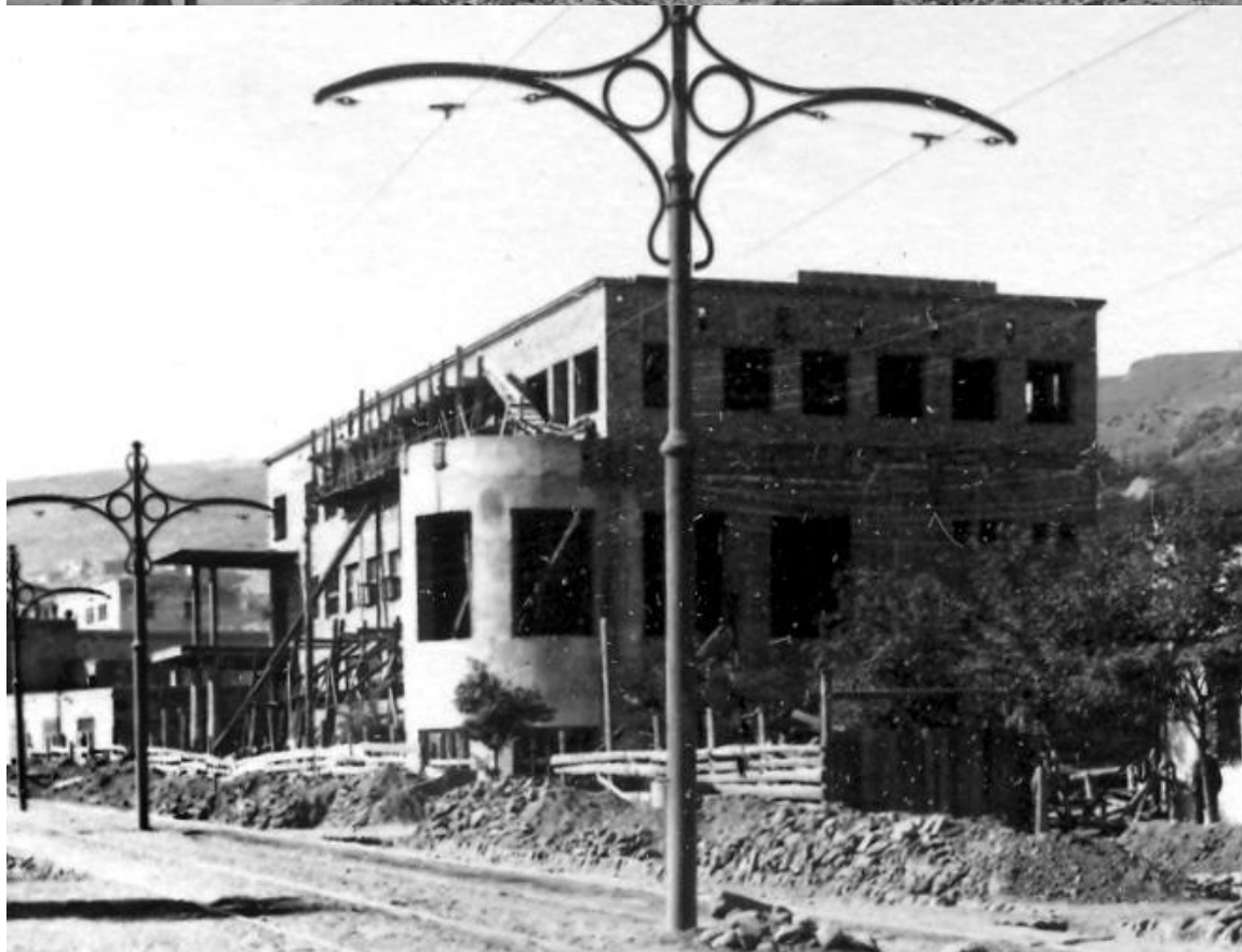
Строительство ремесленного училища, наб. Губанова (с 1940 г. пр. Сталина). Конец 1930-х