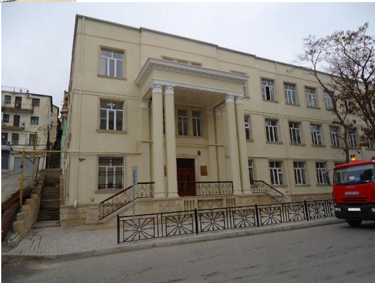
Школа № 91. Фот. И. Куцулап, 2012 г.

Школа была построена в конце 1930-х – 1940 году 20 . Поначалу в этом здании по адресу ул. Ханлара, 32 размещались школы № 52 и № 203 21 . Во время Великой Отечественной войны, в 1943 году в школе был устроен эвакуационный госпиталь, и ученики были переведены в здание школы № 91, на ул. Ханлара, 5. Также туда была переведена школа № 55, находившаяся до этого в соседнем со школой № 203 здании, по адресу ул. Ханлара, 30 – а в нем разместили круглосуточный детсад. После окончания Великой Отечественной войны школа № 55 будет открыта на 2-м промысле, школа № 203 осталась на ул. Ханлара, 5. Школа № 91 была переведена в это здание после войны, по-видимому, уже объединенной со школой № 52. После войны изменилась и адресация домов по ул. Ханлара.