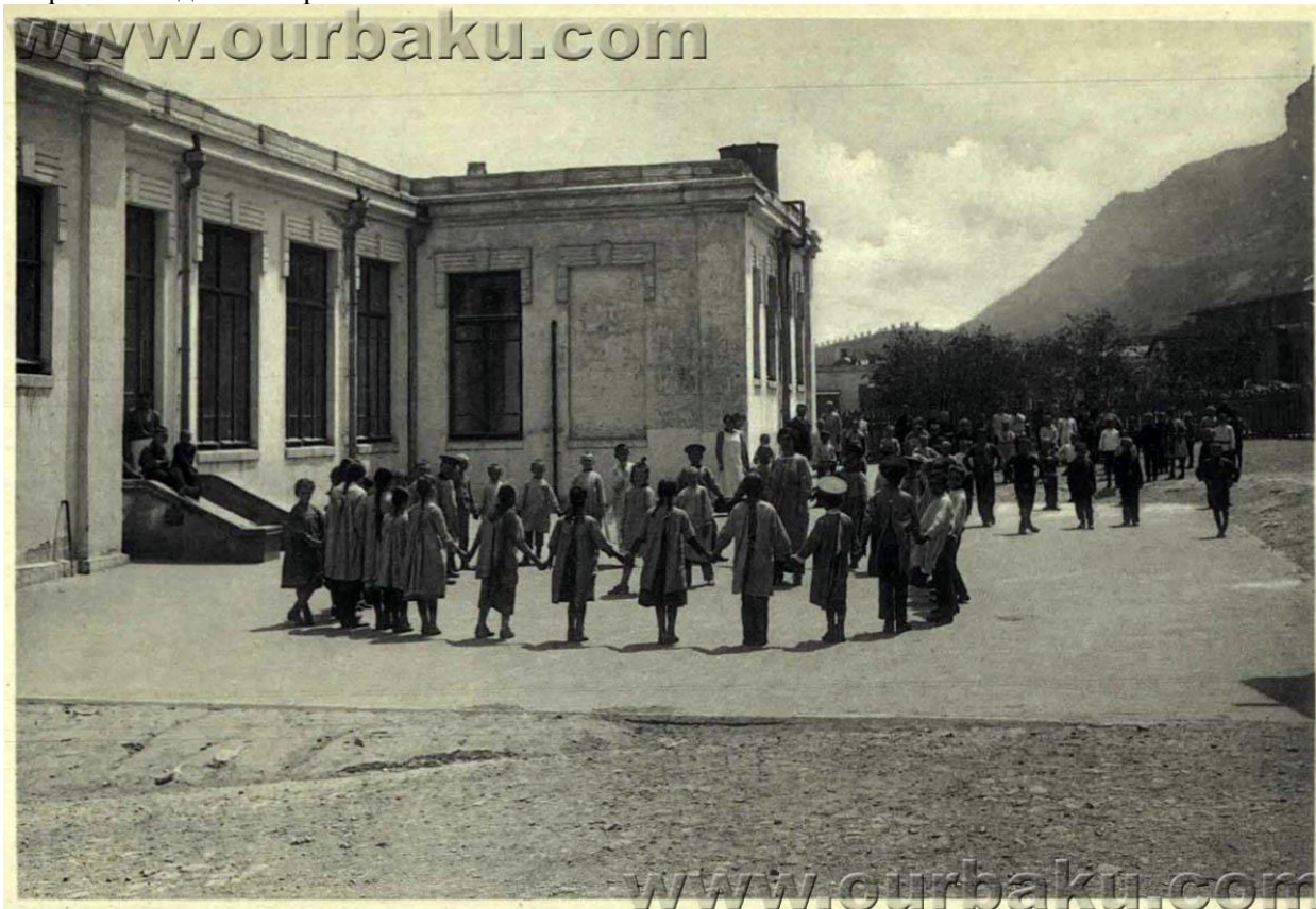
Биби-Эйбатская школа Съезда нефтепромышленников. Вид со двора. 1912 г.

Сейчас это школа № 51. Старое здание школы, надстроенное и увеличенное пристройками, сохранилось до сих пор.