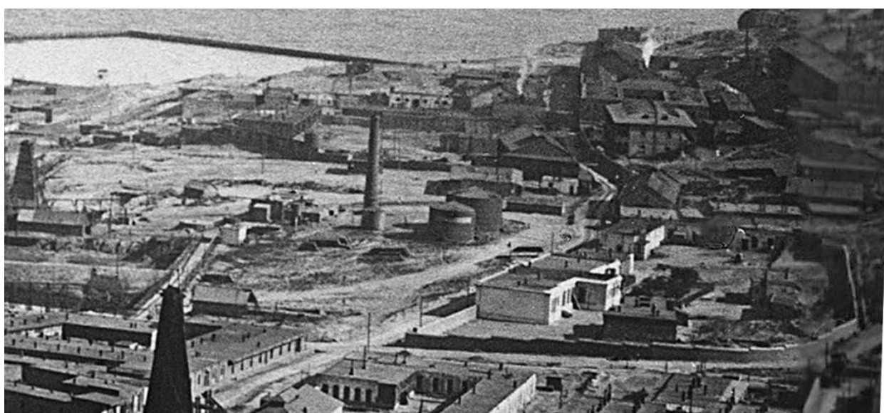
Биби-Эйбат. Общий вид. ~1911 г.