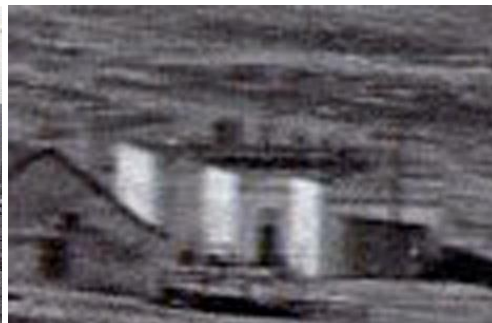
Школа Съезда нефтепромышленников.