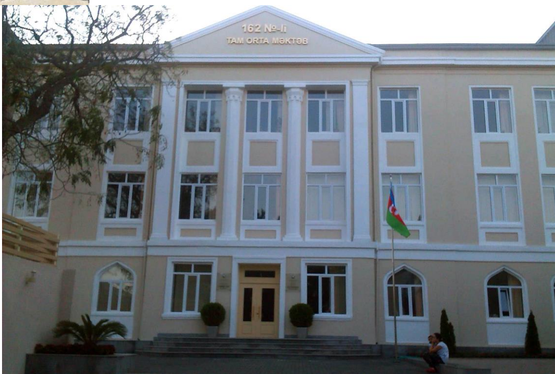
Школа № 162. 2017 г.