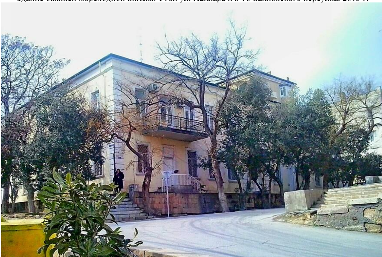
Здание бывшей мореходной школы. Угол ул. Ханлара и 3-го Баиловского переулка. 2015 г.

В этом старом здании царской еще постройки в 1929 году был размещен кооперативный техникум БОНО. Затем техникум был преобразован в школу № 11 Сталинского района, сведения о которой