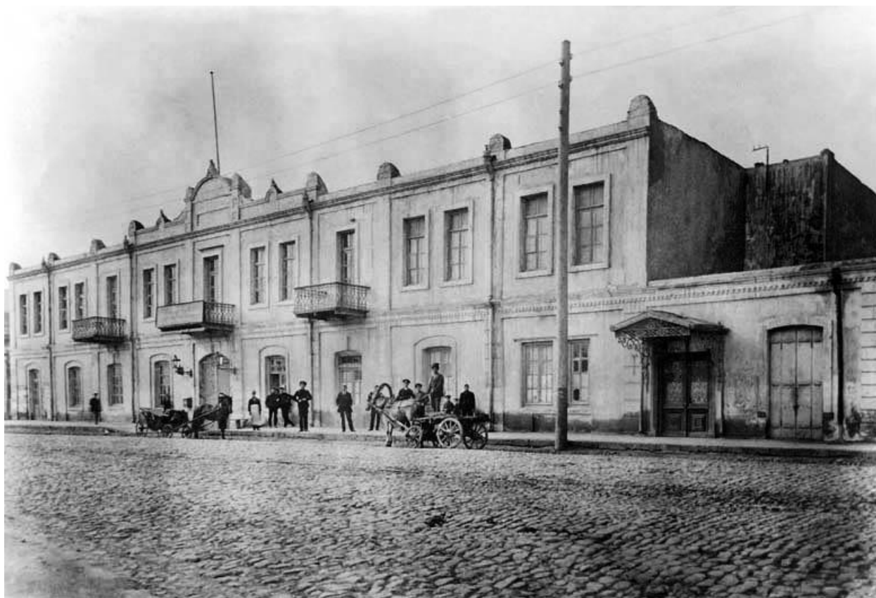
Школа судовых механиков.