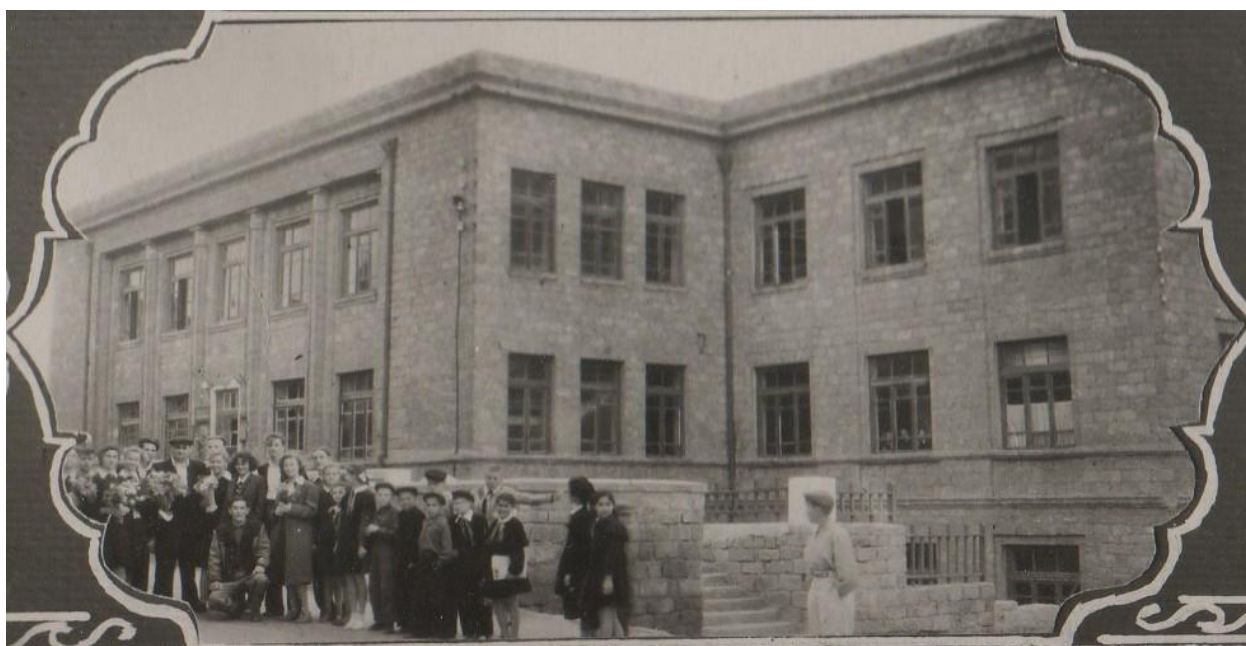
Школа № 203. 1956 г.