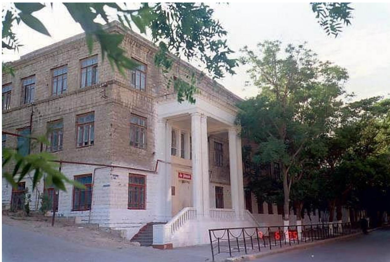
Школа № 91. 2005 г.