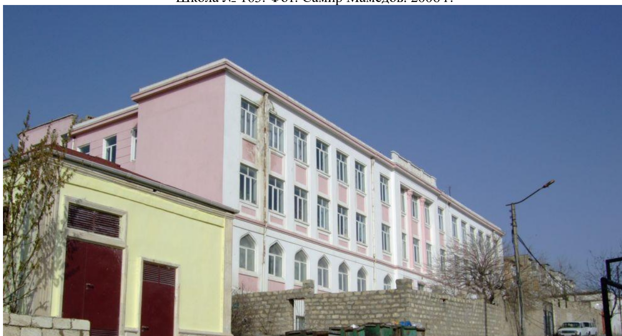
Школа № 163. 2008 г.