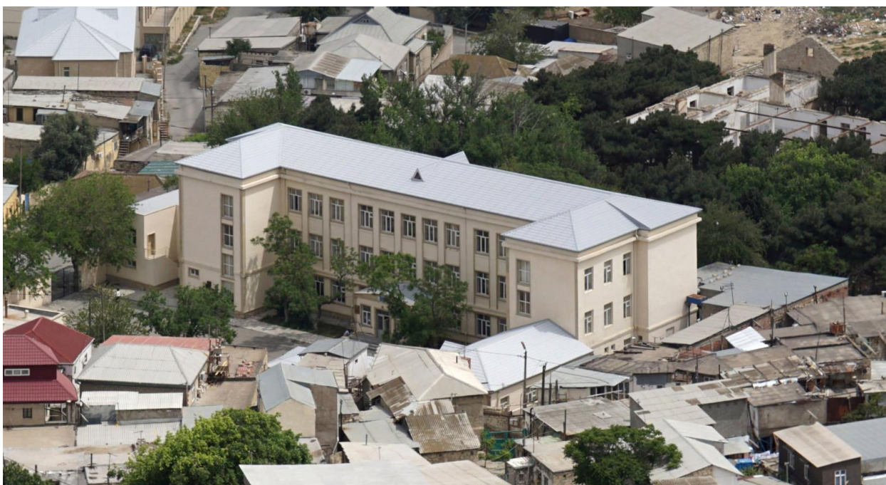
Пос. Биби-Эйбат (бывш. пос. Ханлар, ранее с. Шихово). Школа № 50. Фот. 2016 г.

Школа построена в с. Шихово в конце 1930-х – 1940 г. 19 Строилась как школа № 155, после окончания строительства и перевода туда старой школы № 50 за школой был сохранен старый номер.