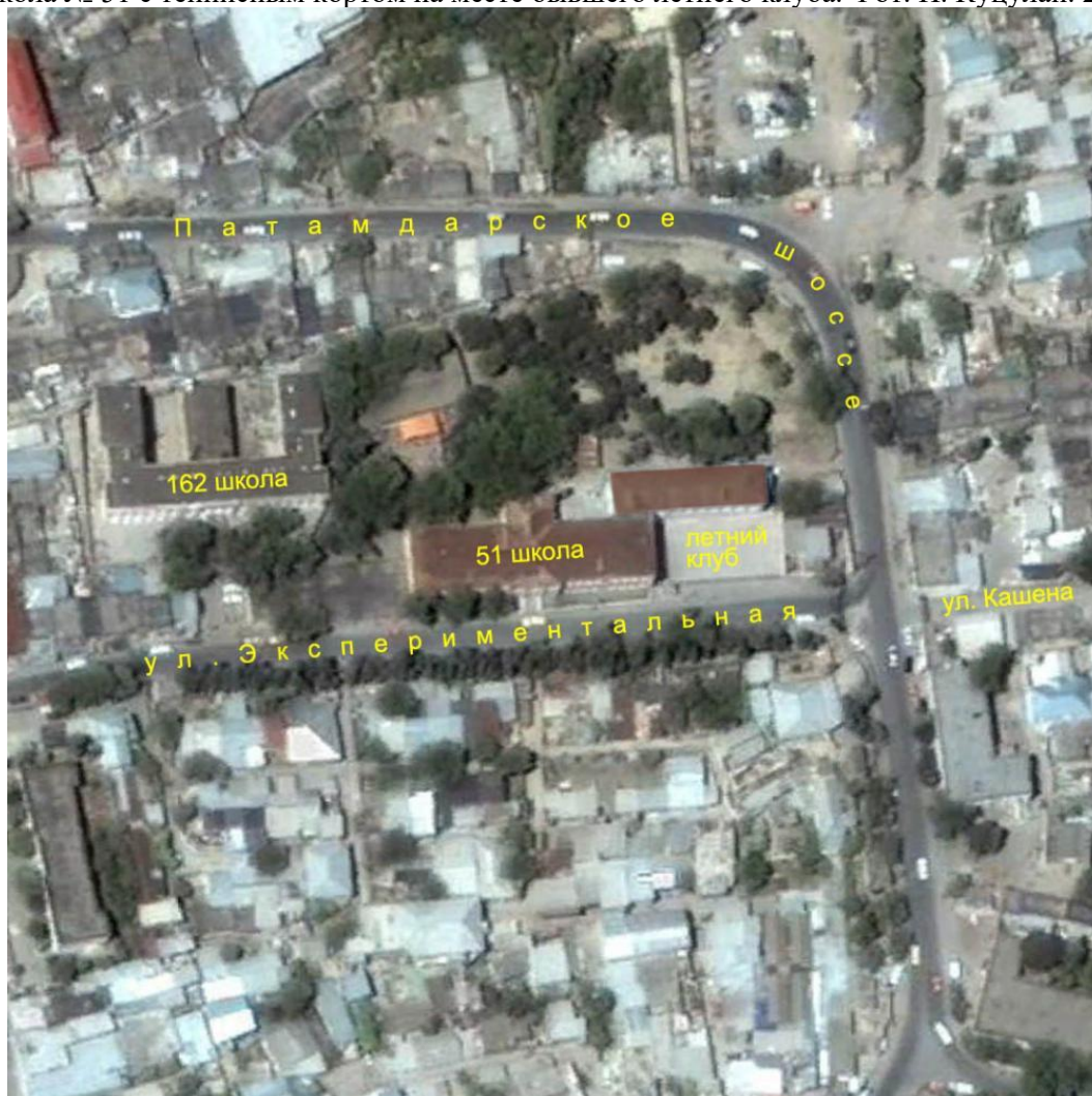
Школы № 162 и № 51 на спутниковом снимке 2005 г.