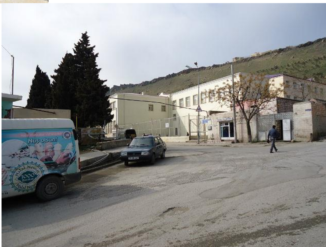
Школа № 51 с теннисным кортом на месте бывшего летнего клуба. 2012