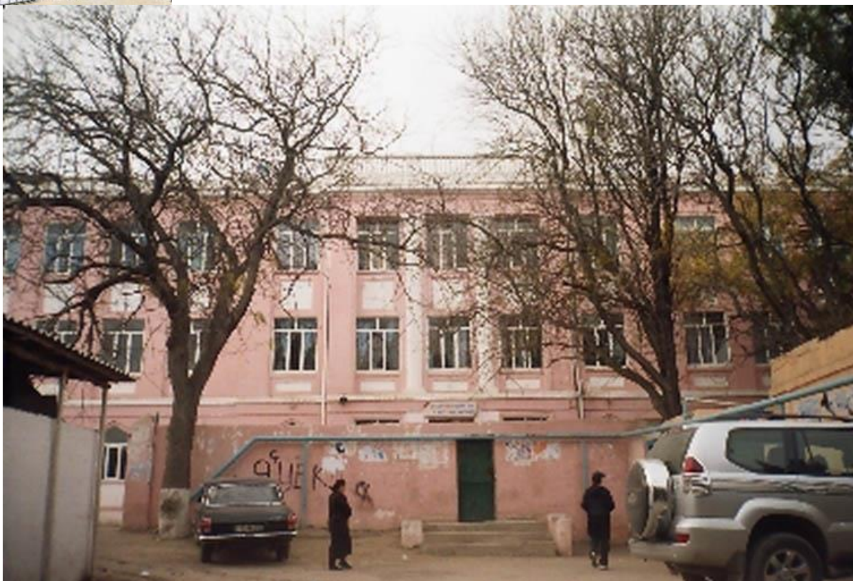
Школа № 162. Фот. Фуад Меликов, 2005 г.