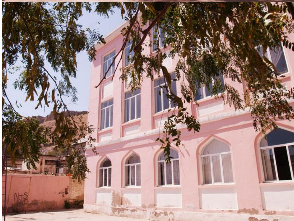
Школа № 162. август 2006 г.