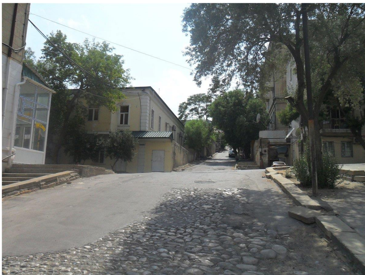
Здание бывшей мореходной школы. Угол ул. Ханлара и 2-го Баиловского переулка. 2015 г.