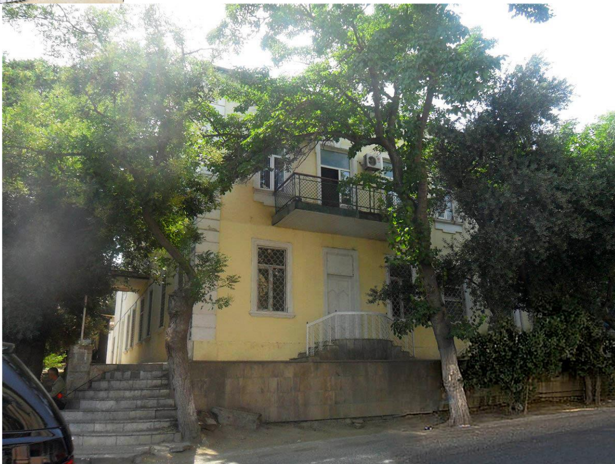
Здание бывшей мореходной школы. Угол ул. Ханлара и 3-го Баиловского переулка. 2015 г.