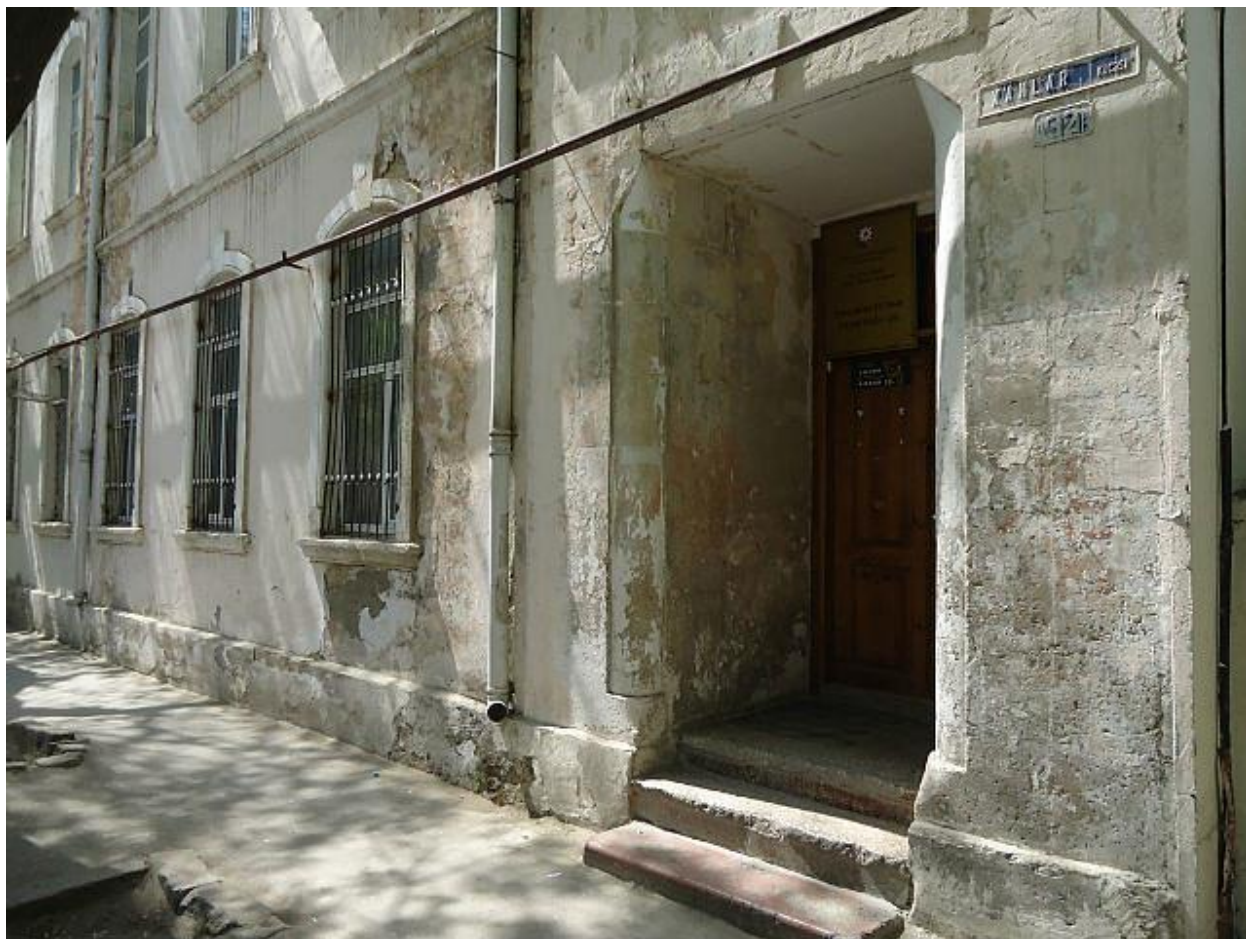
Здание бывшей школы Съезда нефтепромышленников (рядом впоследствии находилась школа 91). Фото И. Куцулап, 2012 г.

В Баилово – Биби-Эйбатском районе осталась лишь Баиловская школа, которая была переведена в новое помещение на 2-й Баиловской улице и даже значительно расширена.