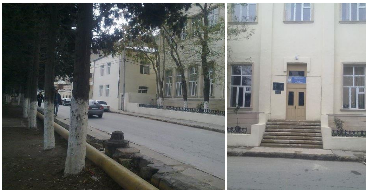
Школа № 51. 2012 г.