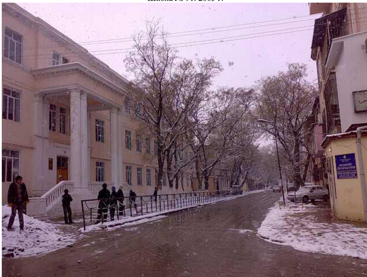
Школа №91. Дальше видно 2-хэтажное здание бывш. школы им.Желябова (впоследствии детсада).