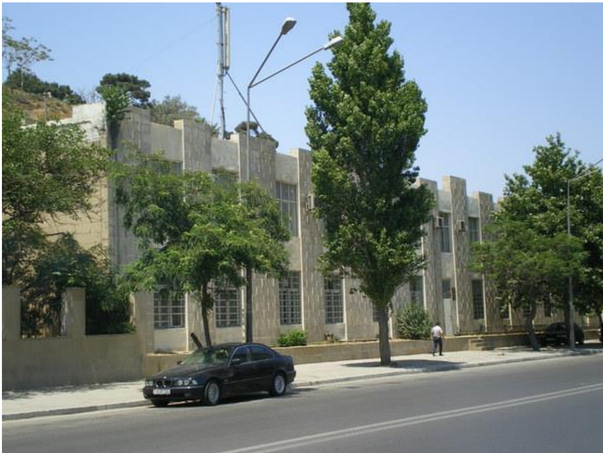
Нарсуд в перестроенном здании бывшей школы № 12. 2009 г.

1963 г. – Школа № 12 – 8-летняя азербайджанская и русская, пр. Нефтяников, 57. Там же школа рабочей молодежи № 83, средняя русская.