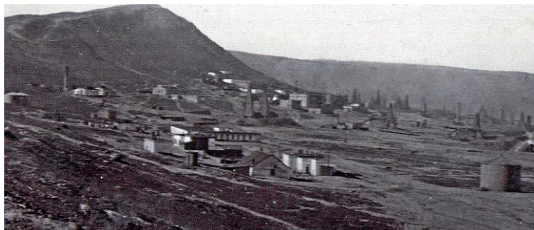
Биби-Эйбат. Общий вид. 1902 г.