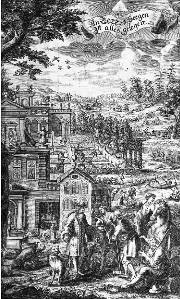
Abb. 3: Andreas Glorez, Vollständige Hauß- und Land-Bibliothec . 1701, Titelkupfer (Bayerische Staatsbibliothek München, Sign. 880119 2 Oecon. 54-1, Frontispiz)