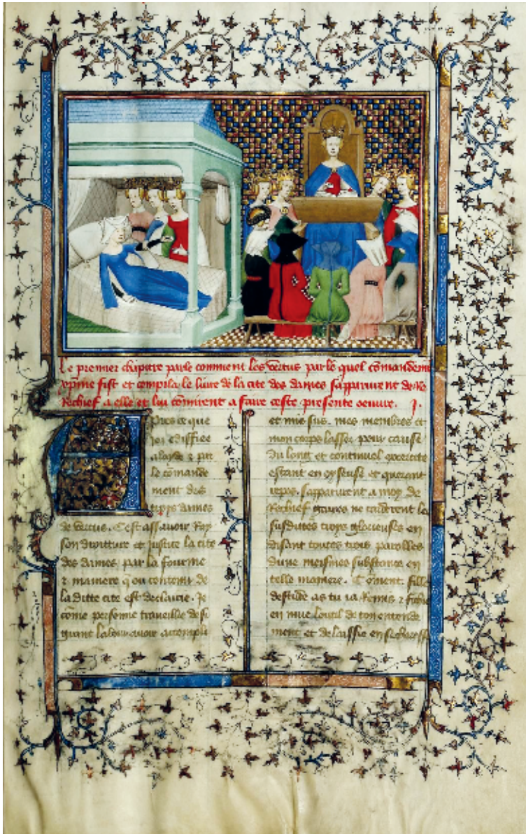
Abb. 1: Maître de la Cité des Dames, Frontispizminiatur des Livre des Trois Vertus (Boston Public Library, fr. Med. 101, f. 3r.)