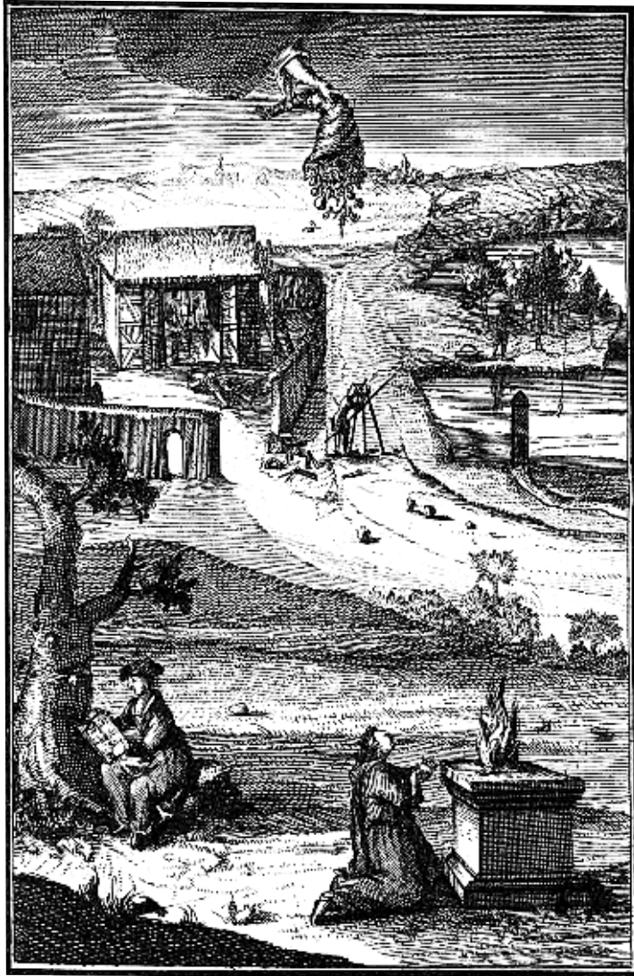
Abb. 4: Julius Bernhard von Rohr, Compendieuse Haushaltungs-Bibliothek , 1716, Frontispiz (Bayerische Staatsbibliothek München, Sign. 925315 Oecon. 1510, Frontispiz)