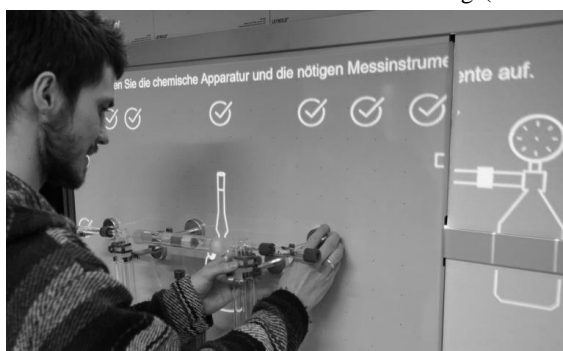
Abb. 3: Proband beim AR-unterstützten Aufbauen eines Chemieexperiments

Des Weiteren sollen Experimentieranleitungen in der Realität direkt erfahrbar gemacht werden: Die Bedienung eines Gerätes oder der Aufbau einer Versuchsanordnung (Abb. 3) wird durch die erweiterte Realität begreiflich gemacht. Die Anleitungsschritte sind dabei mit den Benutzerhandlungen rückgekoppelt. Das Verständnis von Anleitungstexten kann so unterstützt werden, da sie sich unmittelbar auf die realen Objekte oder Handlungen beziehen. Heute noch übliche sprachliche Anleitungen in der Form "Bringen sie Schalter (20) in Position (3) und lesen dann Display (12) ab." werden überflüssig. Zudem kann durch die AR-Unterstützung gezielt die Aufmerksamkeit der Lernenden gesteuert werden, indem Bedienelemente oder Teile des Experiments hervorgehoben werden.