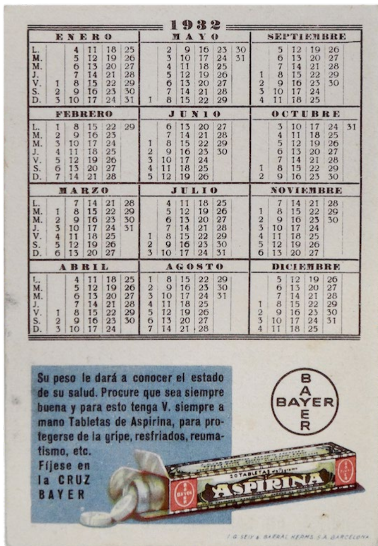
Figura 7. Calendario de bolsillo de 1932. Artículo promocional de la compañía Bayer