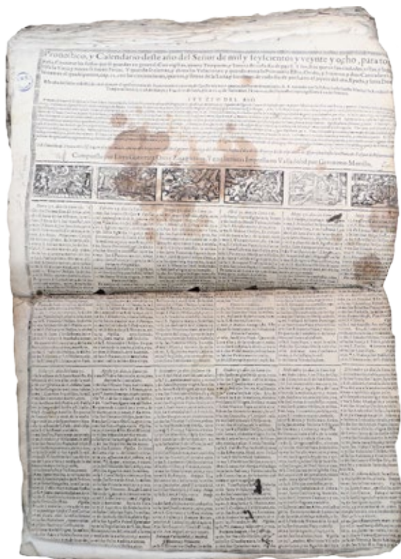
Figura. 1. Pronóstico y calendario de 1628

Fuente: Archivo Histórico Provincial de Valladolid (AHPV), Valladolid-España, Sección: Protocolo 1808, f. 139. Impreso en Valladolid por Gerónimo Morillo.