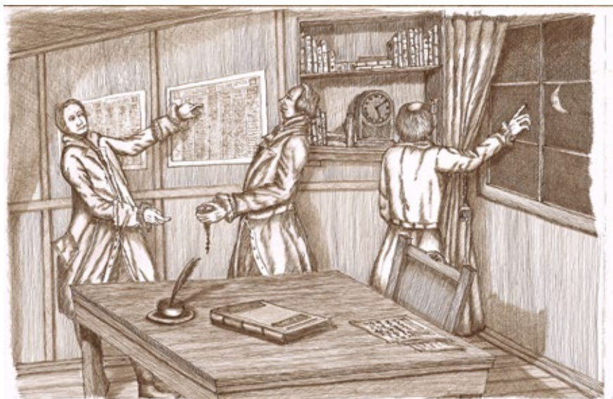
Figura. 2. Oficiales en el despacho consultando un calendario

Fuente: ilustración realizada por Ricardo Uribe Laguna a petición del autor.