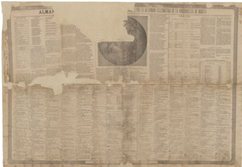
Figura 6. Alman[aque de 1888...] por la autoridad eclesiástica de la Arquidiócesis de Bogotá

Impreso en Bogotá por Imprenta de La Luz, director Marco A. Gómez