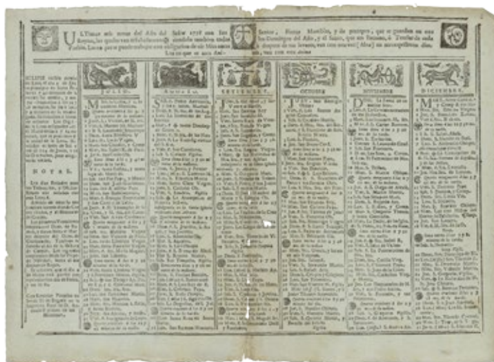
Figura. 5. Almanak ò calendario del año del Señor de 1778

Fuente: Archivo del Real Jardín Botánico de Madrid (ARJBM), Madrid-España, Fondo: José Celestino Mutis, 11 2 5 0001. Impreso en Bogotá por Antonio Espinosa de los Monteros.