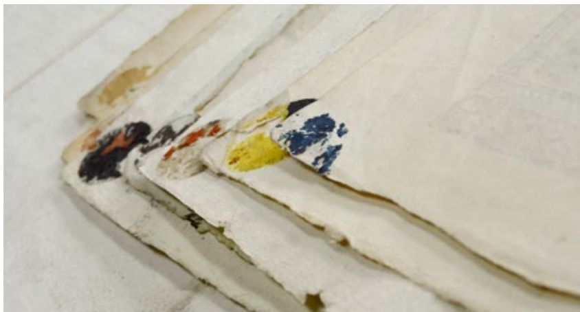
Figura. 3. Rastros de lacre o cera al reverso de algunos calendarios