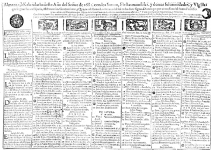
Figura. 4. Almanac, o Kalendario deste Año del Señor de 1681

Impreso en Madrid por Julián de Paredes.