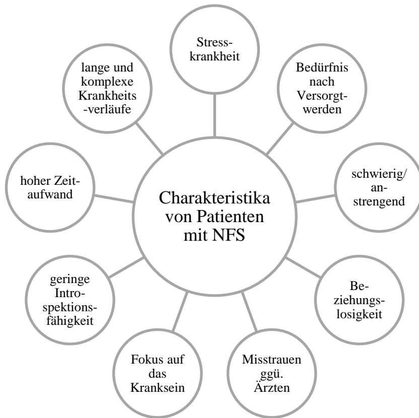
Abbildung 2 - Charakteristika von Patienten mit NFS