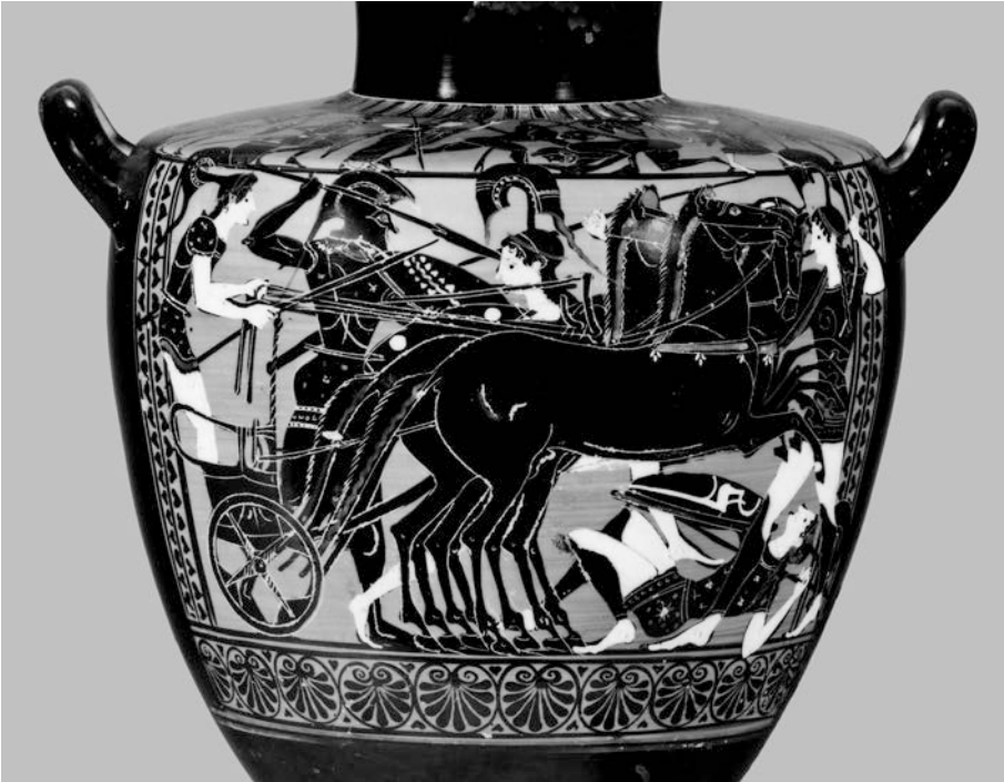
ABBILDUNG 6 Antiope unterstützt Theseus im Kampf gegen die Amazonen. Attisch schwarzfigurige Hydria um 510 v. Chr.

in London (Abb. 6) 46 lenkt Antiope neben Theseus den Streitwagen und unterstützt ihn gegen die Amazonen. 47