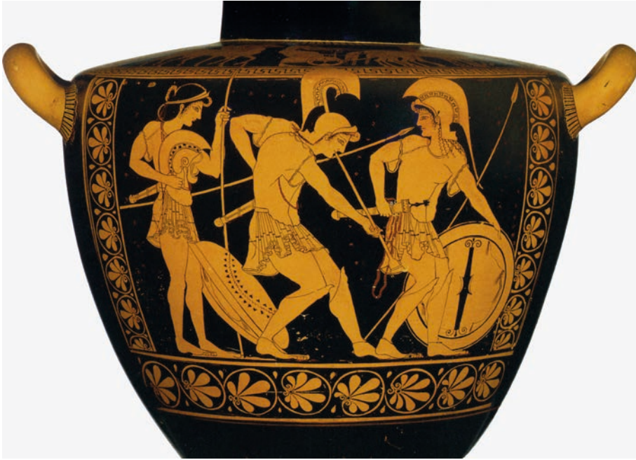
ABBILDUNG 4 Antiope und ihre Gefährtinnen. Attisch rotfigurige Hydria um 510 v. Chr.

wären sie kurz davor, in die Schlacht zu ziehen. Eine von ihnen stützt sich ruhig auf ihre Lanze, hat den Helm nicht übergezogen, trägt keine Beinschienen, ihr Schild ruht locker auf ihrem Oberschenkel. Ihr hochgebundenes Haar und die schmückende Binde charakterisieren sie als schöne Frau. An der mittleren Amazone, Antiope, die die Kriegstrompete nach unten hält, kann man sehen, dass auch sie das Instrument nur auf seine Funktionstüchtigkeit überprüft. Beim Blasen der Trompete als Aufruf zur Schlacht wird diese hingegen hoch in die Luft gehalten (vgl. Abb. 5b). Antiope und ihre Gefährtinnen werden hier also friedlich, aber grundsätzlich kampfbereit dargestellt. Entsprechend sehen wir die Amazonen auf der Rückseite der Oxforder Schale (Abb. 5b) 45 sogar gemeinsam mit Griechen in den Kampf ziehen. Und auf einer schwarzfigurigen Hydria