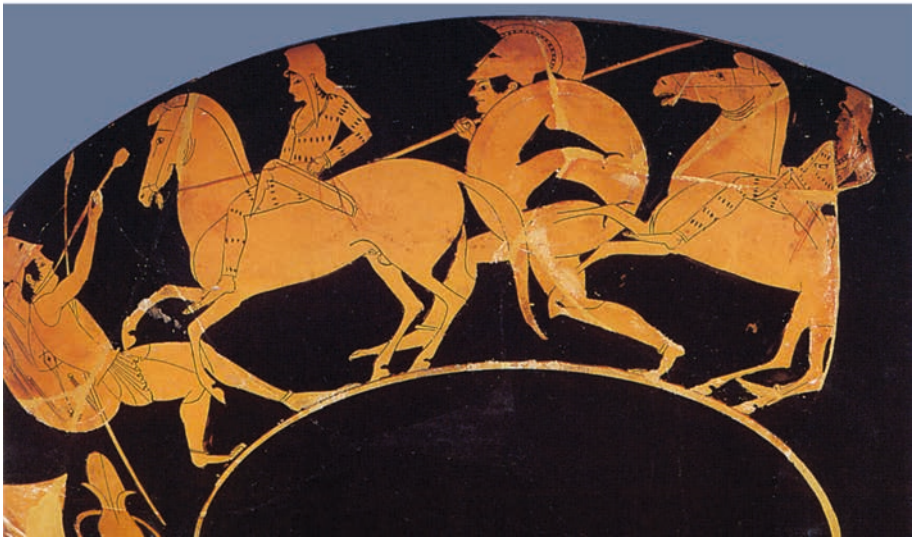
ABBILDUNG 5 Theseus entführt Antiope / Amazonen und Griechen ziehen gemeinsam in den Kampf. Außenseiten einer attisch rotfigurigen Trinkschale um 510 v. Chr. Nach Kauffmann-Samaras 1981, Taf. 684,9 und Vickers 1999, 31.