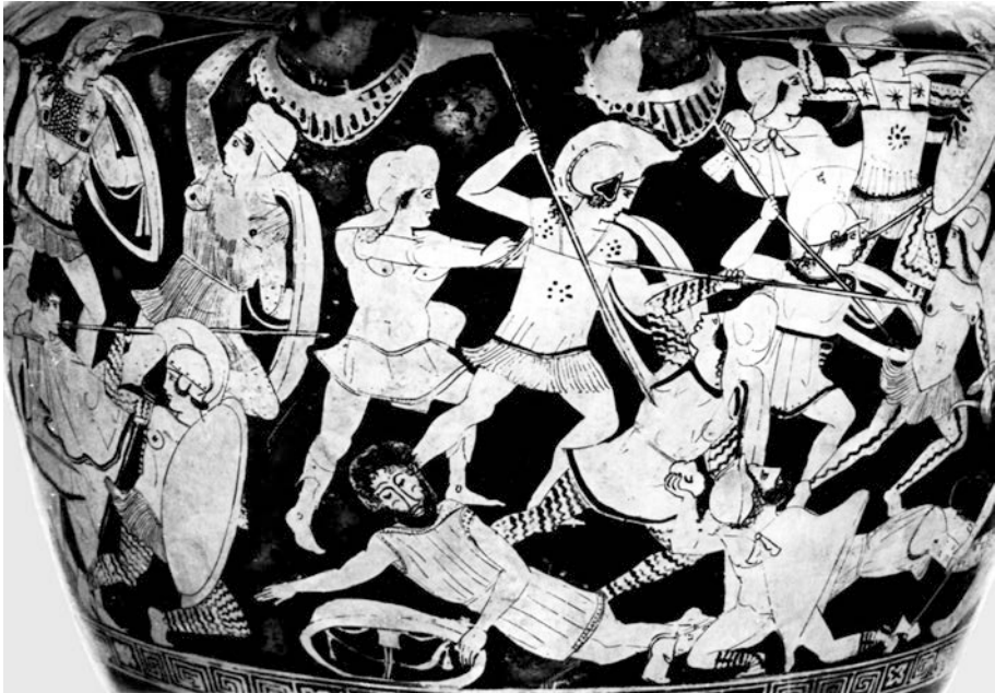
ABBILDUNG 8 Antiope am Rande der Schlacht gegen die Amazonen. Attisch rotfiguriger Volutenkrater um 450 v. Chr. Nach Devambež und Kauffmann-Samaras 1981, Taf. 480 Nr. 302.

Mitte des 5. Jhs. v. Chr. Hier rückt Theseus mit gezücktem Schwert gegen eine nach rechts ausweichende Amazone vor (Abb. 9). 54 Links sehen wir die inschriftlich genannte Antiope, wie sie sich, den Oberkörper zu Theseus gewandt, mit dem Unterkörper von diesem abwendet. Mit diesem ikonographischen Mittel hat der Maler versucht, die tragische Zerrissenheit ihrer doppelten Identität ins Bild zu setzen, der auch in dem gesenkten Kopf als Bildformel für Nachdenken zum Ausdruck kommt. Einerseits kämpft Antiope auf Seiten Athens, andererseits bleibt sie auch Amazone. Hier fassen wir also eine Situation, in der man in Athen jeder Amazone, auch Antiope, Wankelmüt unterstellt. Und damit kommt sie fürderhin als Stammutter der Athener nicht mehr in Betracht. Diese Funktionen werden nun Ariadne und Phädra übernehmen. Antiope selbst kommt auf den Vasenbildern nicht mehr vor.