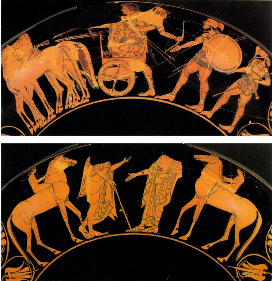
ABBILDUNG 3 Theseus entführt Antiope / Athener im Gespräch. Außenseiten einer attisch rotfigurigen Trinkschale um 510 v. Chr. Nach Staatliche Museen Berlin 1991, 192.

also einen Zusammenhang her zwischen der Entführung der Antiope nach Athen und dem friedlichen Zusammenleben im Bürgerverband.