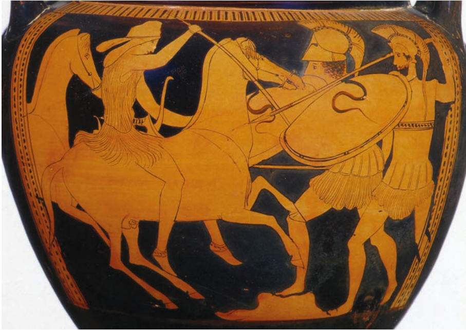
ABBILDUNG 7 Die Amazonen fallen ins attische Land ein. Attisch rotfiguriger Krater um 440 v. Chr. Nach Steinhart 2008, 88.

konnte so für bestimmte Teile der attischen Landbevölkerung Anknüpfungspunkte bieten, ohne dass diese sich direkt mit den Amazonen hätten identifizieren müssen.