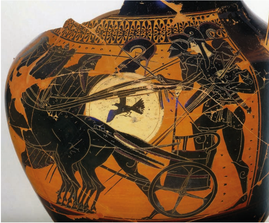
ABBILDUNG 1 Theseus entführt Antiope. Attisch schwarzfigurige Hydria um 510 v. Chr. Nach Wünsche 2008a, 172.

Die Amazonen zu besiegen gehörte im 6. Jh. v. Chr. zum Kanon der Heraklestaten, der durch Bezwingung aller Ungeheuer die Zivilisation sichert oder wiederherstellt. 19 Auf den attischen Vasenbildern, einer reichen und wichtigen Quelle für die frühen Mythenerezählungen, ist diese Geschichte auch das beherrschende Bildthema der Amazonendarstellungen. Über Theseus wurde in dieser Zeit, d. h. in der 2. Hälfte des 6. Jhs. v. Chr., eine andere Episode erzählt, nämlich der Raub der Amazone Antiope. Auf einer Hydria in München (Abb. 1) 20 sehen wir Theseus, wie er die Amazone, beischriftlich