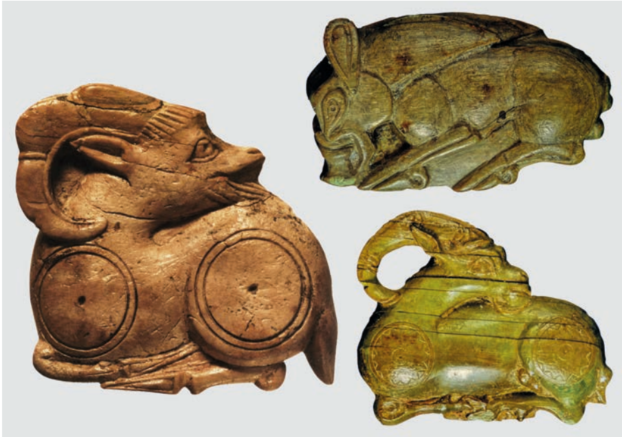
ABBILDUNG 10 Elfenbeinreliefs von Pferdegeschirren aus dem Artemision, um 630 v. Chr. Nach Smith 1908, Taf. 23,2a; 26,3a; Seipel 2008, 169–171 Nr. 121–123.

Steppenkunst des Kubangebietes haben. 68 Eine stilistische Analyse macht es meines Erachtens wahrscheinlich, dass die Elfenbeinreliefs lokal produziert worden sind. Die Ausgräber datieren die Reste der Kultbasen und die Beigaben ins 7. Jh. v. Chr., wohin auch der Stil der Plättchen zu weisen scheint. 69 In diese Zeit fällt die sogenannte Kimmerische Invasion Kleinasien. 70 Reitende Steppennomaden waren von Norden in Lydien und Ionien eingefallen und hatten unter anderem auch Sardes zerstört. Im Artemision sind aber für das 7. Jh. v. Chr. keine Zerstörungsschichten feststellbar. 71 Zusammen mit der lokalen Produktion der Elfenbeine spricht dies wohl für einen friedlichen Kontakt zwischen Reiternomaden und ephesischer Bevölkerung. Nach meiner Auffassung liegt hier der historische Kern der Gründungslegende. Noch bis zur Mitte des 6. Jhs. v. Chr. waren nämlich auf den Altären im Artemision Votivgaben zu sehen, die der Bevölkerung