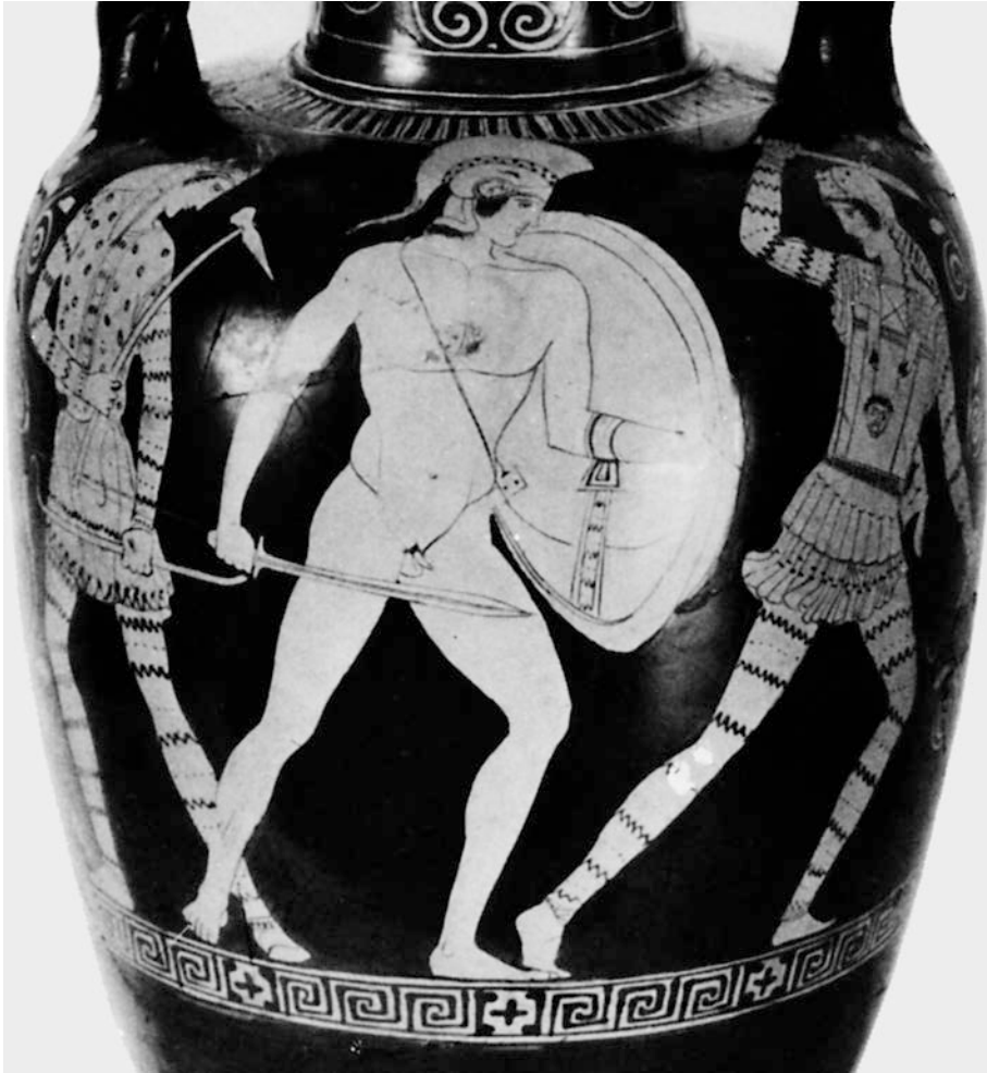
ABBILDUNG 9 Antiope und Theseus im Kampf gegen eine Amazone. Attisch rotfigurige Amphora um 450/440 v. Chr. Nach Hal Grafman 1974, 50 Nr. 15.

Die Beschränkung der ursprünglichen Erzählung auf eine antibarbarische Bedeutung seit der Mitte des 5. Jhs. v. Chr. macht es für uns schwer, die genauen Abläufe zu rekonstruieren. Und so bleiben neben den Vasenbildern als Indizien nur die Gräber der Amazonen, die noch in der Kaiserzeit Gegenstand kultischer Verehrung waren, außerdem die Erzählungen von der gewaltsamen Integration der nomadischen Fremden in die städtische Gemeinschaft unter Theseus und die ältere genealogische Verbindung der Theseussöhne mit der Amazone Antiope. Angeregt wurde diese Mythen-erzählung durch uralte Monumente, die in archaischer Zeit erklärungsbedürftig waren: