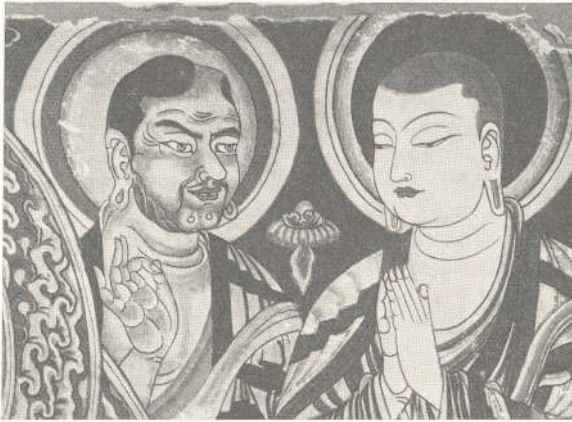
Abb. 84. Ein rotblonder, helläugiger tocharischer Buddhiste neben einem Buddhisten überwiegend innerasiatischer Rasse, Wandgemälde aus Turfan. (Nach v. Le Coq, Ubforscho)