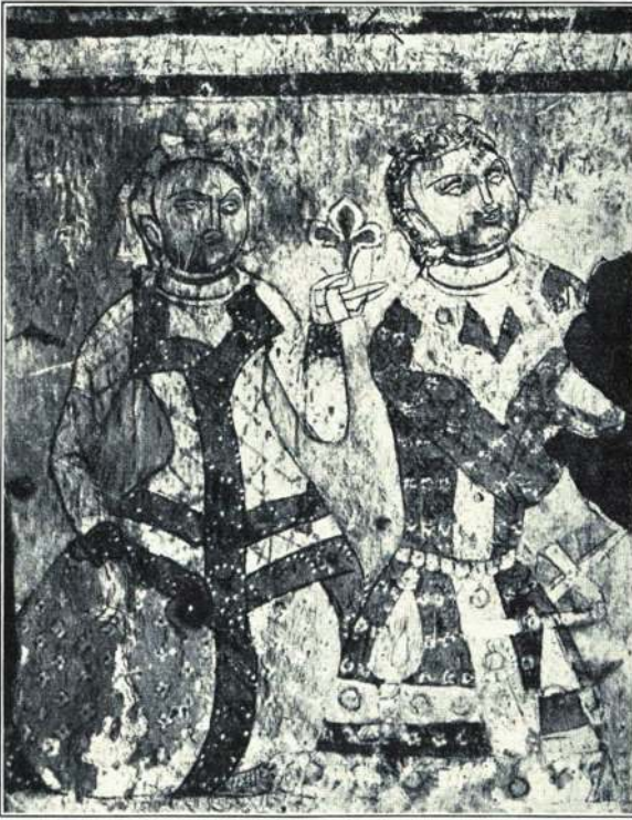
Abb. 87. Tocharischer Ritter mit Edeldame. Stifter- bild aus einem Höhlenkloster bei Kutscha. Etwa 700 n. Chr. (Nach v. Le Coq, Bilderatlas, 1928)