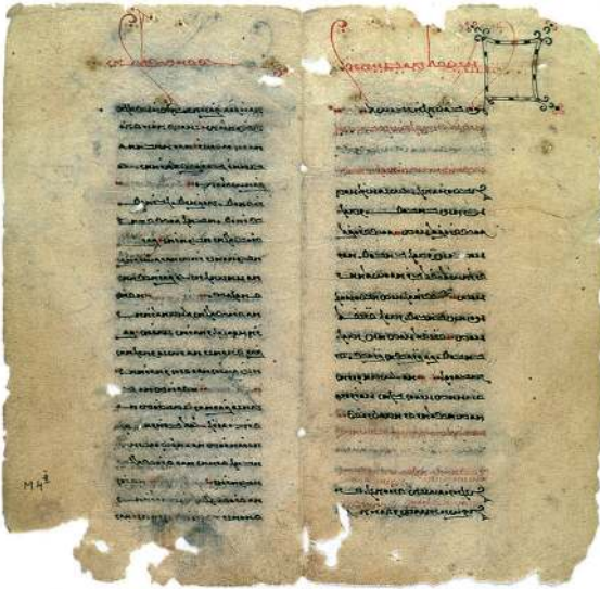
Abb. 2 Manichäisches Schriftfragment.

weise waren ebenfalls in Berlin eingetroffen: Wandgemälde und Porträts zeigten rothaarige, blonde und blauäugige Menschen, die wohl das zur Sprache gehörende Volk, die indoeuropäischen Tocharer, darstellten. 22 Aus den gefundenen Objekten – so der Rückschluss – konnten Hinweise über die jeweiligen Kulturen gewonnen werden, die die Seidenstraße seit den Jahren schriftlicher Aufzeichnung besiedelt hatten. In diesem Gedanken hatte die Verbreitung von Artefakten auf entpersonalisierten Wegen, wie durch Handelsbeziehungen, keinen Platz.