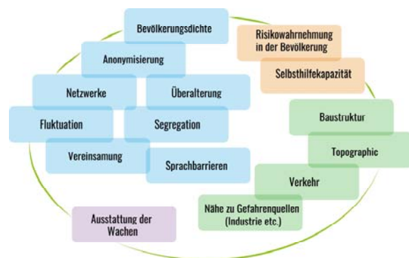
Abbildung 3 Risiken aus Sicht der Feuerwehren in Wuppertal und Stuttgart

nell derart aufgestellt, dass ihre Wachen in der Innenstadt positioniert sind – die Freiwillige Feuerwehr hingegen die Wachen am Stadtrand betreibt. Diese historische Entwicklung der Feuerwehren ist eng geknüpft an die der Stadtentwicklung und führt zu der besonderen Zusammenarbeit zwischen den Feuerwehren, bei der die BF die Versorgungsleistung für die Innenstadt und die FF für die Randgebiete übernimmt. Neben den Trends der Überalterung, Vereinsamung und Anonymisierung in der Innenstadt wäre die Heterogenität in der Bevölkerung durch Sprachbarrieren eine Herausforderung, die sich in Kontaktschwierigkeiten äußere. Fehlende Sprachkenntnisse in der Feuerwehr und den Hilfsorganisationen, die eine Notrettung unterstützen, machen eine schnelle und gezielte Versorgung schwierig. Es wurde von den Expert*innen außerdem von Ereignissen gesprochen, in denen sie in ihrer professionellen Rolle von Betroffenen nicht anerkannt wurden, was zu Angriffen oder zu selbstgefährdendem Verhalten geführt habe. Sicherheit und Risiko wurden als Begriffe in den Interviews auch als Eigenschutz operationalisiert. Für die Arbeit in den BF und FF sei diese prioritär.