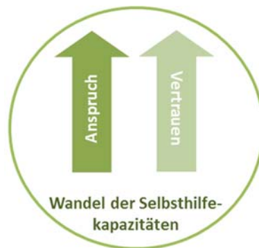
Abbildung 5 Anspruch der Bevölkerung gegenüber der Polizei

In den Interviews mit den Expert*innen der Polizei wurde Sicherheit als Eigensicherung und -schutz übersetzt. Immer wieder wurde auf die Ambivalenzen verwiesen, die die Rolle und Aufgaben der Polizei im alltäglichen Streifendienst und damit im operativen Kontakt mit der Bevölkerung prägen. Einerseits werden sie als Retter*innen und Helfer*innen, andererseits jedoch gleichsam als „Feinde“ wahrgenommen. Dieses ambivalente Bild in der Bevölkerung kann im Einsatz zu einer Gefahr für die Ordnungskräfte selbst wie auch für die Betroffenen werden. Probleme im Kontakt mit der Bevölkerung sahen die Expert*innen, vergleichbar mit der Feuerwehr, im Anspruch und veränderten Erwartungen, die ihnen entgegengebracht werden. Dabei wird eine Abnahme von Selbsthilfefähigkeiten beobachtet, die sich bspw. in Meldungen äußert, die als Zivilrechtsstreitigkeiten identifiziert werden und daher keinen Einsatz auslösen. Der veränderte Anspruch in der Bevölkerung wurde in Interviews auch als eine Zunahme des Vertrauens gegenüber der Polizei gedeutet.