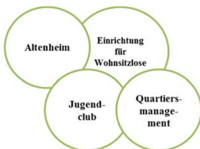
Abbildung 7 Sample "Sozialen Einrichtungen"

Die Stadt ist Trägerin einiger sozialer Einrichtungen, die der allgemeinen Wohlfahrt dienen und auf städtischer bzw. kleinräumigerer Quartiers-ebene organisiert sind. Daneben gibt es weitere Einrichtungen, die über eine freie Trägerschaft finanziert werden. Im Sample konnten Altenheime, Einrichtungen für wohnsitzlose Frauen und Männer, ein Quartiersbüro sowie ein Jugendclub berücksichtigt werden.