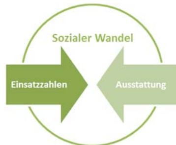
Abbildung 2 Versorgungssicherheit im Spannungsverhältnis

sich in einem Spannungsverhältnis aus gestiegenen Einsatzzahlen bzw. Verschiebungen der Aufgabengebiete und der Grenzen, die durch institutionelle Strukturen und Ausstattung gesetzt sind.