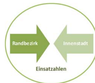
Abbildung 6 Unterschiede in den Meldeaktivitäten der Bevölkerung in Wuppertal

Die befragten Expert*innen des Ordnungsamtes bemerken, dass sie die Stadt Wuppertal für eine objektiv sehr sichere Stadt halten und formulieren die Notwendigkeit, die verschiedenen subjektiven Wahrnehmungen und Bewertungen verschiedener Bevölkerungsgruppen in den Blick zu nehmen. Was für den einen störend sei, werde von anderen Personen überhaupt nicht wahrgenommen. Insbesondere der Wohnort, das Alter und die soziale Herkunft in bestimmten Stadtteilen der Untersuchungsstadt seien nach Ansicht der Befragten relevant für die Wahrnehmung von bedrohlich empfundenen Situationen, Orten oder Personen. Ein Kontrast bildet sich demnach zwischen den Bezirken und Quartieren der Innenstadt bzw. denen in Randlage.