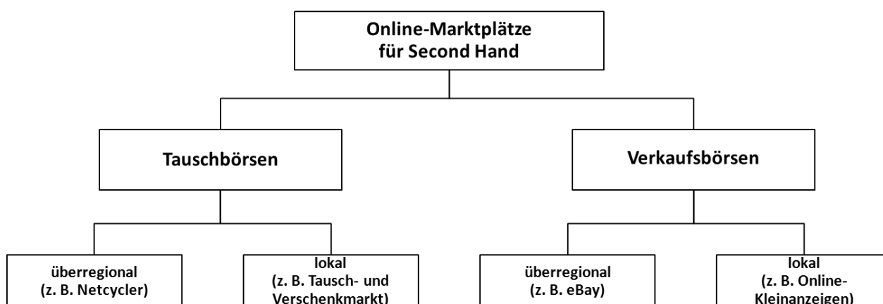
Abb. 3.2: Formen und Geschäftsmodelle für Online-Marktplätze für Gebrauchtwaren (eigene Darstellung)

Unter den Online-Marktplätzen für Gebrauchtwaren kann zwischen Tauschbörsen und Verkaufsbörsen unterschieden werden. Beide Typen ermöglichen die Weitergabe von gebrauchten Konsumgütern zwischen Privatpersonen (C2C). Die Leistung der jeweiligen Internetplattform liegt dabei in der Vermittlung und Organisation des Such-, Anbahnungs- und Abwicklungsprozesses zwischen den Tauschpartnern. Zudem kann bei beiden Typen zwischen überregionalen und lokalen Angeboten differenziert werden. Während ersteres Tauschgeschäfte unabhängig von der physischen Entfernung zwischen Anbieter und Nachfrager (Ortsungebundenheit) ermöglicht, ist der zweite Typ auf Transaktionen innerhalb lokaler Gruppen ausgerichtet (vgl. Abb. 3.2).