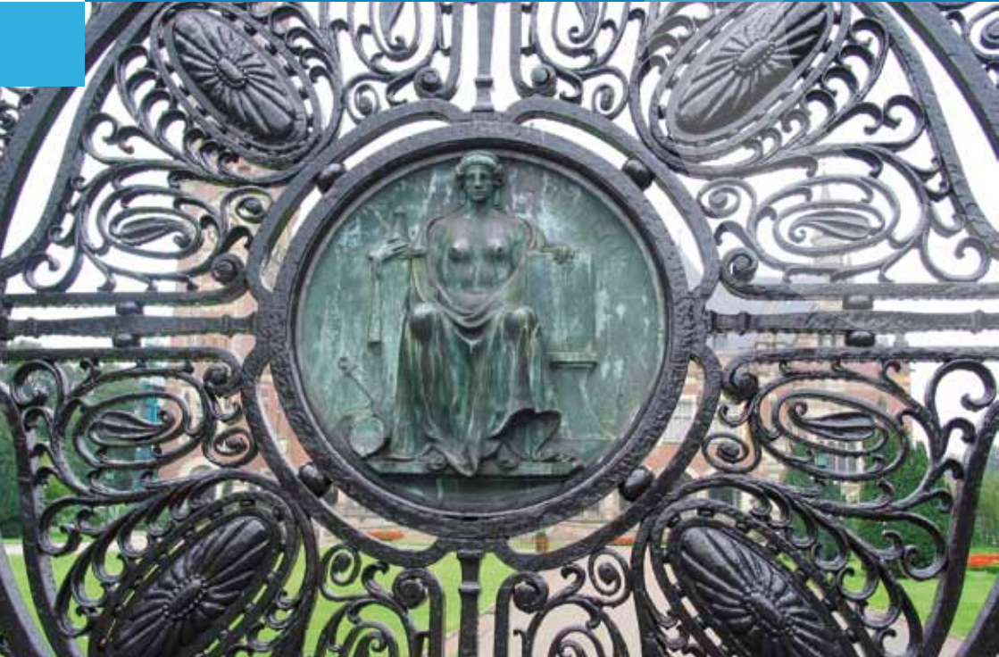
Justitia auf dem Tor des Internationalen Gerichtshofs in Den Haag