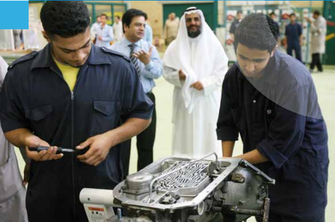
Berufsbildungsprojekt der GTZ in Kuwait

Technische Zusammenarbeit (TZ) | Technologietransfer | Terrorismusbekämpfung | Todesstrafe | Treuhandrat