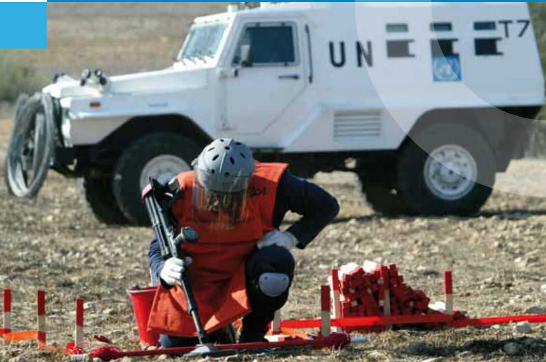
Minenräumung auf Zypern

Haushalt der Vereinten Nationen | Hilfswerk der Vereinten Nationen für Palästina-Flüchtlinge im Nahen Osten (UNRWA) | Humanitäre Hilfe | Humanitäres Minen- und Kampfmittelräumen