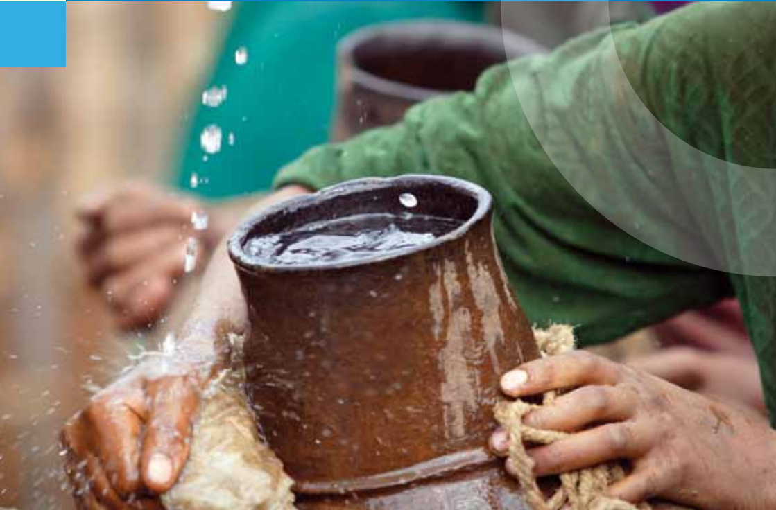
Trinkwasserhilfe für Äthiopien

Entwicklungsprogramm der Vereinten Nationen (UNDP) | Entwicklungszusammenarbeit (EZ) der Vereinten Nationen | Ernährung- und Landwirtschaft | Europäische Union und Vereinte Nationen