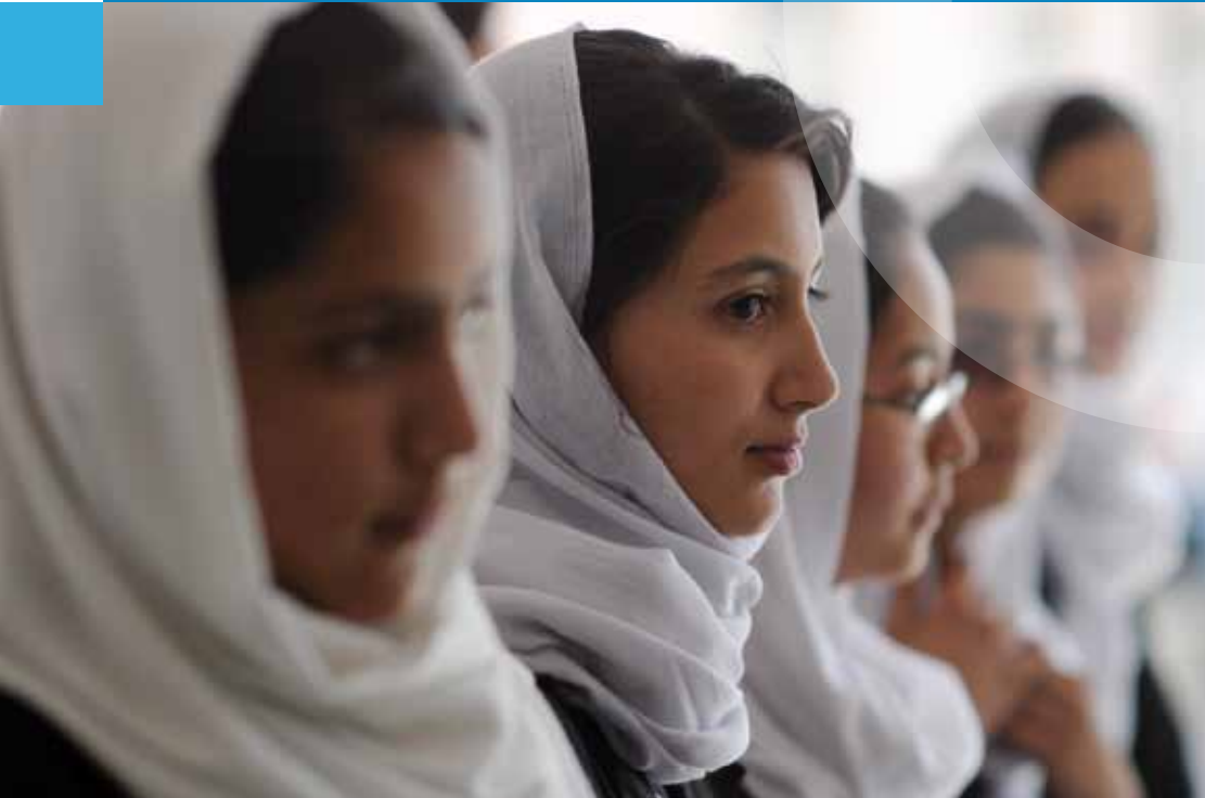
Schule in Afghanistan

Organe der Vereinten Nationen | Organisation der Vereinten Nationen für Bildung, Wissenschaft und Kultur (UNESCO) | Organisation der Vereinten Nationen für industrielle Entwicklung (UNIDO) | Organisation des Vertrages über das umfassende Verbot von Nuklearwaffenversuchen (CTBTO) | Organisation für das Verbot chemischer Waffen (OPCW)