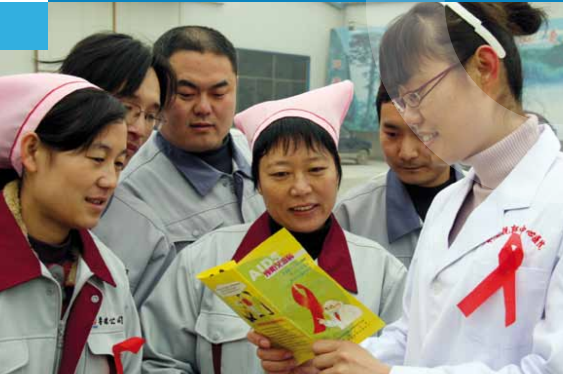
Weltaidstag in China

Umweltpolitik der Vereinten Nationen | Umweltprogramm der Vereinten Nationen | UNAIDS | UNESCO-Bildungsinstitute in Deutschland | Uniting for Peace | Universität der Vereinten Nationen (UNU)