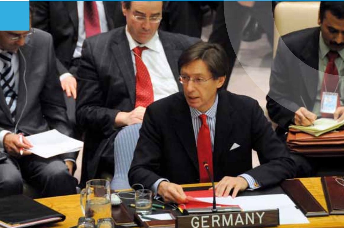
Der deutsche VN-Botschafter Peter Wittig spricht im Sicherheitsrat.

Sanktionen | Schutzverantwortung (Responsibility to Protect) | Seerecht | Sekretariat der Vereinten Nationen | Selbstbestimmungsrecht | Sicherheitsrat der Vereinten Nationen | Sicherheitsratsreform | Sonderorganisationen der Vereinten Nationen | Statistikkommission | Stimmrecht und Abstimmungsverfahren | Suchtstoffkommission (CND) | System der Vereinten Nationen