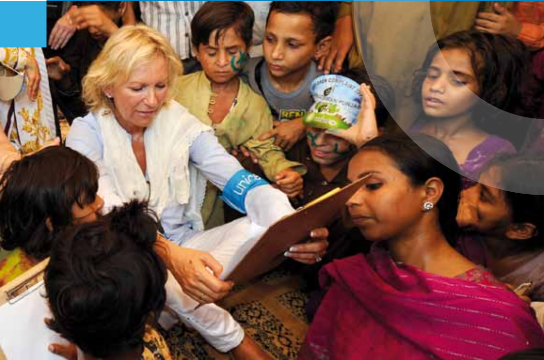
Unicef-Botschafterin Sabine Christiansen im Gespräch mit Straßenkindern in Lahore/Pakistan

Kapitalentwicklungsfonds der Vereinten Nationen (UNCDF) | Katastrophenvorsorge | Kinderhilfswerk der Vereinten Nationen (UNICEF) | Kleinwaffenkontrolle | Klimarahmenkonvention (UNFCCC) | Kollektive Sicherheit | Kommission für Friedenskonsolidierung (PBC) | Kommission für Internationales Handelsrecht (UNCITRAL) | Kommission für Nachhaltige Entwicklung (CSD) | Kommission Für Soziale Entwicklung (CsocD) | Kommission für Verbrechenverhütung und Strafrechtspflege (CCPCI) | Konferenz der Vereinten Nationen für Handel und Entwicklung (UNCTAD) | Konfliktprävention | Kyoto-Protokoll