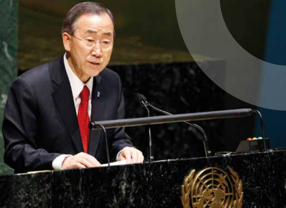
Ban Ki-moon, seit 2007 Generalsekretär der Vereinten Nationen

Generalsekretär | Generalversammlung der Vereinten Nationen | Generalversammlung, Ausschüsse | Genfer Gruppe | Gewaltverbot | Gipfel- und Weltkonferenzen der Vereinten Nationen | Global Compact | Global Governance und die Vereinten Nationen | Globale Umweltfazilität (GEF) | Gründungsgeschichte der Vereinten Nationen | Gruppenbildung