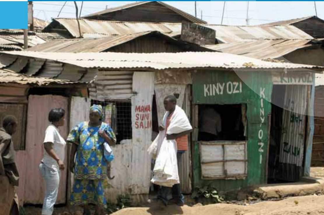
Slumbildung als Problem der Stadtentwicklung

P Politische Missionen der Vereinten Nationen | Privatsektor und Vereinte Nationen | Privilegien und Immunitäten der Vereinten Nationen | Programm der Vereinten Nationen für Wohn- und Siedlungswesen (UN-HABITAT)