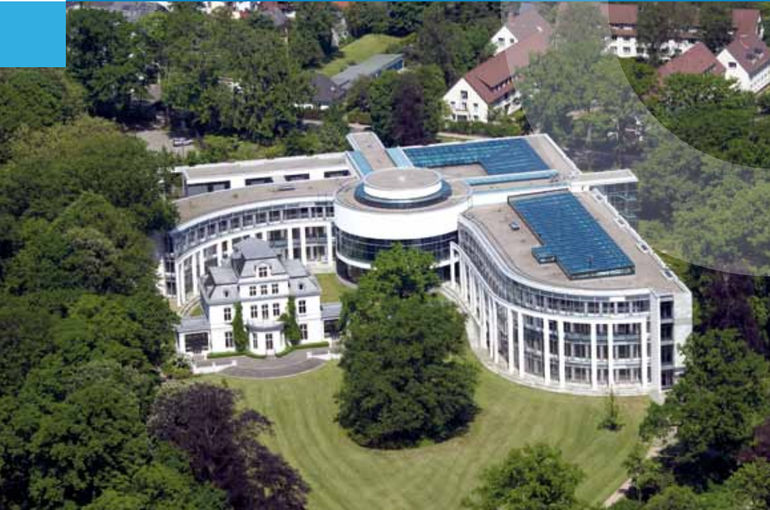
Internationaler Seegerichtshof in Hamburg

Indigene Völker | Internationale Arbeitsorganisation (ILO) | Internationale Atomenergie-Organisation (IAEO) | Internationale Bank für Wiederaufbau und Entwicklung (IBRD) | Internationale Entwicklungsorganisation (IDA) | Internationale Fernmeldeunion (ITU) | Internationale Finanz-Corporation (IFC) | Internationale Meeresbodenbehörde (IMB) | Internationale Seeschiffahrts-Organisation (IMO) | Internationale Sonderstrafgerichtshöfe | Internationale Zivilluftfahrtorganisation (ICAO) | Internationaler Gerichtshof (IGH) | Internationaler Seegerichtshof (ISGH) | Internationaler Strafgerichtshof (IStGH) | Internationaler Suchtstoffkontrollrat (INCB) | Internationaler Währungsfonds (IWF) | Internationales Handelszentrum (ITC) | Interne Aufsicht/ Rechnungsprüfung | Interventionsverbot