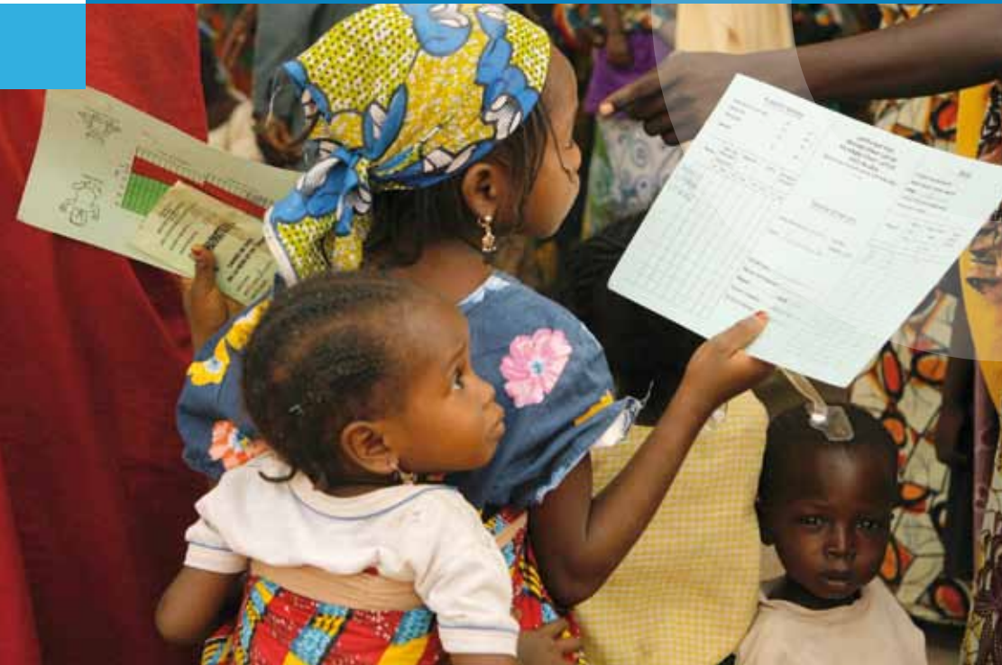
Warten auf Gesundheitshelfer im Süden des Niger

Menschenrechtspakte und ihre Überprüfungsorgane | Menschenrechtspolitik der Vereinten Nationen | Menschenrechtsrat (MRR) | Migration und Entwicklung in den Vereinten Nationen | Millenniums-Entwicklungsziele (MDG) | Millenniumsgipfel 2000 und Folgeprozesse | Minderheitenschutz | Mitgliedstaaten der Vereinten Nationen | Model United Nations (MUN)