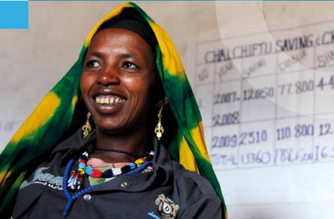
Empfängerin eines Mikrokredits im Projektgebiet Babile in Äthiopien

Waffenregister | Waffen- und Landminenübereinkommen | Weltbankgruppe | Weltberichte | Weltgesundheitsorganisation (WHO) | Welthandelsorganisation (WTO) | Weltorganisation für geistiges Eigentum (WIPO) | Weltorganisation für Meteorologie (WMO) | Weltpostverein (UPU) | Weltraumausschuss (UNCOPUOS) | Welttourismusorganisation (UNWTO) | Weltverband der Gesellschaften für die Vereinten Nationen (WFUNA)