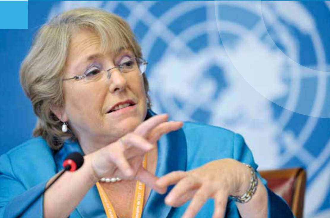
Michelle Bachelet, Leiterin der Sekretariatseinheit „UNWomen“