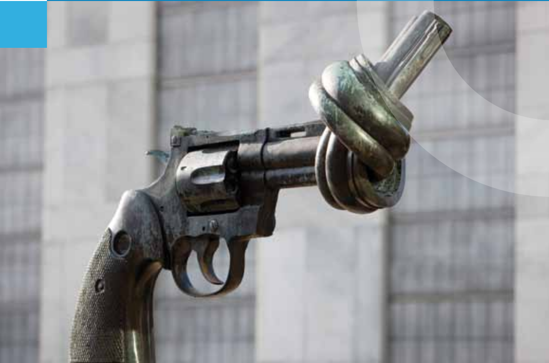
Skulptur des Künstlers Carl Fredrik Reuterswärd vor dem VN-Hauptquartier in New York City

2. Die Abrüstungskommission der Vereinten Nationen (United Nations Disarmament Commission – UNDC) ist ein Hilfsorgan der Generalversammlung, dem alle Mitglieder der