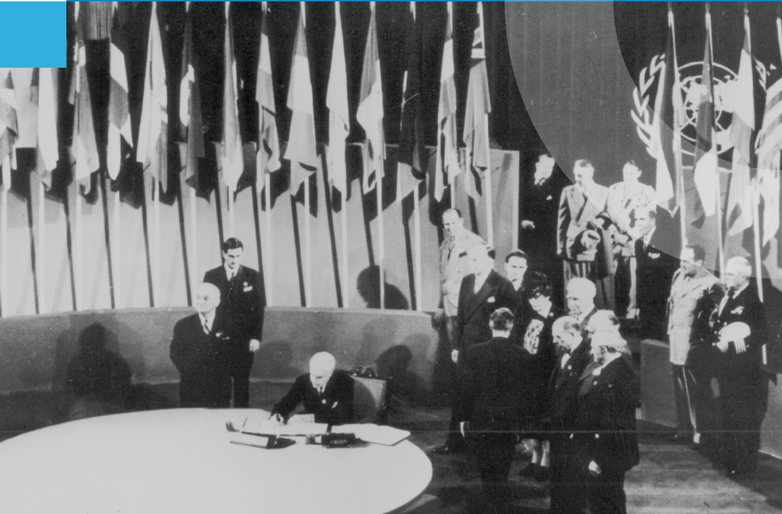
Unterzeichnung der „Charta der Vereinten Nationen“