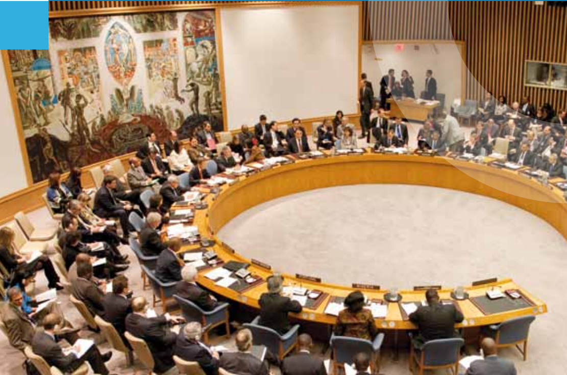
Sitzung des UN-Sicherheitsrats

B Beobachterstatus | Berichtssystem für Militärausgaben | Beschluss, Deklaration, Erklärung, Resolution | Bevölkerungsfonds der Vereinten Nationen (UNFPA) | Bonn als VN-Standort | Büro der Vereinten Nationen für Projektdienste (UNOPS)