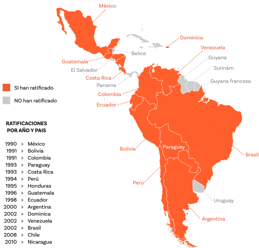
Imagen 1: Ratificación del Convenio 169 de la OIT en América Latina

como las ciencias políticas y jurídicas, campos desde donde comienza a producirse una mayor cantidad de estudios y capacitaciones que buscan hacer frente a esta nueva etapa.