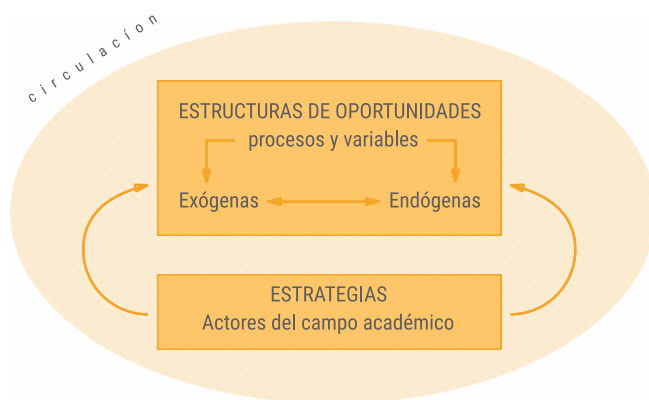
Figura 1: Dimensiones de Análisis del Papel de los Agentes de la Circulación

(los) posicionamiento(s), las trayectorias que de éstos derivan, y las estrategias que evidencian las transformaciones y adaptaciones de este debate en el espacio local.