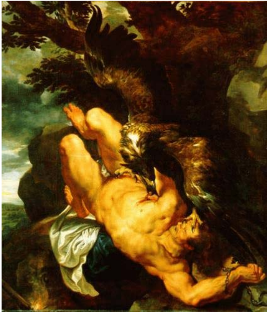
Prometheus gefesselt 1611 n.Ch. von P.P. Rubens