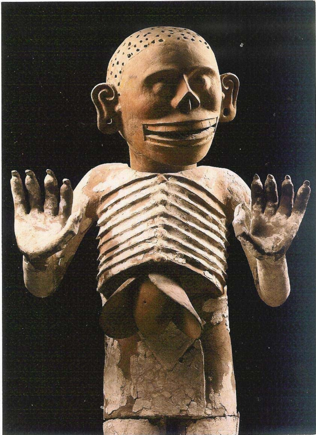
Mictlantecuhtli, n.Ch. 1480, Aztec. Die Leber als Sitz der Seele (aufgrund der hohen Durchblutung) hängt vom Magen des Mictlantecuhtli, Todesgottes der Azteken.